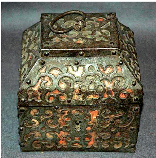
Ларец XVIII век. Великий Устюг, Россия. Из собрания ОНИ ГРМ

Выше были рассмотрены описи имущества одних из наиболее крупных монастырей России. Тем не менее, количество и качество упомянутых сундучных изделий гораздо менее значительно по сравнению с предметами из боярских описей 3 . Возможно, некоторую роль здесь сыграло то обстоятельство, что они составлены гораздо раньше (почти на столетие) и таким образом дают представление о более раннем этапе истории русского сундучного производства, со своими особенностями, не характерными для более позднего времени. Чтобы проверить этот факт, следует учесть монастырские описи