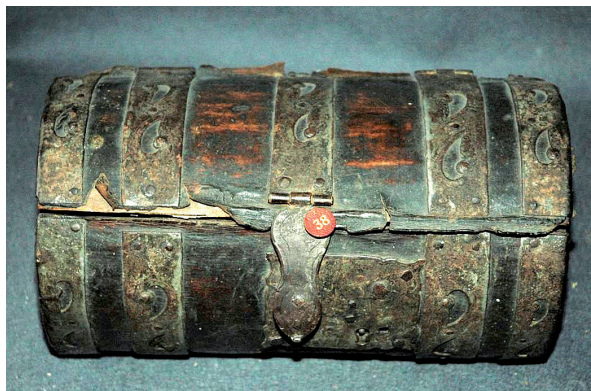
Баул. XVIII век. Россия. Из собрания ОНИ ГРМ

В описи его имущества указаны: «шкатунка осьмигранная, укрепленна железом красным и белым», «шкатунка немецкая черная, о пяти ящиках; у ней двери створные, а в ящиках оклеено тафтою алою; 3 ключа и скобы и колцы посеребрены», «шкатуна створчатая о трех замках, оклеена красной кожей, обита железом прорезным», «шкатунка немецкая на шти подножках витых, а вней в середине створ двойной... да посторон семь ящиков выдвигаемых: да с лица во всей шкатуне двенадцать ящиков больших и малых выдвигаемых; а по ящикам с лица нарезаны, по черепаше, травы оловом; на веру шкатуны гзымз, а у него внизу две личины человеческих с крыльями золочеными... под шкатуною внизу, меж поножек, личина да две резьбы золоченых... Цена сто рублей» (Розыскные дела 1893: 8, 16, 23, 40). Далее упомянуто значительное количество «шкатунок немецких»: «оптешная», «оклеена бархатом зеленым», «оклеена черною кожей», «с лица писана по