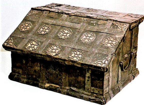
Подголовник. 1750 г. Холмогоры, Россия. Из собрания ОНИ ГРМ

В 1887 г. в ЧОИДР (Чтения в Обществе истории и древностей российских) была опубликована «Роспись всяким вещам, деньгам и запасам, что осталось по смерти Большого боярина Никиты Ивановича Романова и дачи по нем на помин души» (ЧОИДР 1887: 3–120). Никита Иванович Романов (1607–1654) — двоюродный брат царя Михаила Федоровича Романова. Боярин имел пристрастие ко всему иноземному и считался одним из самых богатых людей своего времени. Среди его имущества упомянуты: «шкатула дерево черное гебан врезываны раковины в шкатуле ящики выдвигаемые (вверх)», «шкатулка дубовая ящики выдвигаемые», «коробья лубяная с каменными судами и шанданами», «шкатула с цынбалы и с часами писаная», «сундук велик окован железом, а в нем 11 коробей с деньгами» («коробьи окованные»), «сундук дубовый невелик окован местами», «в кипарисном сундуке платья», «в коробочке осиновою окованой фунт шелков разных цветов», «сундук нарезан по черни раковинами прибиваны медными гвоздиками, а у сундука два замка и с петли да две скобы и наугольники медные золочены, а в сундуке внутри наведено чернью, а в кровле по черни написаны травы да две птицы, на сундуке лагалище сукно байковое красное» (ЧОИДР 1887: 4, 5, 42, 67, 71, 73, 84). Далее упоминаются другие сундуки: «сундук липовый окован железом», «сундук литовский», «сундук деревян-