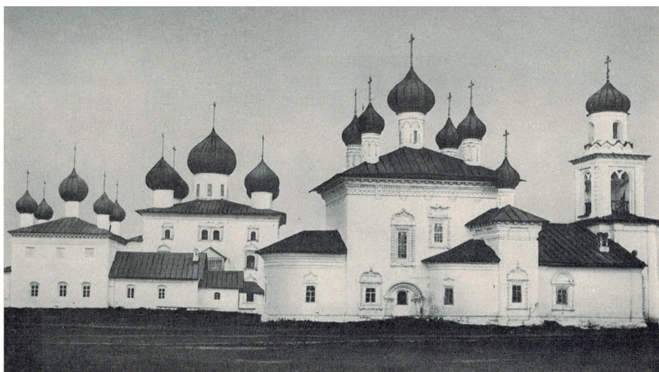
Храмы Старого торго: Никольский, Благовещенский, Рождества Богородицы. 1901 г.