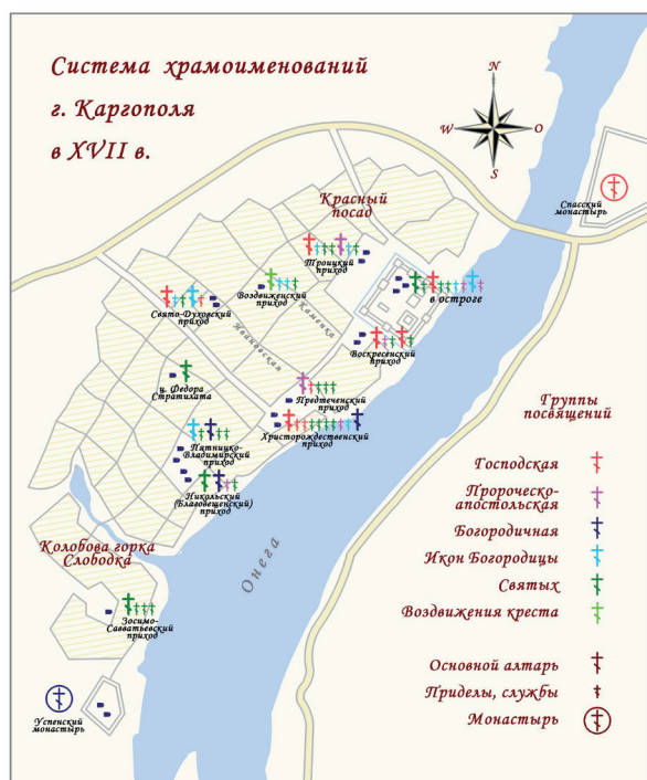
Система храмоименований г. Каргополя в XVII в.