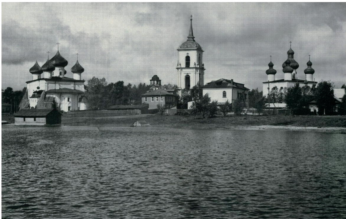
Вид на Каргополь с реки Онеги. Середина XX в.