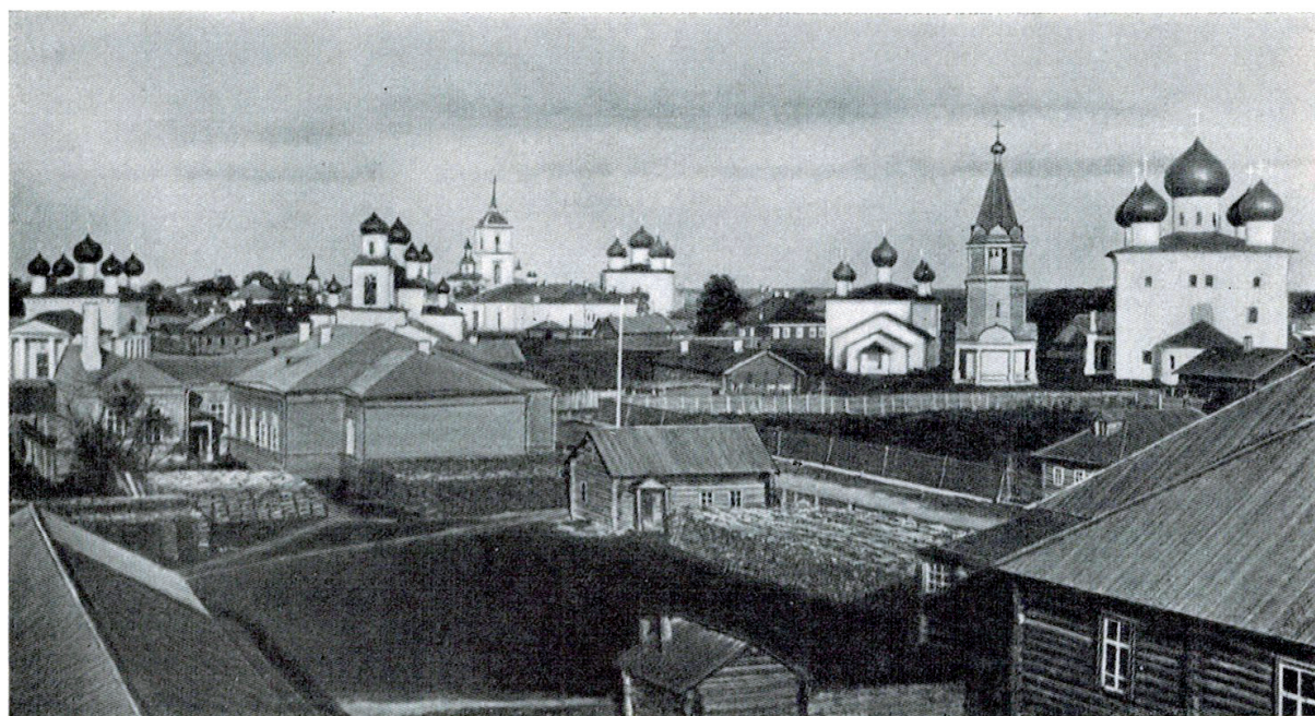
Каргополь начала XX века

В градостроительной истории Каргополя много неясного, что объясняется плохой сохранностью письменных источников и лишь эпизодическими и фрагментарными археологическими исследованиями. В конце XVIII в. согласно указу императрицы Екатерины II от 1763 г. улицы города были приведены к регулярному плану. В изложении Г. В. Алферовой, заселение территории города началось с