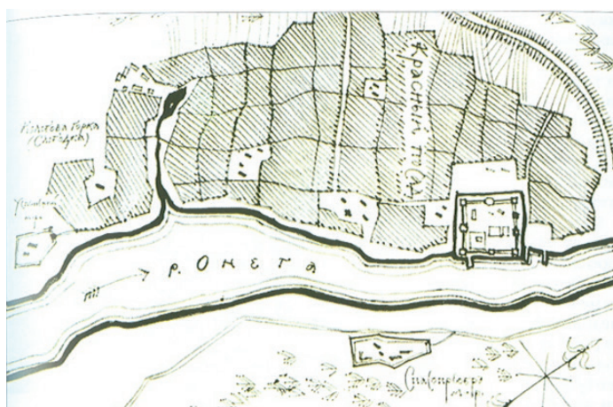
Каргополь в конце XVII – первой половине XVIII в. Схематический план. Реконструкция Ю. С. Ушакова