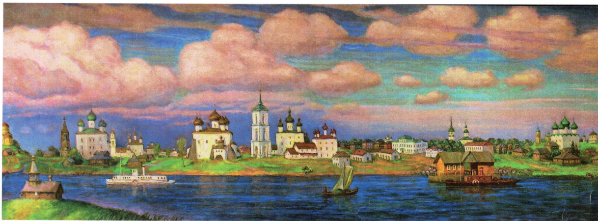
Каргополь. XVII век

Богородичные посвящения распространены больше, чем господские, и составляли несколько более 1/5 части. Все это обычно для посвящений северных храмов (Мелехова 1997: 127–129; Мелехова 2009: 131).