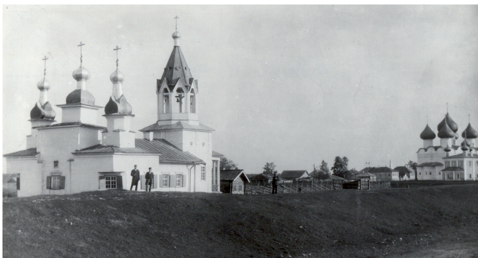
Валушки в конце XIX - начале XX в. На первом плане церковь Спаса Всемилоостивого.