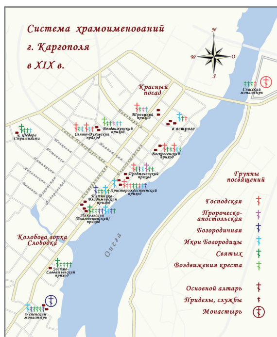
Система храмоименований г. Каргополя в XIX в.