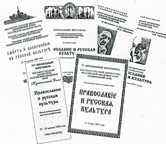
Программы конференций разных лет.

В специальном буклете, посвященном конференции, говорилось: «Органическая связь с православием была присуща русской культуре на протяжении многих веков. Животворящий свет Евангельской истины просвещал и освящал все пласты русской жизни. С началом Нового времени пути Церкви и культуры разошлись: интеллигенция под-