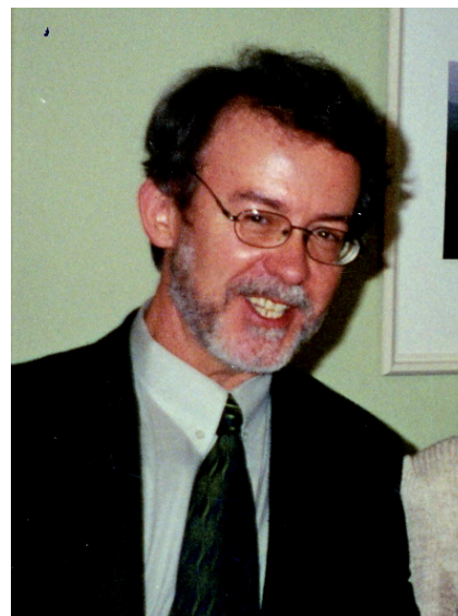
В. А. Котельников.