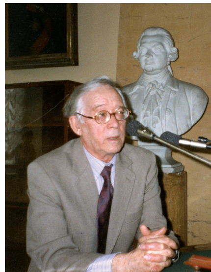
Ю. К. Герасимов. Фото из архива А. М. Любомудрова