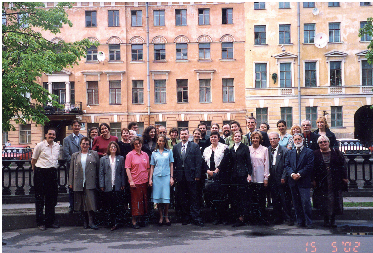
Участники конференции на экскурсии «Петербург Достоевского».

церкви и, с другой стороны, о роли отечественной словесности в историческом движении православия. Существенное внимание уделялось эстетике православной культуры, воплощению христианской идеи в словесной ткани произведения. В этих контекстах рассматривалось творчество Пушкина, Гоголя, Жуковского, Гончарова, Достоевского, Тютчева, А. К. Толстого, поэзия Константина Романова и Николая Гумилева, религиозно-философская мысль Ивана Киреевского, Константина Леонтьева, Константина Победоносцева, Сергея Нилуса, Ивана Ильина и многих других. Пристальное внимание уделялось наследию забытых и малоизученных духовных писателей Нового времени.