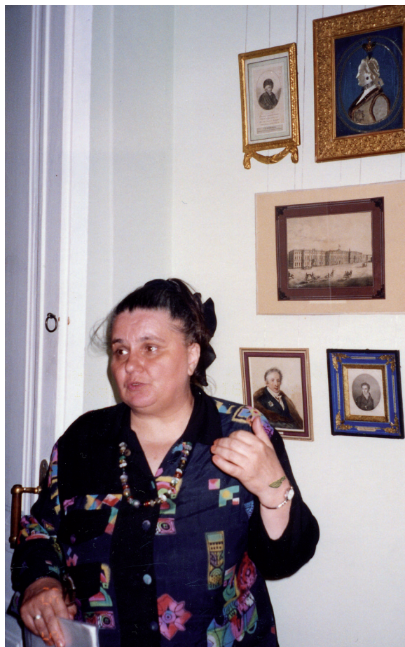
Е. Н. Монахова. Фото из архива А. М. Любомудрова