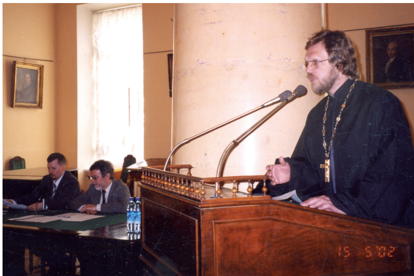
Прот. Кирилл Копейкин.