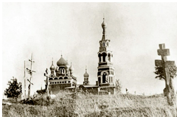
Храм Архангела Михаила в с. Красное.

ссылки был г. Архангельск, и там 21 ноября 1947 г., в день своего Ангела, он принял священство. В то время ему было 65 лет.