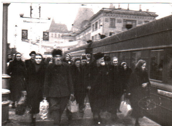
Ярославский вокзал, проводы о. Михаила в Сыктывкар. Священник – в первом ряду. 1961 г.

Приблизительно с 1963 г. о. Михаил начинает служить в храме Архангела Михаила в с. Кутепоно Жуковского р-на Калужской обл. Также восстанавливает этот храм. Его служение здесь продолжалось до кончины священника.