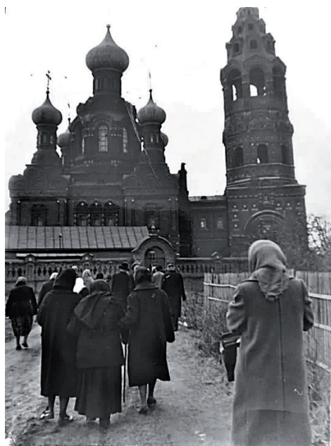
Похороны о. Михаила. Храм Покрова Божией Матери в п. Черкизово. 1967 г.

Батюшка прожил 85 лет. Скончался 26 апреля 1967 г. в Великую среду Великого поста. Был похоронен около храма Покрова Божией Матери в п. Черкизово Пушкинского р-на Московской обл. (ст. Тарасовская).