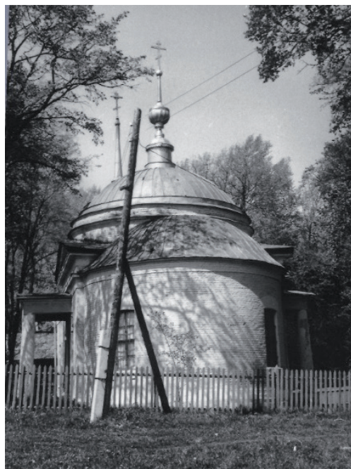
Храм Архангела Михаила в с. Кутепоно

неугоден был священник, который призывал к порядку.