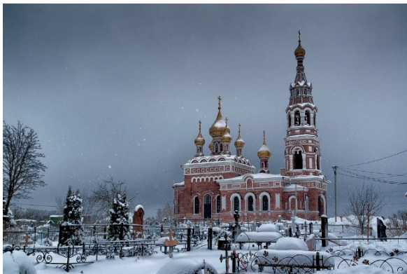
Современный вид храма Архангела Михаила в с. Красное.

Отцы храма «Всех святых, что на Соколе», прихожанкой которого я была в то время, пожертвовали для храма иконы, семисвечник, деньги на ремонт. Храм постепенно восстанавливали, к нему вернулось благолепие. В сентябре 1958 г. о. Михаил пишет: «Был владыка, в удивлении сказал: “Одно чудо Михаила Архангела в Хонех, второе – в Красном”». В письме от 22 августа 1959 г.: «Леса сняли. Красавец стоит!». Но тогда уполномоченные зорко следили за происходящим в церкви, не давали приходским священникам подолгу служить на одном месте, чтобы с прихожанами не устанавливались сердечные отношения, чтобы не росло число новых прихожан. И вот уже в сентябре 1959 г. о. Михаила переводят служить в храм Покрова Пресвятой Богородицы в с. Карижа Малоярославецкого р-на Калужской обл. А храм Архангела Михаила, куда был назначен новый настоятель, в мае 1960 г. закрыли под предлогом малой его посещаемости и, как следствия – малоодоходности прихода. Закрытый храм был разорен духовно опустошенным местным населением и дачниками. Вновь был возвращен Русской Православной Церкви в 1994 г. Началось его медленное восстановление (Село Красное).