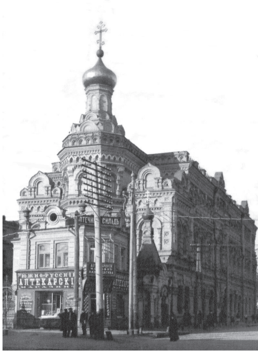
Здание Киевского религиозно-просветительского общества (фото начала XX в.)