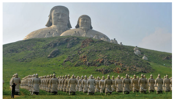
Каменная композиция «Вожди и воины монгольского войска». КНР