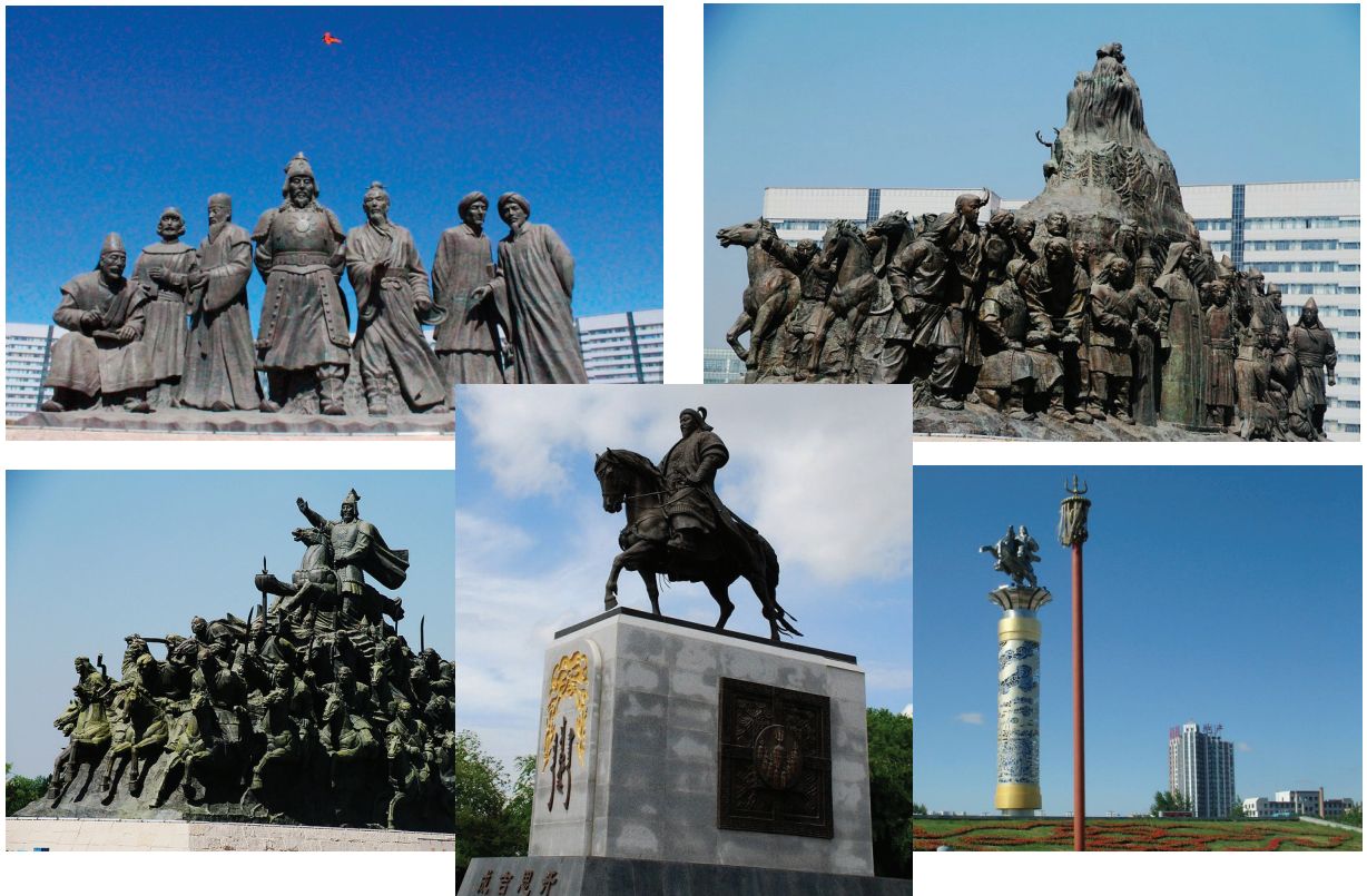
Композиция «Монгольское войско во главе с Чингисханом». г. Хайлар во Внутренней Монголии (КНР). Главная площадь города носит имя Чингисхана