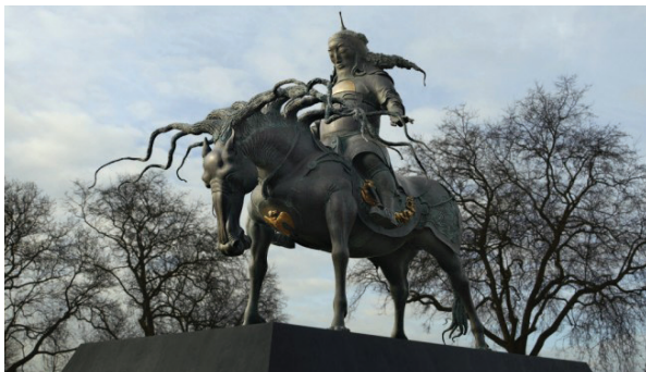
Чингисхан. Лондон. Скульптор Даши Намдаков. 2012 г.