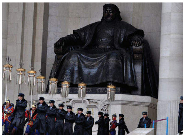
Памятник Чингисхану в г. Улан-Баторе, Монголия