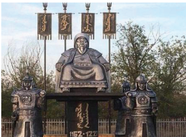
Памятник Чингисхану. Поселок Привольное, Калмыкия, Россия