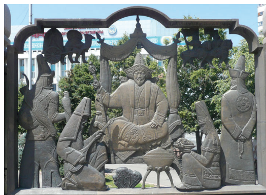
Монумент Независимости на площади Республики в Алматы, Казахстан. Открыт в 1996 г. Символическая композиция, в центре которой Чингисхан, а вокруг образы казахов как оплота великой Монгольской империи.