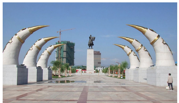
Памятник Чингисхану. г. Хух-Хото. КНР