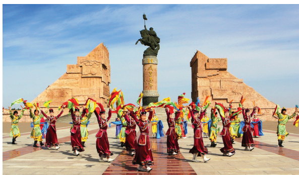
Памятник Чингисхану. г. Ордос. КНР