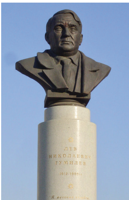
Памятник Л. Н. Гумилеву в Казани, Россия