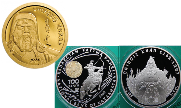
Казахские коллекционные монеты из золота и серебра