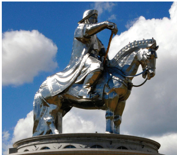
Мемориальный комплекс «Чингисхан на коне». г. Цонжин Болдоге, Монголия