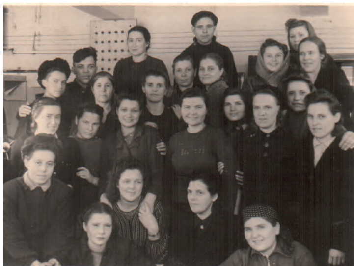
Во втором ряду третья справа – моя мама

понимала, что здесь что-то другое, ведь Он неоднократно подтверждал мне, что слышит мои молитвы.