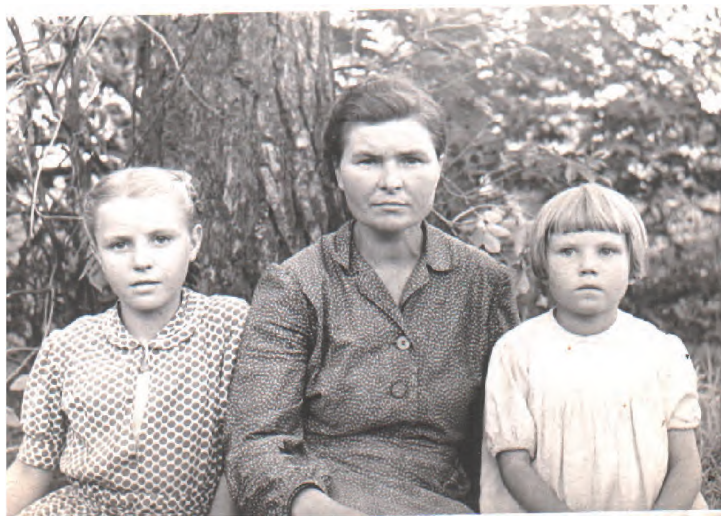
1951 год. Маме 38 лет, мне 12 и сестре 8 лет.

ской жизни, о Христе, [2] она тотчас же засыпала да еще и начинала храпеть, оказываясь в положении как бы вовсе утратившей способ-