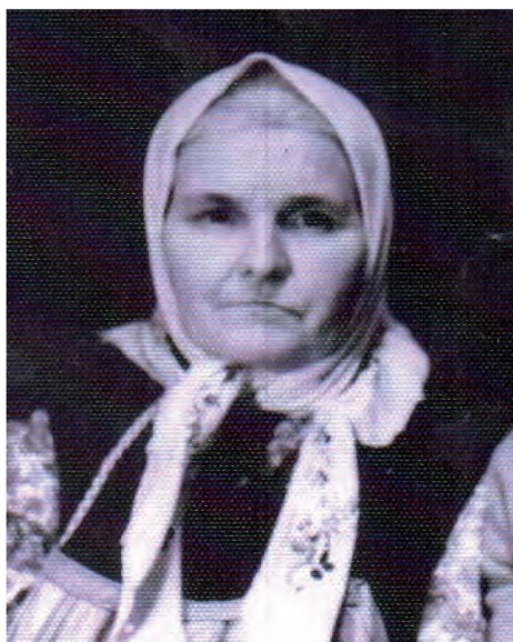
1956-й год. Маме 43 года