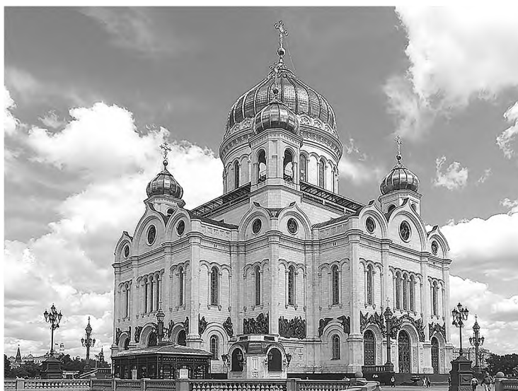
Храм Христа Спасителя в Москве

Имя святителя Филарета самым непосредственным образом связано с возведением в Москве Храма Христа Спасителя. Это еще один пример того, как он умел спасти святое начинание от встающих на его пути казалось бы непреодолимых препятствий. Первый проект храма, задуманного императором Александром I как памятник победы над Наполеоном в 1812 г., был исполнен неправославным архитектором-мистиком Витбергом. Проект был закрыт. Святитель Филарет вошел в