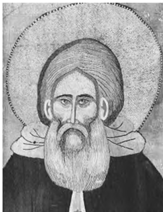
Прп. Сергий Радонежский. Лик с плащаницы XIV в.

Будучи покровителем ученого монашества, митрополит Филарет, в то же время, оказал поддержку становлению такого важнейшего для духовной жизни России, как XIX-го, так и XX-го веков явления как «старчество». Корни его уходят на Святую Гору Афон, откуда традиция духовного попечения, названная потом старчеством, была вывезена и передана на Русь прп. Паисием Величковским и его учениками в конце XVIII века. Пер-