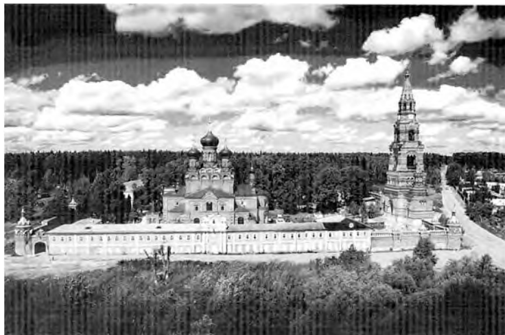
Гефсиманский скит Троице-Сергиевой лавры

Более того, этот «вития», «московский Златоуст», блестящий проповедник, оратор, мастер слова, – в монашеских кругах имел славу «великого молчальника», и знаменитый тогда архимандрит Фотий (Спаский), бывший ученик святителя Филарета по духовным школам, призывал учиться искусству и подвигу молчания – у митрополита Филарета. Когда наместник лавры архимандрит Антоний как-то в письме упрекнул его за долгое молчание, он ответил: «Будем доверять и молчанию друг друга, как доверяем слову» 51 . Это молчание было связано с подвигом внутреннего духовного умного дела-