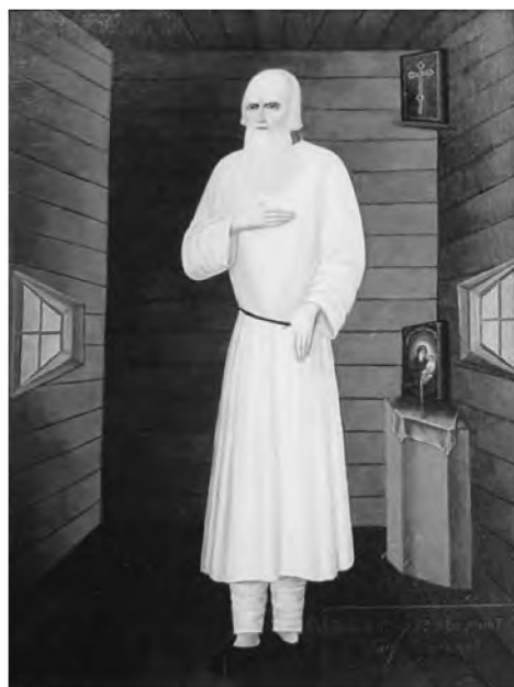
Святой праведный Феодор Томский

ющихся нравственных и евангельских догматов. «Московский златоуст», он в то же время предстает чуть ли не «молчальником», умеющим хранить нерушимой внутреннюю тишину и тем самым передающим понятие о ней другим. Находящийся в