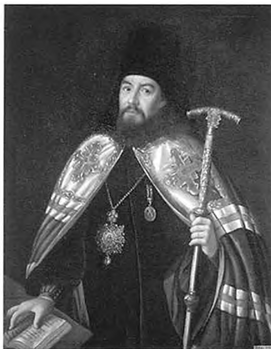
Митрополит Гавриил (Петров).