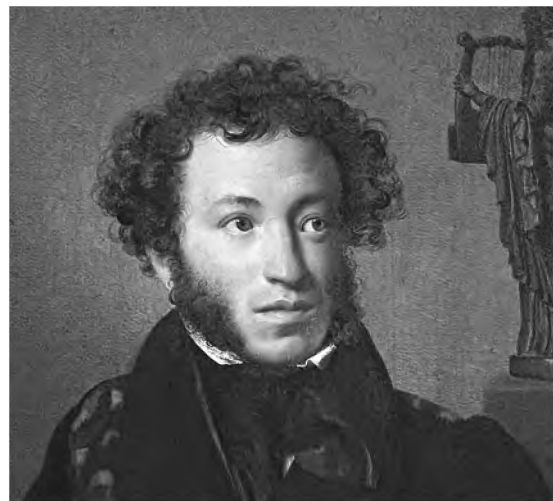
А.С. Пушкин Портрет О. Кипренского. Фрагмент

Следует отметить необычайную поэтичность языка и самого мировосприятия свт. Филарета. Век позитивизма, век господства прозы и так назы-