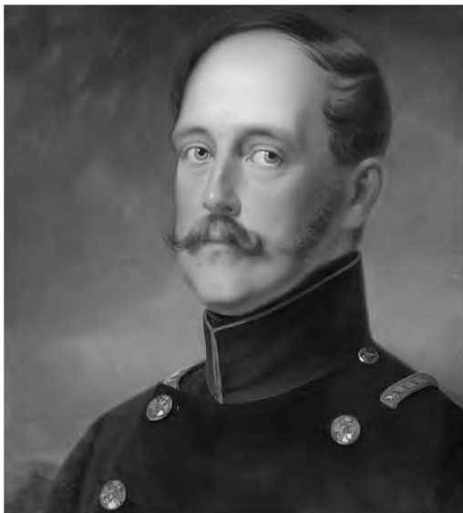
Император Николай I

изображения языческих божеств 20 . Замечательна сама форма, в которой отказ был произведен – минимальными средствами, без каких-либо признаков бунта и деклараций: приехавший от императора адъютант доложил митрополиту о желании Его Величества, чтобы святитель возглавил торжества со стороны Церкви. Святитель молчал. Адъютант доложил повторно, святитель сказал: «Слышу». Адъютант спросил: «Что прикажете доложить Его Величеству?». Митрополит ответил: «А что слышите». Посланный вернулся к императору и сказал, что он не понял ответа святителя, дословно передав состоявшийся диалог, на что император Николай I ответил: «А, ну так я понимаю» – и уехал, также не приняв участие в церемонии. Император понял, что владыка митрополит озвучил для него голос своей совести. Совесть, по христианскому учению, есть голос Божий в человеке; голосом совести в государстве является голос Церкви; император услышал этот голос и покорился ему.