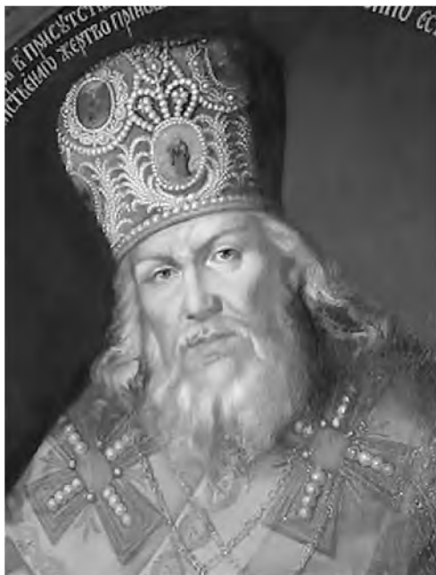
Митрополит Платон (Левшин)

дело с чрезвычайной богодарованной силой, с которой не может сравниться никакая естественная, человеческая сила. Мы имеем дело со святостью, пред которой меркнет обыкновенная благочестивая, собранная в себе жизнь православного первоиерарха. /.../ Пред этой личностью можно только преклоняться; [...] от нее можно только поучаться и /.../ ее светом необходимо освещать все времена прошедшие, настоящие и грядущие, так как благодать остается всегда благодатью, истина – всегда истиной» 5 . «Высокопарный орел в богословских созерцаниях, паривший высоко над умами умнейших своих современников», «ангел церкви...Всероссийской», «духовный вожь Русской земли» 6 . «Он освещал путь в свое время. Он же силен освещать путь и дальнейших времен» 7 .