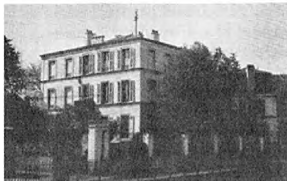
Аньер. Дом, в котором находится храм Христа Спасителя, где настоятельстввал влд. Мефодий,

фов М.Н. Граббе и А.П. Беннигсена. Первым настоятелем его был иеромонах, впоследствии Владыка, Иоанн (князь Шаховской), предложивший назвать приходской храм во имя Христа Спасителя, как отклик на совершавшееся тогда в Москве разрушение храма Христа Спасителя. «То был храм русской славы, — писал позднее о. Мефодий, — [...] наш храм — храм скорби, искания утешения и покаяния» 34 .