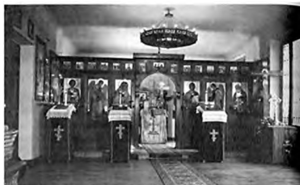
и интерьер храма.