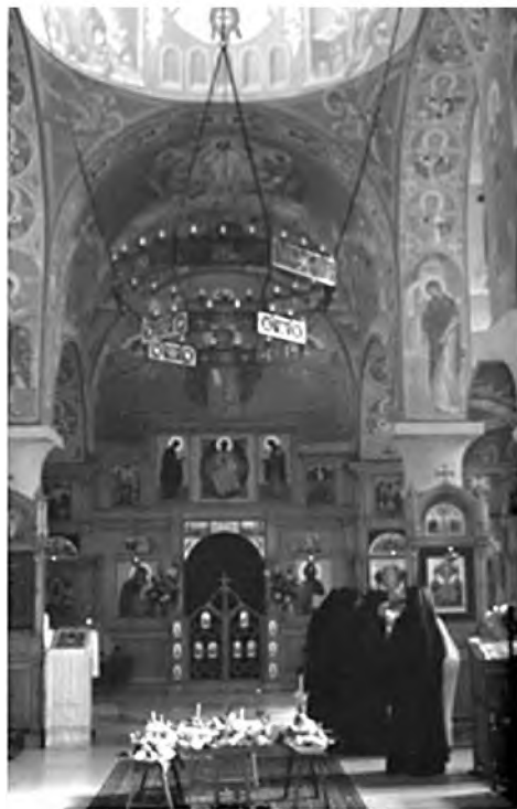
Богослужение в новом храме обители. Росписи художника Ярослава Добрынина

Однако, игуменье Ольгедействительно суждено было построить реальный собор. Старая монастырская церковь перестала вмещать молящихся, среди которых появились многочисленные паломники со всех стран света. И игуменья Ольга решила взять благословение правящего архиерея архиепископа Команского Гавриила (де Вильдер), на казалось бы невозможное дело – строительство нового большого храма, для чего не было никаких наличных средств. На освящении храма в 2003 г. Владыка Гавриил так описал свою первую реакцию на просьбу о благословении: «Это невозможно. Какой энтузиазм, но ой, ой! – у них ничего не получится! [...] Однако сейчас я должен с укором сказать себе: невозможный проект стал реальностью» 66 .