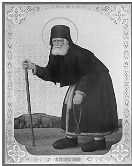
Преподобный Серафим Саровский

говорит прп. Серафим, «стяжать Духа Святаго», по мере Вашего стяжания и будет Вам всё разъясняться: «чистые сердцем Бога узрят»» 40 .