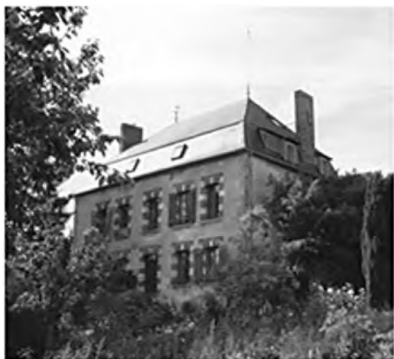
Монастырский дом в Покровской обители в Бюсси