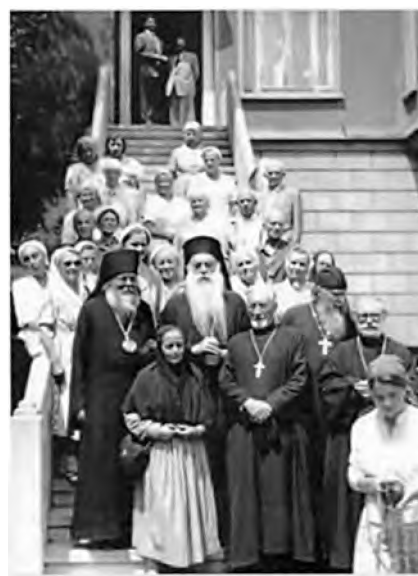
Русские паломники с Константинопольским Патриархом Афинагором 1959 г.

полит Илия (Салиби). После тяжелого переезда через горные хребты под палящим солнцем в Дамаск паломники были утешены сердечным приемом Антиохийского Православного Патриарха: «В Дамаск мы прибыли поздно вечером, — вспоминает игуменья Ольга, — но всё же нас принял Патриарх Антиохийский Александр III, который отнёсся к нам с удивительным участием и сердечностью. Приветствуя нас на русском языке, он сказал о своей любви к бывшей России и радости, что опять видит русских паломников, которые, несмотря на долгое изгнание, не потеряли свою православную веру и устремились туда, куда прежде устремлялись многие русские странники. После многолетнего перерыва мы оказались первыми» 49 . После посещения основанного Императором Юстинианом Санданайского монастыря, переезда через Иорданскую пустыню, перехода пешком по мосту через «священную реку» Иордан с пением Крещенского тропаря и молитвой «Покаяния отверзи мне двери», паломники прибыли в Иерусалим, где были встречены колокольным звоном Вифанской русской школы. «На другой день мы пошли к Святейшему Патриарху Тимофею, который еще помнил русских до революции. Он заплакал, когда нас увидел и ему сказали, что мы русские. В конце встречи Святейший благословил каждого паломника и попросил: «Спойте мне, пожалуйста, по-русски «Душе моя, душе моя, что спиши?»» 50 .