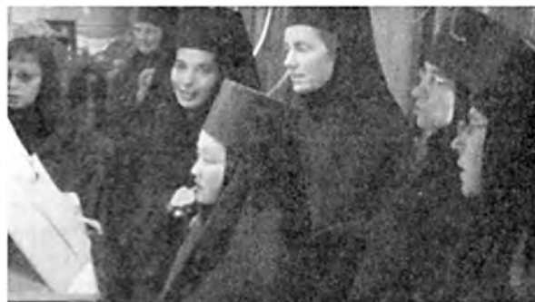
Молодое поколение Покровской обители в Бюсси на клиросе.

нас были японки» 61 . Это сочетание «русскости» и вместе «всемирности» есть особенность духовной атмосферы монастыря в Бюсси.