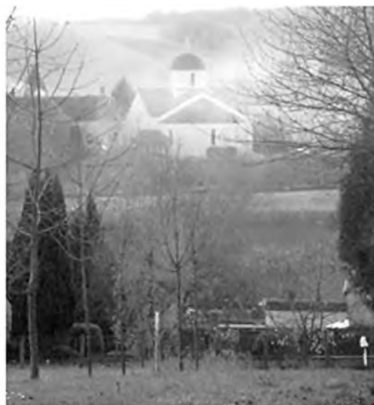
Новый храм Преображения Господня в Бюсси. Освящен 14 октября 2003 г.