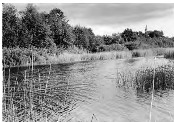
Вид на Красносельский храм и реку Сить. По преданиям местных жителей с горы, на которой стоит храм, во время битвы 1238 года текли реки крови к тому месту, где сейчас находится деревянный мост через Сить, соединяющий Красное и ту сторону, на которой деревня Юрьевское. Фото. 1960-е годы

Что нам говорят исторические источники об этом сражении? Текст жития святого мученика князя Георгия Всеволодовича: «Князь же Юрий посла Дорожа в 3-х тысяч муж... послал “пытати