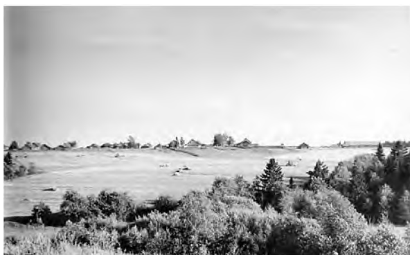
Вид на поле – место битвы – и деревню Юрьевское со стороны села Красное. Часовня стояла немного левее от этого пейзажа, и в снимок не вошла.