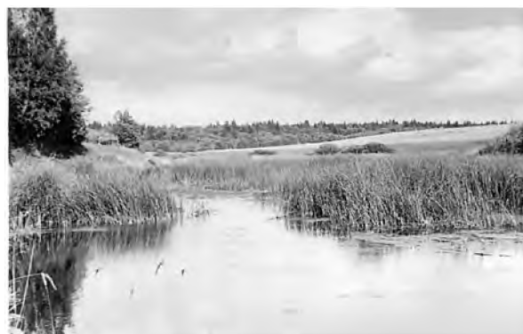
В центре фото находится «Красная гора», где, по преданию, погиб великий князь Владимирский Юрий Всеволодович