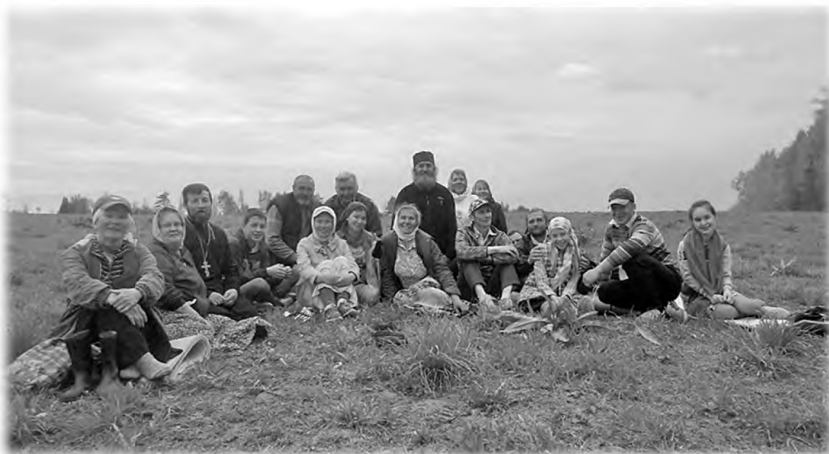
Отдых крестоходцев крестного хода «В честь собора всех святых в земле Пермской просиявших», 2017 г.