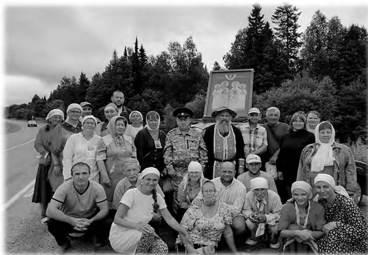
Отдых крестоходцев крестного хода «В честь собора всех святых в земле Пермской просиявших», 2018 г.