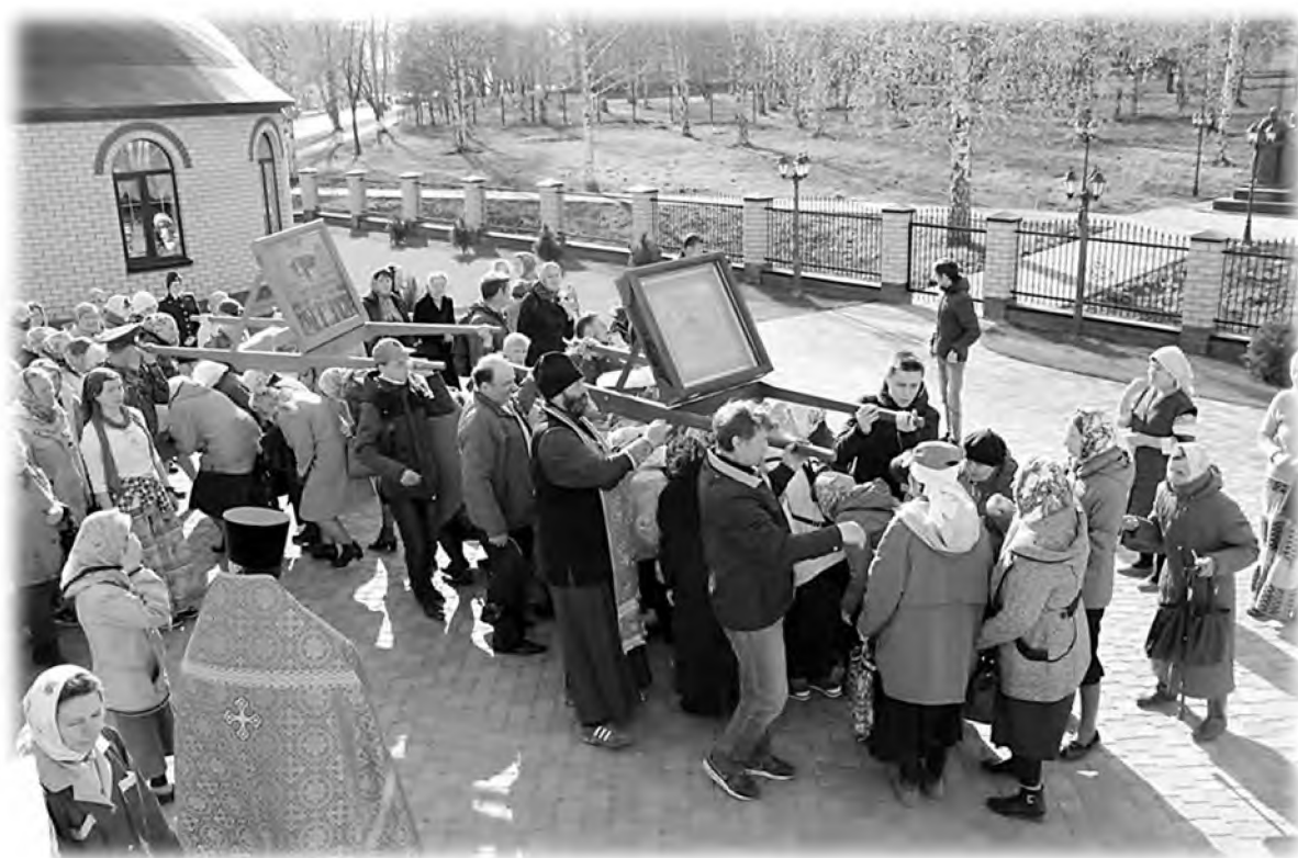
Обряд прохождения верующих под иконами, накануне ухода крестного хода из г. Чернушка. 2017 г.