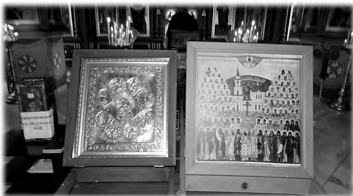
Святыни Крестного хода «В честь собора всех святых в земле Пермской просиявших» в 2016 г.