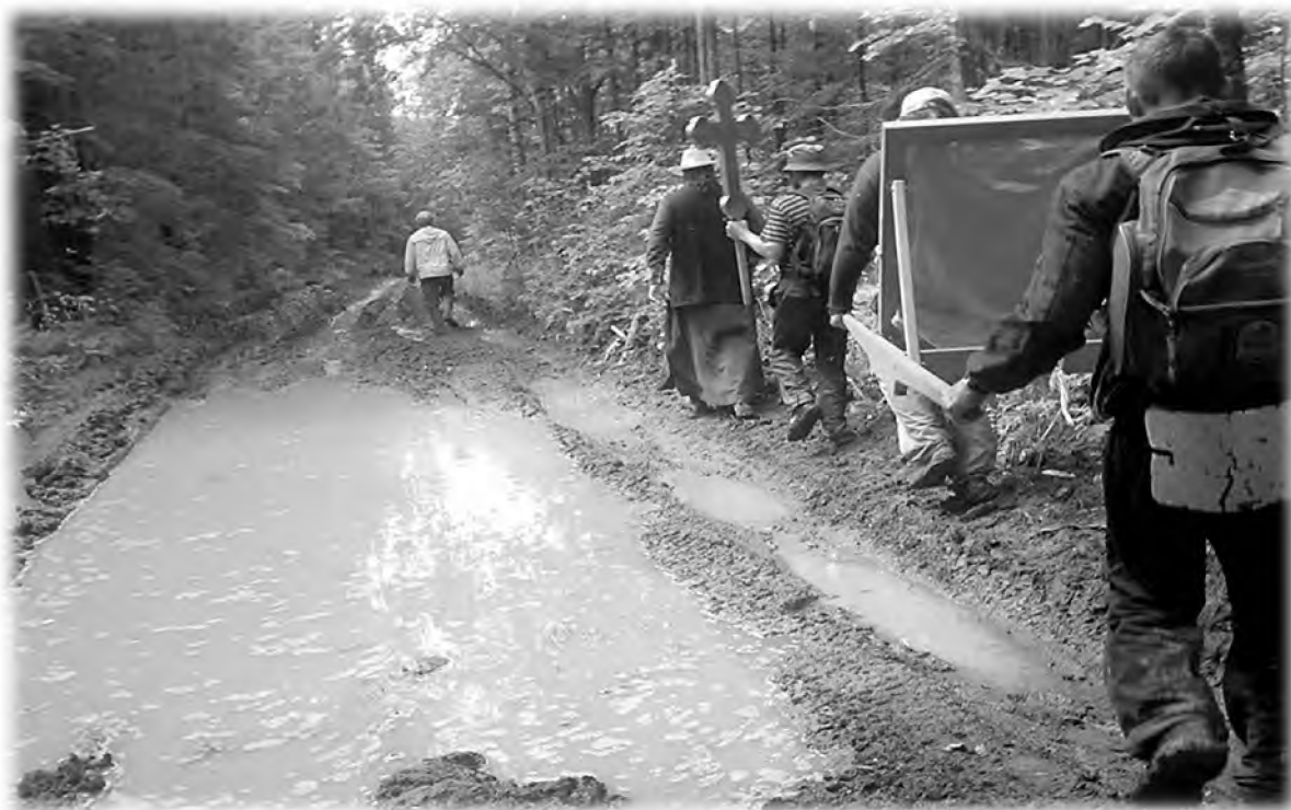
Трудный участок крестного хода «В честь собора всех святых в земле Пермской просиявших». 2016 г.