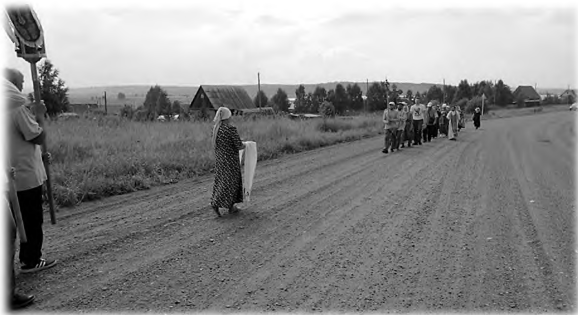
Встреча крестоходцев из крестного хода «В честь собора всех святых в земле Пермской просиявших». 2018 г.