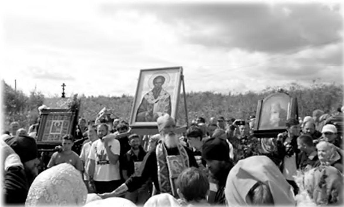
Святыни «Свято-Серафимовского крестного хода на Белую гору», 2016 г.