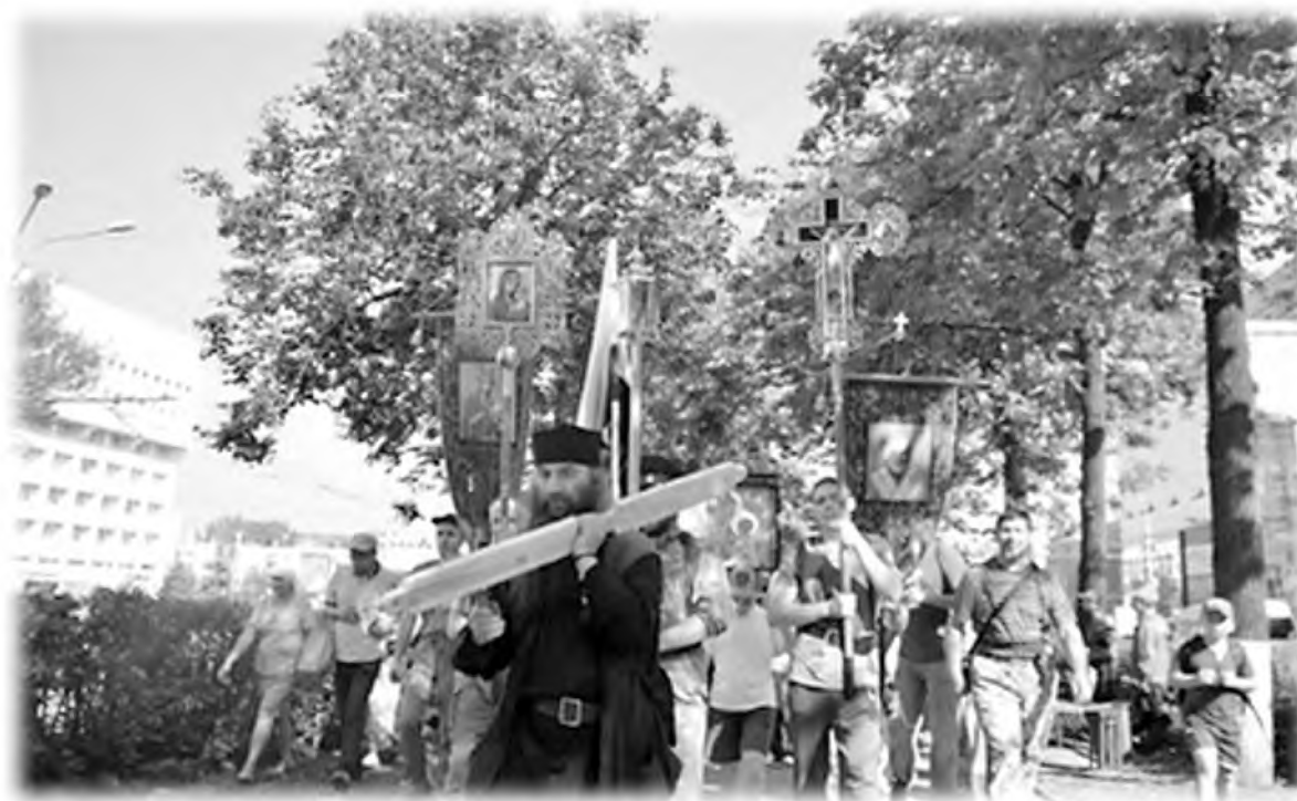
«Свято-Серафимовский крестный ход на Белую гору», 2016 г.