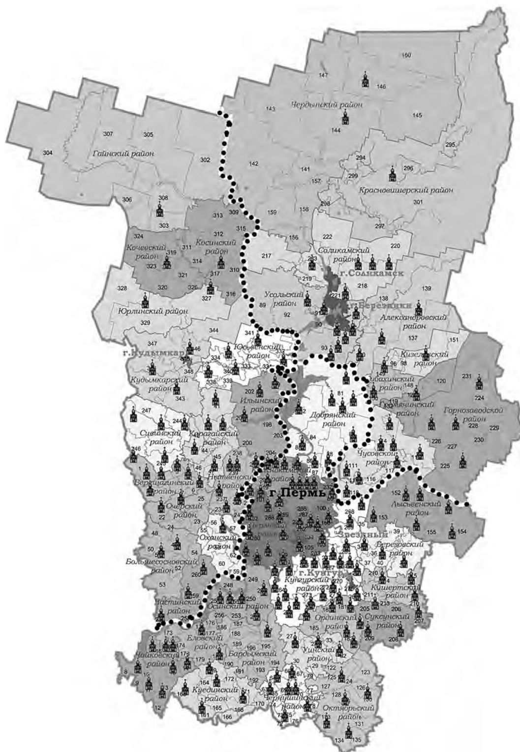
Карта Пермской митрополии http://www.pravperm.ru/home/mitropoliya2 (дата обращения: 21.11.2017).