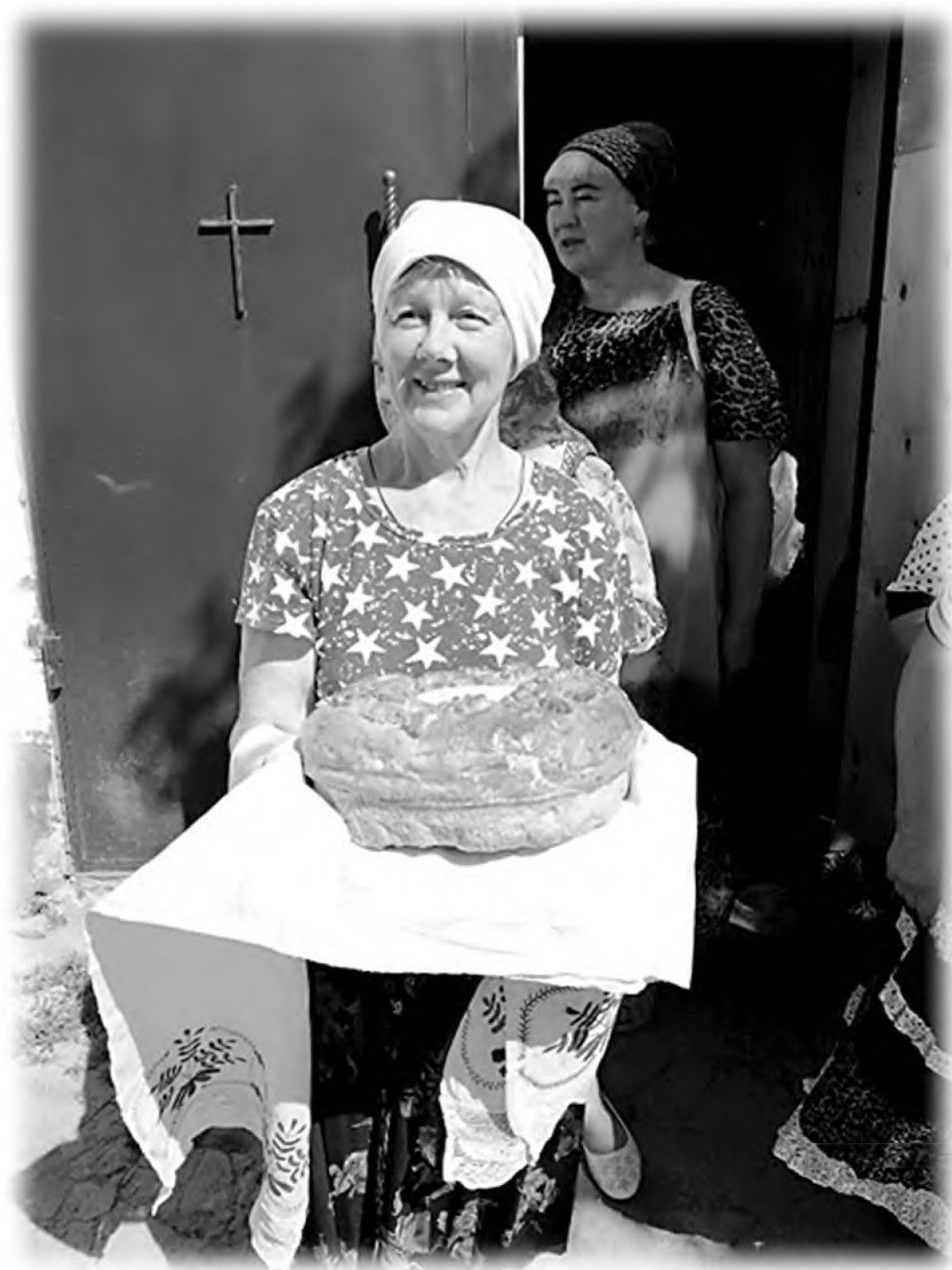
Встреча крестоходцев крестного хода «В честь собора всех святых в земле Пермской просиявших». 2018 г.