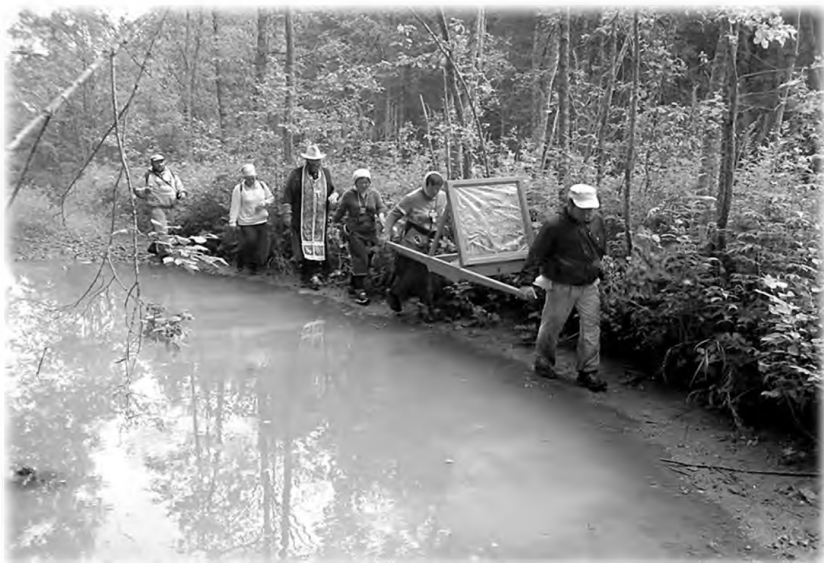
Трудный участок крестного хода «В честь собора всех святых в земле Пермской просиявших». 2016 г.