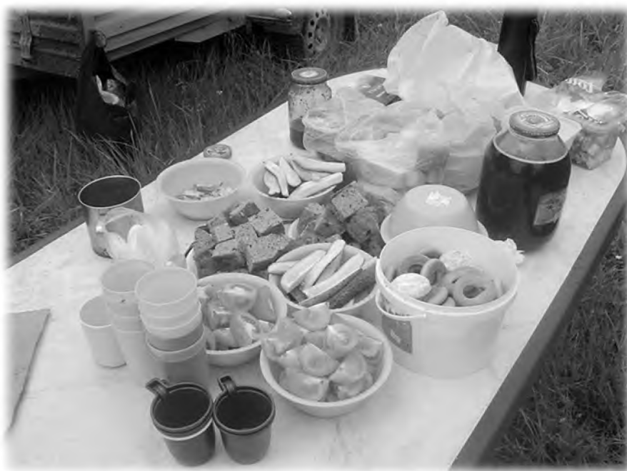
Трапеза для участников крестного хода «В честь собора всех святых в земле Пермской просиявших». 2016 г.