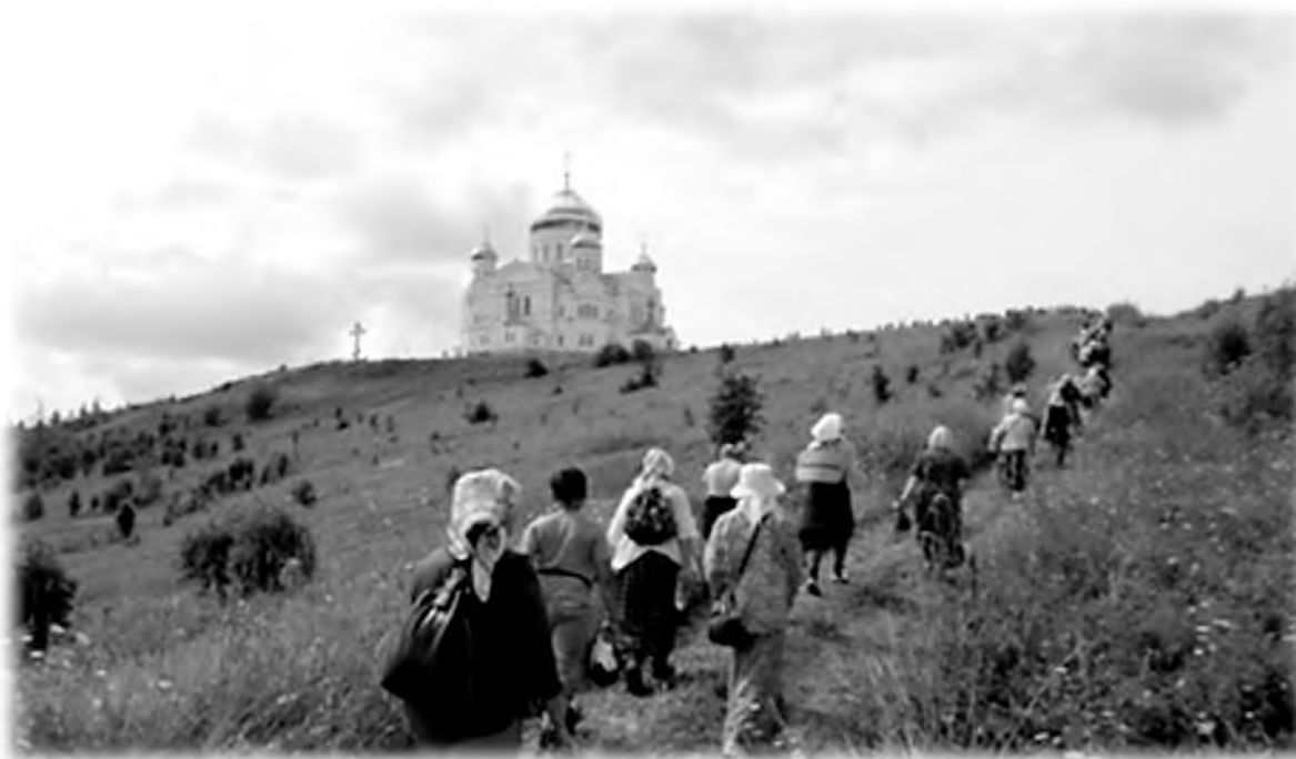
Подъем крестоходцев «Свято-Серафимовского крестного хода» на Белую гору, 2016 г.