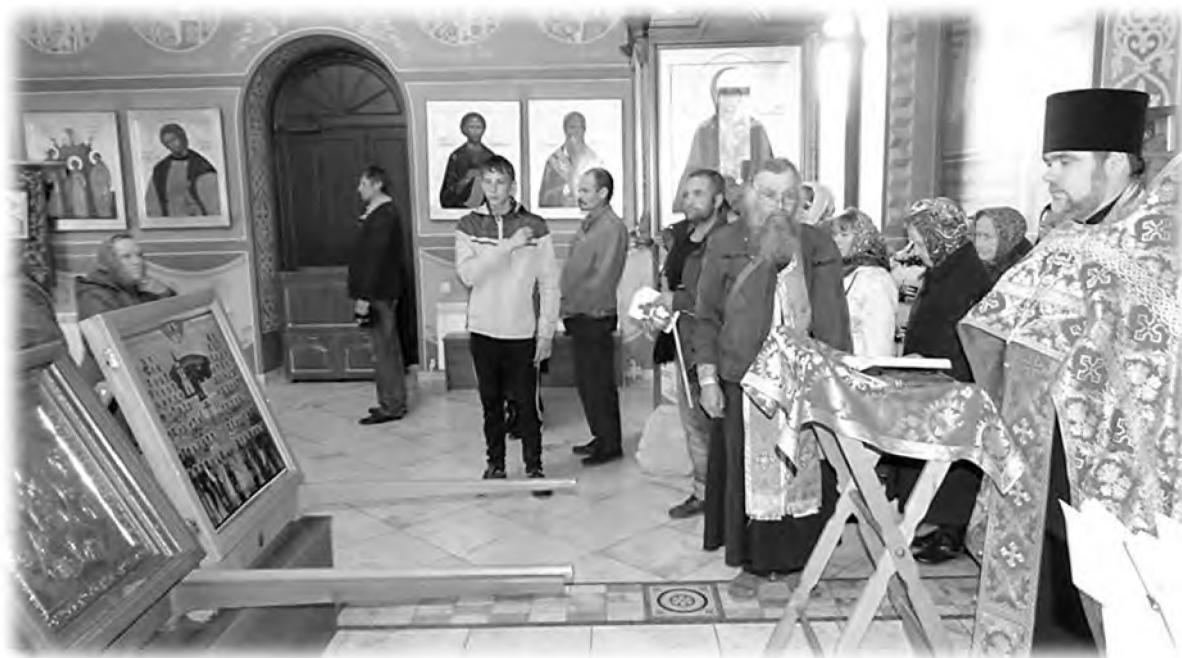
Молебен перед святынями после встречи крестного хода в г. Чернушка. 2017 г.