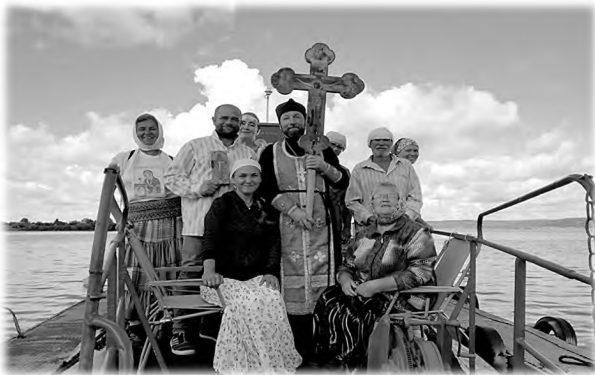
Остановка крестоходцев крестного хода «В честь собора всех святых в земле Пермской просиявших», 2018 г.