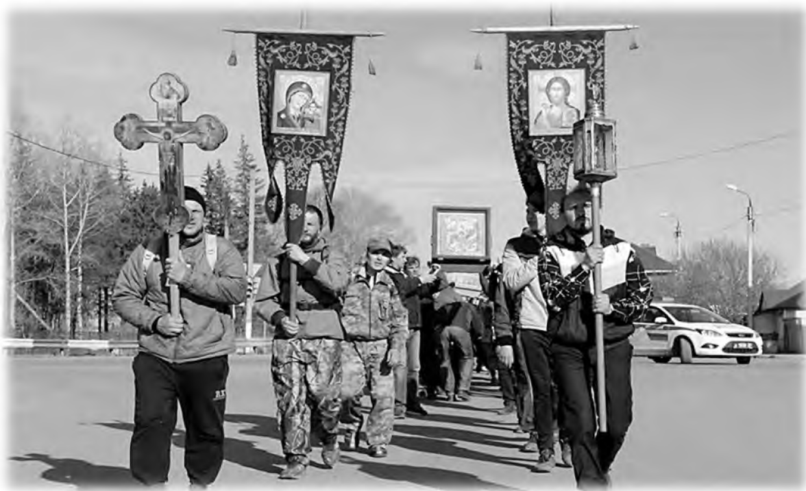
Колона крестного хода «В честь собора всех святых в земле Пермской просиявших». 2017 г.