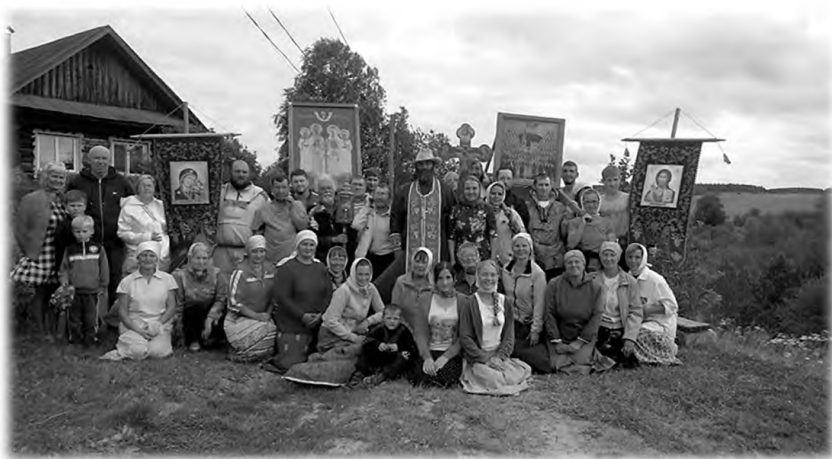
Крестный ход «В честь собора всех святых в земле Пермской просиявших» в 2016 г.