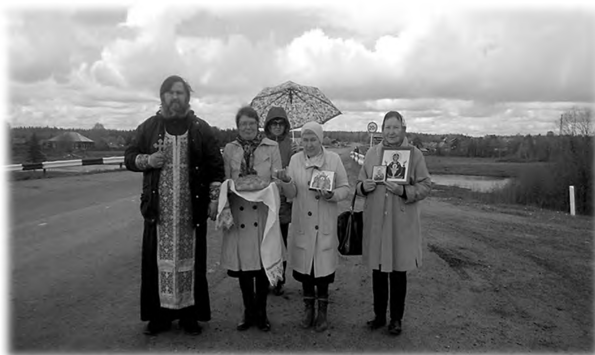
Встреча крестоходцев «В честь собора всех святых в земле Пермской просиявших». из г. Кудымкара 2017 г.