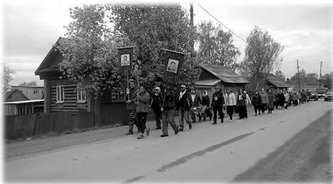
Пример антифонной (по очереди) молитвы крестного хода «В честь собора всех святых в земле Пермской просиявших». 2017 г.