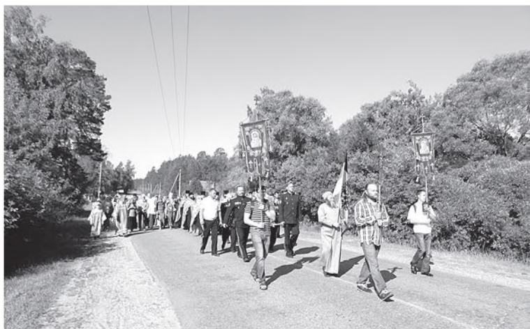
Крестный ход в память великого князя Михаила Александровича 12 июня 2015 г. из Площанской пустыни в Брасово.

сечь Православие в России и уничтожить царский род привела к возникновению сонма святых новомучеников Всероссийских XX в.. Собор святых новомучеников и исповедников Российских стал по общественному мнению, сложившемуся у верующих сначала в Русской Зарубежной Церкви, а потом и в Русской Православной Церкви, духовным приемником Православной империи. Если представить собор новомучеников и исповедников Российских как небесное шествие святых Российской империи к Царю Небесному, то возглавлять его должны святые царь, царская семья, представители царского рода вместе с патриархом Тихоном и святыми митрополитами. Земным отображением такого представления становится каждый ход в честь новомучеников и исповедников, молитвенников за возрождение православной России.