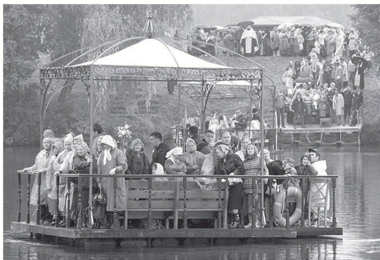
Дождь не помеха народной переправе. 2014 г.

В связи с приближением празднования 300-летия правления династии Романовых была предпринята попытка оформить сложившееся местное почитание в Пермском крае одного из первых Романовых боярина Михаила Никитича в канонизацию. Дядя будущего царя Михаила Федоровича в 1601 г. послан царем Борисом Годуновым в Ныроб на севере от Перми. Для обвиненного в заговоре Михаила было назначено жестокое содержание на дне глубокой ямы, однако смиренный сиделец пользовался большим уважением местного населения, которое его подкармливало. В результате Михаил