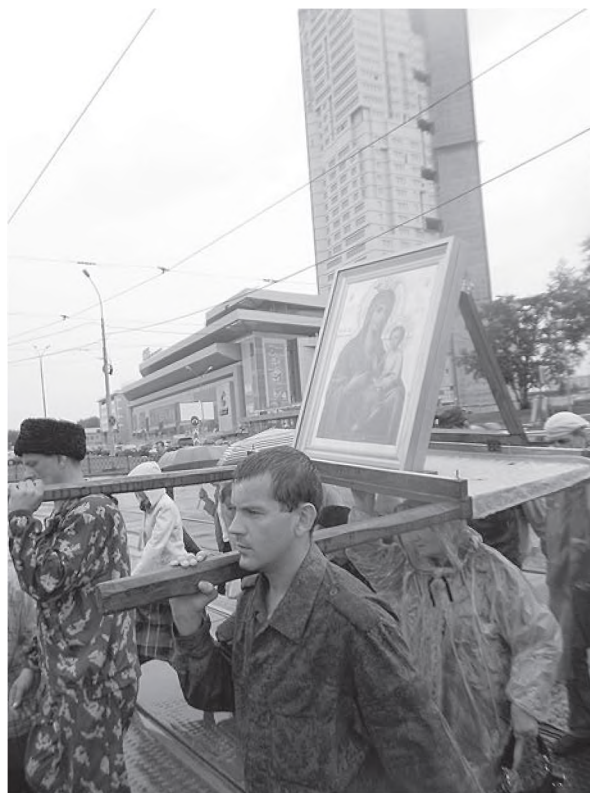
Ради пребывания под покровом иконы Богородицы бабушка шествует под носилками от станции Шарташ до Храма на Крови. 2015 г.

В Самаре с 2005 г. крестный ход объединяет два храма, посвященных святой царской семье с Иверским монастырем. С 2011 г. ход отправляется от Казанской церкви Оптиной пустыни в г. Козельск. Крестные ходы совершают в Крыму из Крестовоздвиженской домово́й церкви вокруг Ливадийского дворца, в Сыктывкарской епархии вокруг Ухты и в пос. Водный, в Нижегородской епархии в Арзамасе, в Амурской области в г. Алексеевске, в Подмоскowie в Клину из