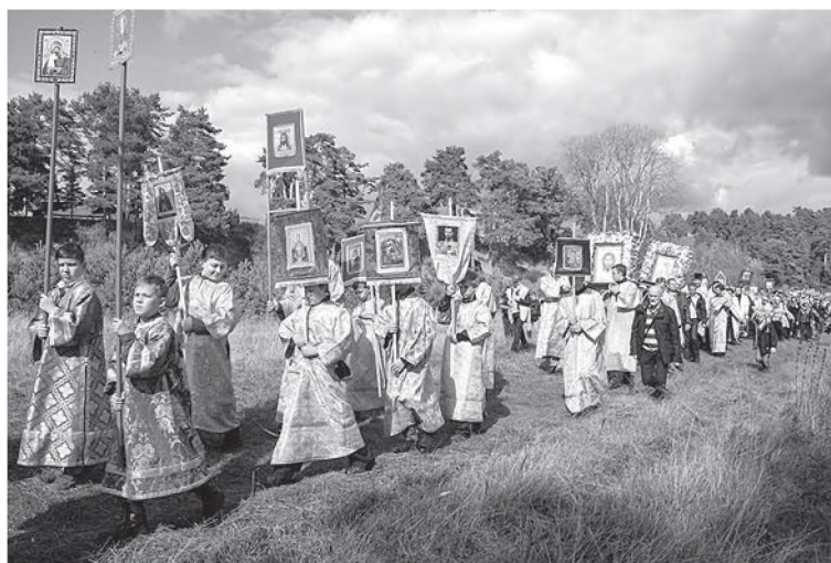
За детскими хоругвями в Елисаветинском ходе несут иконы. 2015 г.

За небольшим исключением современные крестные ходы, посвященные святым Романовым, организованы в честь Романовых-новомучеников.