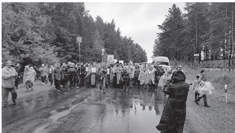
Алапаевский ход у монастыря новомучеников. 2015 г.

водою свечами и кадилами, при колокольном звоне, и, когда благоволил приложиться ко св. кресту и принять окропление священной водою, приветствован был настоятелем самою краткою речью, потом изволил шествовать в соборную церковь, по входе же в оную и по прочтении обычной эктении, провозглашено было его величеству и всей августейшей фамилии многолетие» 3 .