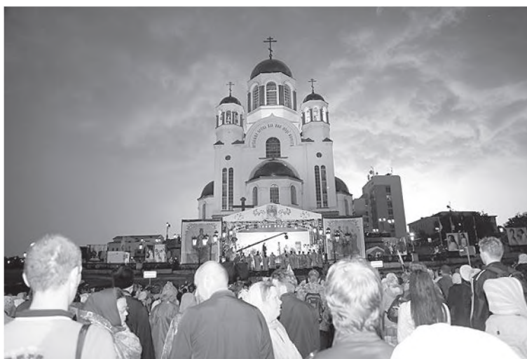
Литургия перед крестным ходом. 2014 г.

В ближайшее воскресенье к 18 сентября, дню именин Елисаветы Феодоровны, в Подмоскovie отправляются в крестный ход от церкви пророка Ильи в Ильинском к храму Спаса Нерукотворного Образа с. Спасское. С 2012 г. Елисаветинский