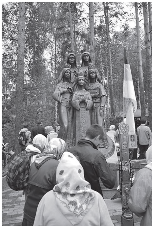
У памятника царским детям в монастыре на Ганиной Яме. 2013 г.

Народной любовью к Романовым этот ход перекликается с ходом 28 февраля 1919 г. из с. Большой Азясь Краснослободского уезда Пензенской губернии в Кимляйский Александро-Невский женский монастырь на Флегонтовой горе. Ход был организован монахинями и благословлен тем же святителем Макарием Невским.