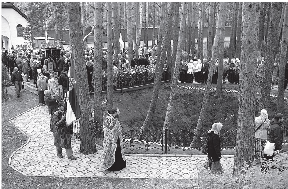
Ход пришел на Алапаевскую Голгофу. 2014 г.

и всяческое содействие народным умельцам. Одновременно с выставкой состоялся Первый съезд деятелей кустарных производств 24 .