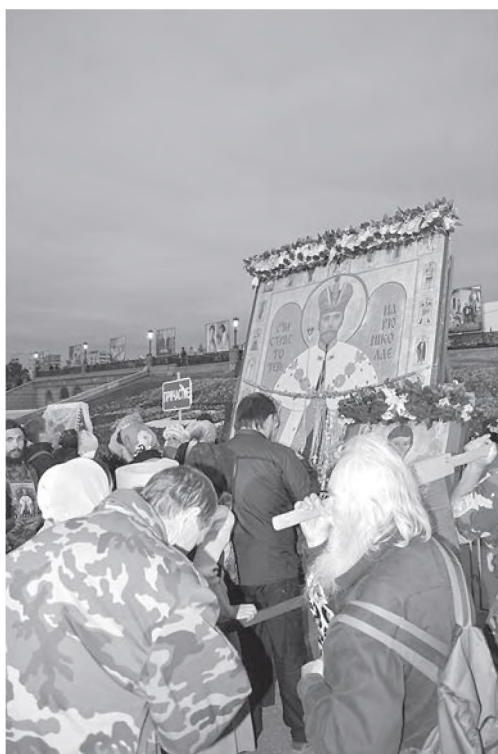
Построение икон на площади перед ходом на Ганину Яму. 2013 г.

С 2006 г. в истории крестных ходов в честь Романовых открылась новая страница. Ходы начали проводить в городах России, в которых побывали царь Николай II и царская семья по местам