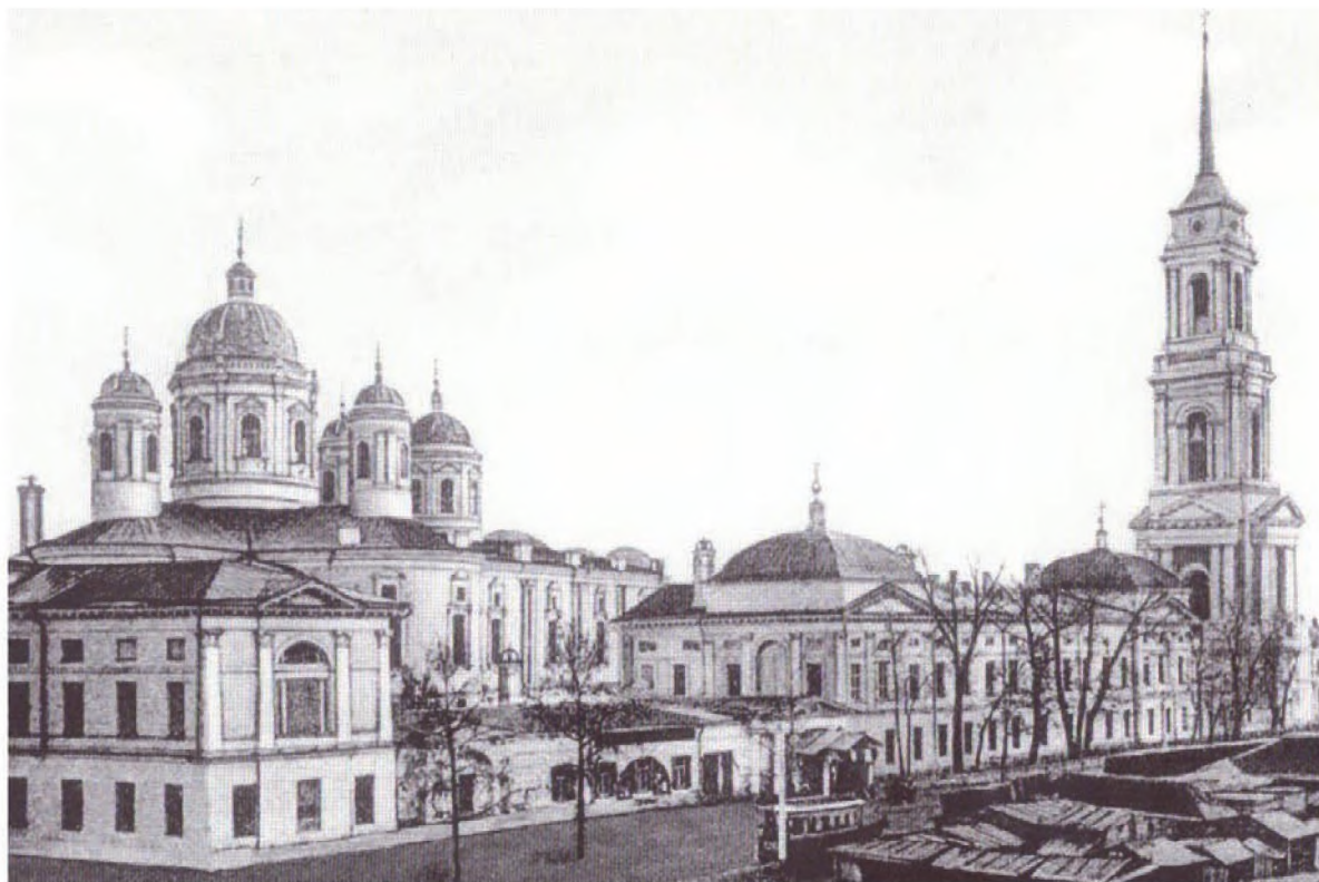
Митрофаньевский монастырь г. Воронеж

живее других колоколен пароход, стремящийся к небесам. Вокруг этого монастыря были громадные здания двух- и трехэтажные, которые образовывали собой ограду монастыря. В этих зданиях жила монашествующая братия. В числе этих братьев был некто иеромонах о. Нектарий. Он по переводу на мирской чин равнялся сану священника. Это был человек в высшей степени боголюбивый и