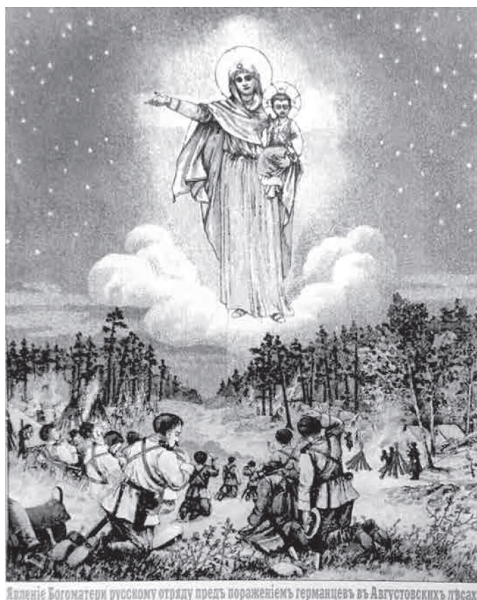
Литографированное изображение «Явления Богородицы русскому отряду пред поражением германцев в Августовских лесах» периода начала Первой мировой войны (типологическая Е.И. Фесенко в Одессе)

Впрочем, в Интернете весьма распространена и еще одна из молитв пред иконою «Августовская победа»: