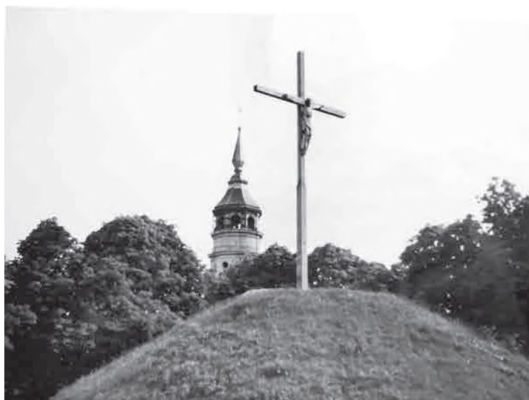
Современный вид вершины Даниловой горы, на которой стояла православная часовня во имя святых Кирилла и Мефодия, на фоне колокольни бывшего православного кафедрального собора Рождества Пресвятой Богородицы, превращенного ныне в Польше в римо-католический Sanktuarium Matki Bożej Chełmskiej

Сильно укрепленный и застроенный в первой половине XIII в. князем Даниилом Романовичем г. Холм 18 , который тогда же стал столицей его обширных земель и центром православной епархии, со временем превратился в небольшой торговый городок, в котором в середине XIX в. преобладающую часть населения составляли евреи. Особым центром христианской религиозной жизни в Холме всегда являлась и по сей день является возвышающаяся в его центре Данилова гора, на которой стоит древний Холмский кафедральный собор Рождества Пресвятой Богородицы, искони в течение нескольких столетий православный, с XVII в. по вторую половину