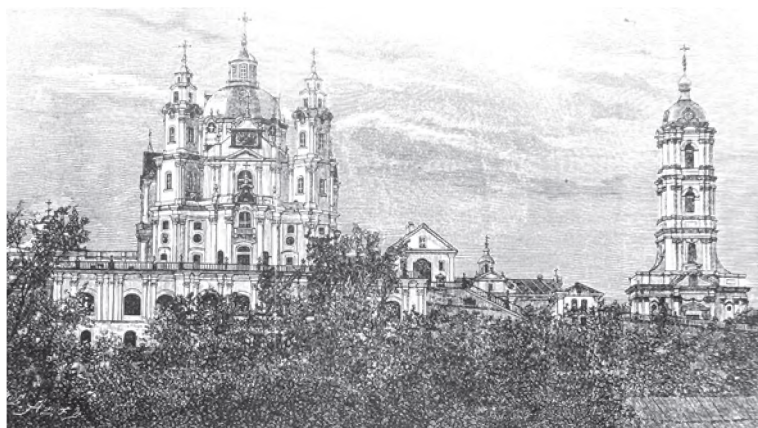
Почаевская Успенская лавра (гравюра второй половины XIX в.)

Почаевский Свято-Успенский мужской монастырь — одна из древнейших православных обителей не только Волыни, но и всей Украины, в начале XVIII в. переходит «в руки монахов базилианского ордена» и пребывает в униатской церкви немногим более ста лет. «Наконец, вследствие событий, зависевших от самих базилиан, принявших деятельное участие в польском повстании, повелением Государя Императора Николая Павловича, обитель эта 10-го октября 1831 г. возвра-