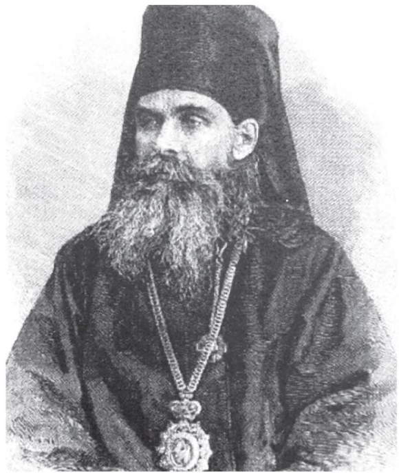
Епископ Люблинский Гedeон (Покровский)

Не исключено, что иеромонах Христофор (Сакович) мог прибыть в Холм, отстоящий от Почаева менее чем на 200 верст, накануне этого всенародного православного праздника Холмщины — его прошение о поступлении «на должность духовника Холмской духовной семинарии» датировано в документах, хранящихся в архиве Синода, «1 сентября 1887 г.» 22 . С 28 сентября того же года