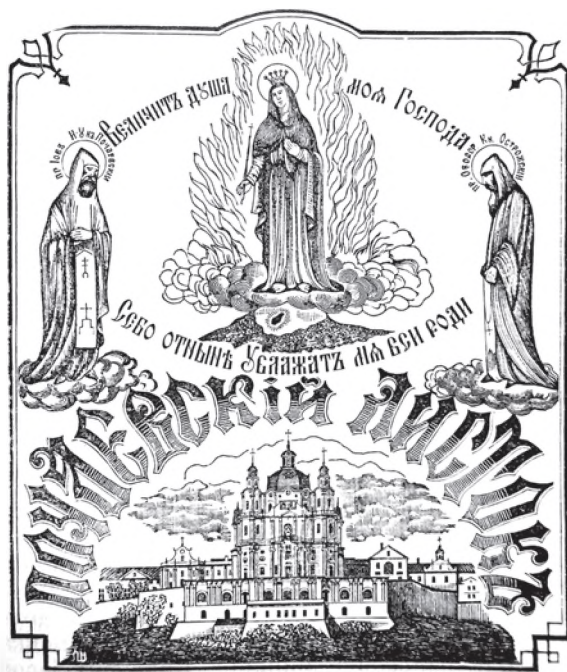
Гравированное заглавие «Почаевского листка»