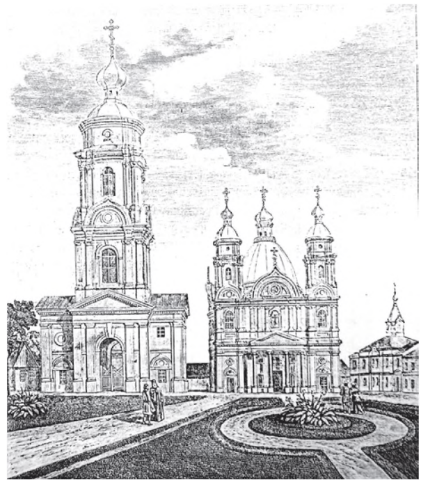
Православный кафедральный собор Рождества Пресвятой Богородицы на Даниловой горе в городе Холме (гравюра второй половины XIX в.)

Уже 23 января 1887 г. одобренный архиеписко-