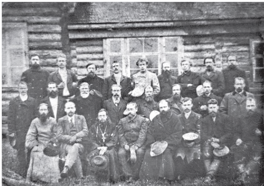
Общество трезвости деревни Демидово.

литературы, навыки иконописи и церковного пения. И важно еще, что Рачинский, как впрочем и десятки других помещиков, основавших школы, давал детям первоначальную профессию: мальчикам — столярное дело, пчеловодство, девочкам — ковроткачество, цветоводство... Актуальность «школы Рачинского» — как целостного понятия — в том, что ценность церковного искусства осталась прежней, подход татевского учителя к изучению церковнославянского и русского языков, математики оправдал себя полтора века назад, ведь