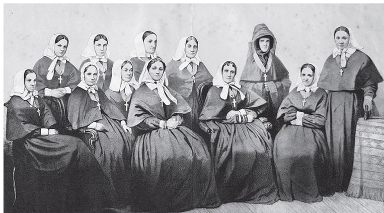
Сестры Крестовоздвиженской общины накануне отправки на фронт

Не забываются в этих финансовых хлопотах и малоимущие пациенты. Общинный врач Даллас отметил это в воспоминаниях за 1867 г.: «Публика с каждым годом более и более начинает ценить наших сестер за их истинно христианское милосердие, с которым они пекутся о вверенных им больных, как в частных домах, так и в городской больнице. Круг деятельности их постепенно расширяется. Таким образом, несколько благотворительных дам, желая основать приют для призрения 12 беспомощных старух, наняли помещения для них в соседстве с богадель-