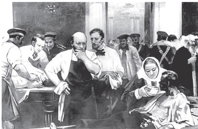
Н.И. Пирогов в военном госпитале

Сразу после бомбардировки Одессы и возвращения сестер и больных в богадельню, туда начали поступать и раненые воины, о принятии которых ее попечитель А.С. Стурдза думал еще до разразившейся войны. «Что, если святая война откроет пред нами новое поприще заслуг? — спрашивал он Екатерину Александровну 26 мая 1853 г. — Обитель наша на рубеже России, стоит лицом не даром —