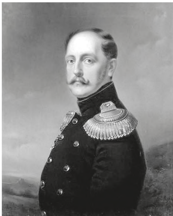
Император Российский Николай I. Портрет

ку Церкви? К тому же это происходит в синодальный период, неблагоприятный, как принято считать, для жизни Церкви в целом.