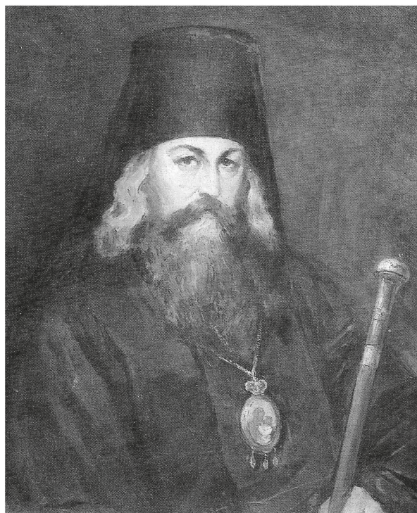
Святитель Игнатий (Брянчанинов). Портрет. XIX в.

Двумя названными Николаем I Филаретами отнюдь не ограничивается число активно дей-