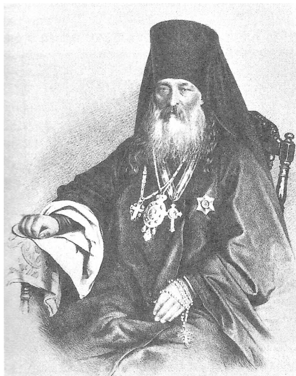
Архимандрит Антоний (Медведев), наместник Троице-Сергиевой лавры. Литографический портрет. 1863 г.

Преподобный Макарий, действовавший в глуши, весьма отдаленной от российских центров культуры, был на редкость образованным человеком. Магистр богословия, он знал древнееврейский, греческий, латинский, французский, немецкий, английский, итальянский языки. Перевел с древнееврейского Ветхий Завет. В ходе миссионерской деятельности изучил языки народов Алтая. При его участии и им самим были переведены на эти языки Евангелия от Матфея и от Иоанна, некоторые