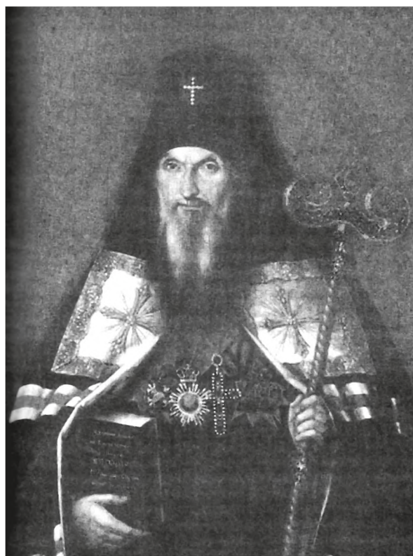
Святитель Антоний (Смирницкий), архиепископ Воронежский. Портрет. XIX в.

В 1816 г. в жизни и деятельности наместника произошли знаменательные события. Он принимал в июне великого князя Николая Павловича — будущего императора Николая I, и сопровождал его в обходе пещер, рассказывая жития святых. А в начале сентября Киево-Печерскую Лавру по-