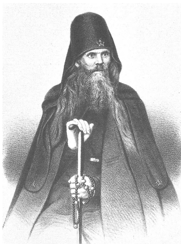
Киево-Печерский схимонах Парфений. Литографический портрет. 1845 г.

Трудно сказать, какой из особенно посещаемых в период правления императора Николая I монастырей имел в этом отношении наибольшие возможности. Но можно не сомневаться в том, что у Киево-Печерской Лавры эти возможности были.