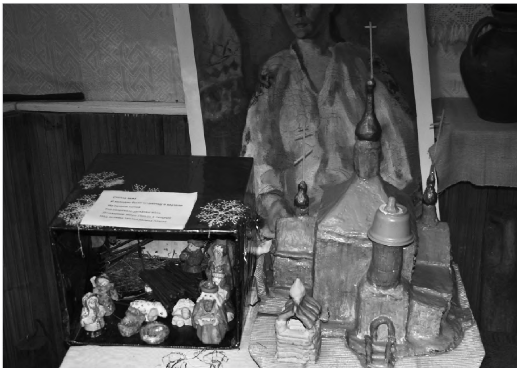
Пос. Кр. Гора. музей. Работа детей

глядела, как ведутся занятия, как организован курс занятий в Калуге в храме Покрова-на-рву. Там школа уже более 10 лет. Мы отказались от классно-урочной системы, не сидим за партами 40 мин. Все сели кружком, преподаватель беседует. Непринужденное общение. Урок 40–60 мин. Мы решили, что нужно больше развивать детей. Много детей из малообеспеченных семей, которые ничем не занимаются. Есть группа дошкольников с 3 до 6 лет, вообще дети до 15 лет, всего 110 человек. Предметы: именно, чтобы интересно. 1. Основы православия — это обязательно, каждый возраст по своей программе. 2. Изделия из глины — у младших. Старшие — развитие общей выносливости. Это спортивные занятия. 3. Трапезная — кулинария. Учим готовить и потом все пробуют. 4. Музыкальные занятия — праздничные песнопения. У нас и концерты, и спектакли ставим. К владыке ездим на Рождество на колядки. Это традиция нашей епархии. Старшие мальчики занимаются лозоплетением. Какие-то занятия объединяем, но за день четыре предмета должны пройти. И чаепитие обязательно».