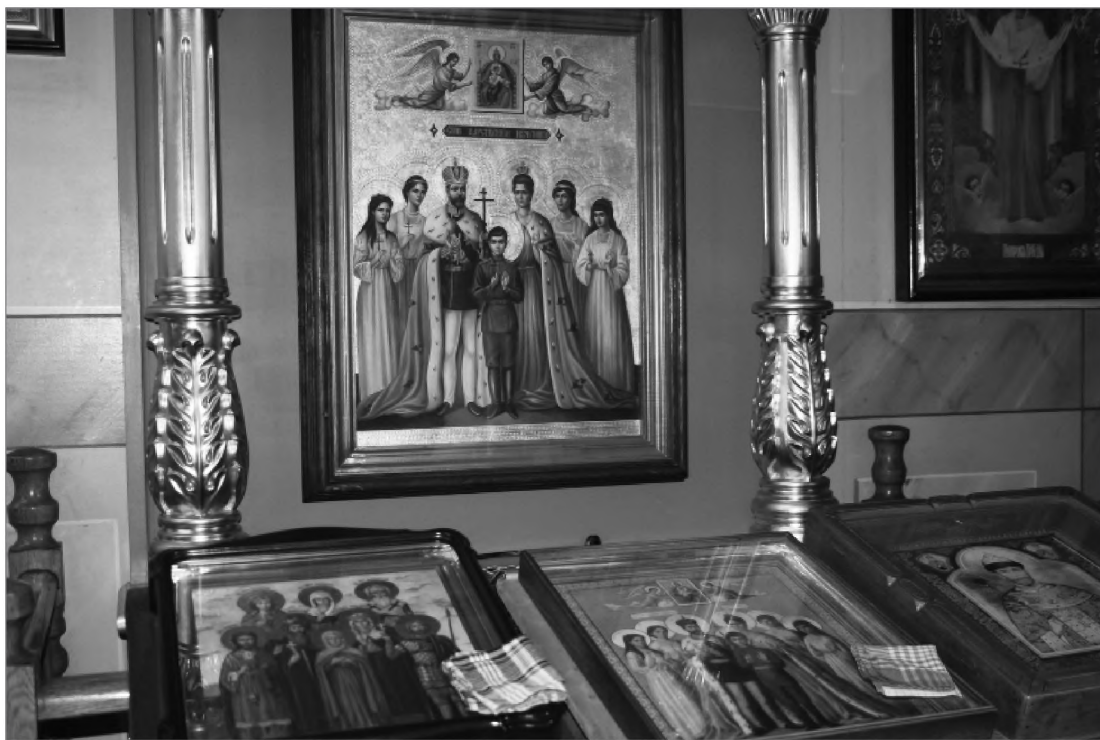
Иконф царской семьи в Петропавловском соборе г. Симферополя. 2012 г.

Придание нового звучания празднованию дня свт. Николая в Крыму происходит на фоне все возрастающего почитания Николая II и царской семьи, инициатива которого исходит от Церкви и верующей общественности, что находит понимание у местных светских властей. Это почитание, особенно в центре епархии и городах, связанных с пребыванием царской семьи, нельзя не заметить. Различные мероприятия, в том числе крестные ходы, посвященные царской семье, особые праздники 12 , буклеты и иконки в церковных лавках, лики на стенах храмов — все это не только отражает, но и формирует определенное общественное мнение. Глаз привыкает к тому, что царский лик входит в сонм икон особо почитаемых святых, чему может способствовать и особое расположение икон в храме. Так, в Никольской церкви с. Мазанка параллельное заверше-