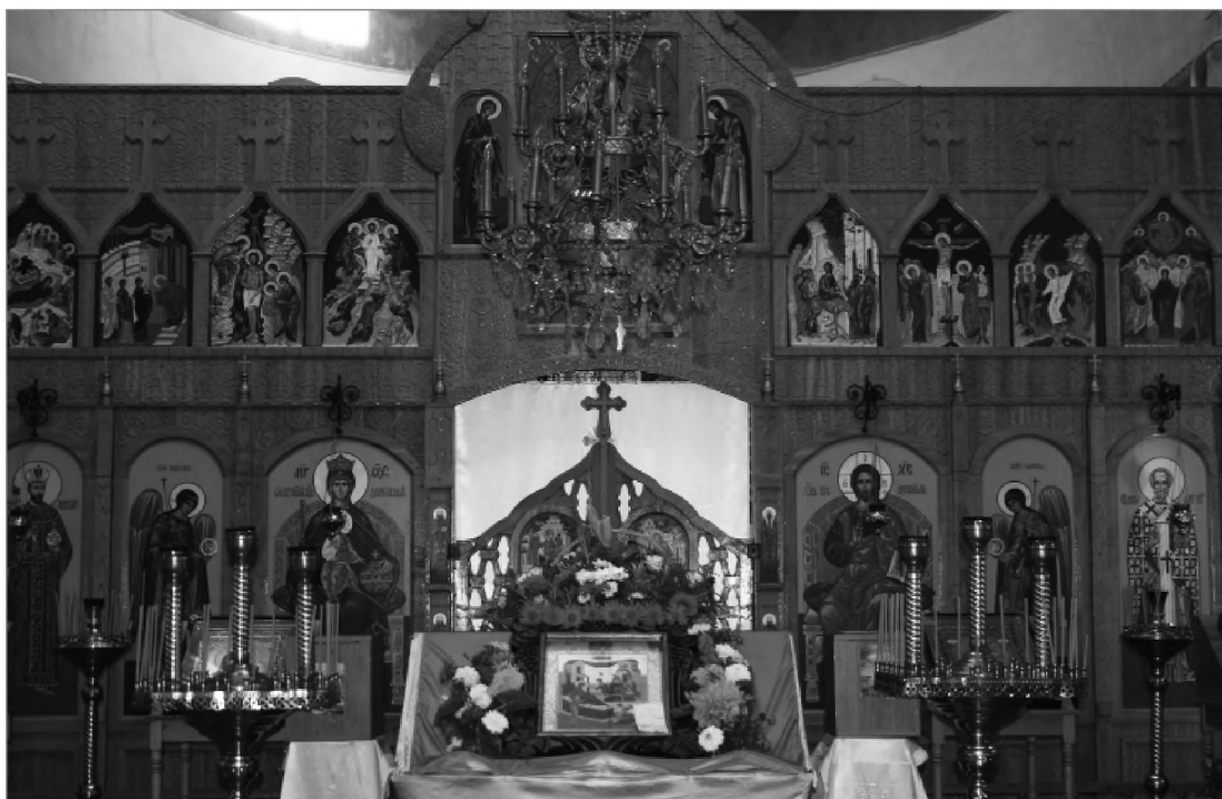
Иконы Николая чудотворного и Николая II в иконостасе Никольского храма с. Мазанка Симферопольского р-на. 2012 г.

ние местного ряда иконостаса: с одной стороны — свт. Николай Чудотворец, с другой — святой царь Николай II, создает ощущение равного их покровительства православному миру и, конкретно, — данному селу (Симферопольский р-н, 2012). Почитание св. Николая II в Крыму, которое мы отмечали еще в 2012 г. — это дополнительное проявление связи с Россией, с единой Церковью, возглавляемой Московским Патриархатом.