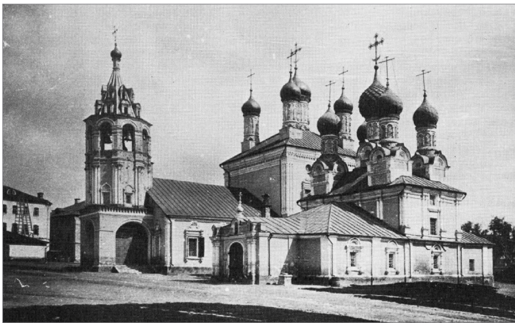
Георгиевский монастырь в Георгиевском пер. Фото 1881 г.