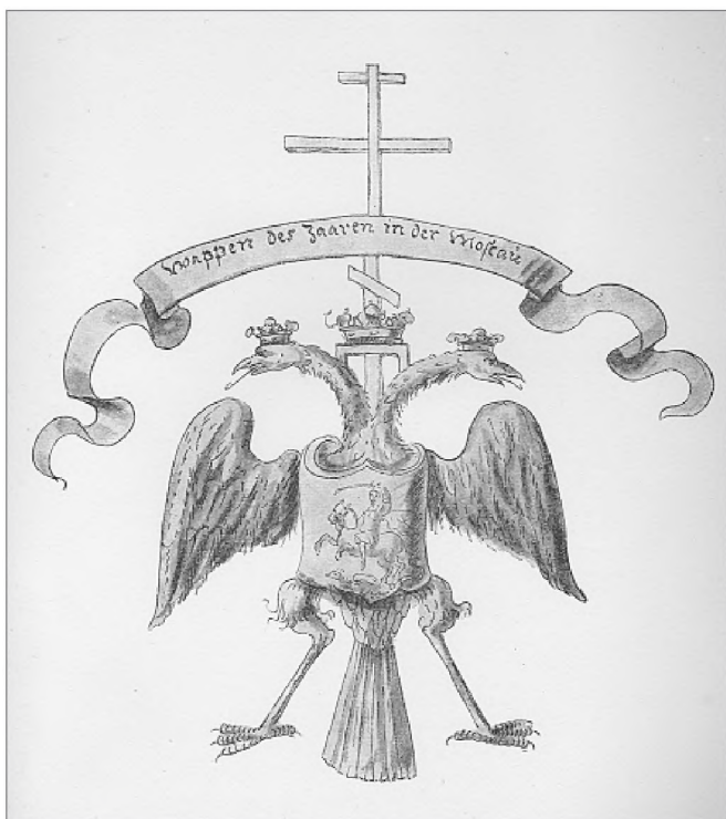
Герб царя Алексея Михайловича, которым завершалась Спасская башня. Рис. Мейерберга 1662 г. Альбом Мейерберга. СПб., 1903

третьей архитектурной вертикалью над Кремлем, на нее были ориентированы улицы в XVII в. Градостроительный ансамбль церковного и государственного величия, задуманный и созданный Романовыми в центре Москвы, постепенно пополнился до тех пор, пока Петр I не запретил строительство, отправив всех мастеров на возведение зданий Санкт-Петербурга.