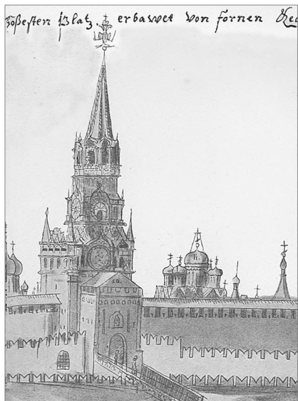
Спасская башня. Фрагмент рис. Мейерберга 1662 г. Альбом Мейерберга. СПб., 1903 г.

Согласно Мейербергу, Спасскую башню венчал герб Москвы: двуглавый орел, на груди которого имелся щит с изображением всадника, мечом поражающего дракона. По мнению исследователей российской геральдики царь Алексей Михайлович видел в этом всаднике себя как защитника Православия 10 . Орлиные головы венчали короны, а между ними возвышался скорее всего деревянный восьмиконечный Голгофский крест, в основании которого была самая большая корона Царя Небесного. Оправданием для установки креста над башней служило наличие