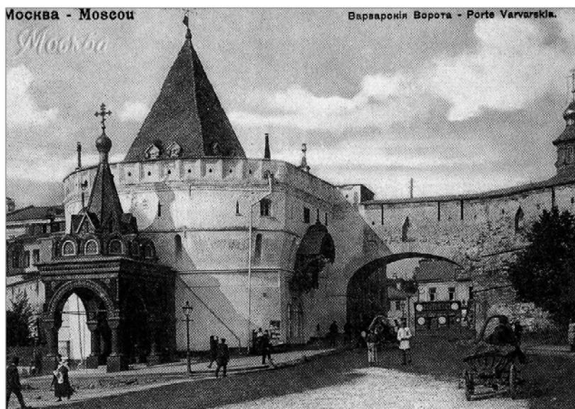
Вид на Варваринские ворота и Климентовскую церковь. 1900-е. Почтовая открытка

В царствование Алексея Михайловича в 1657—1658 гг. на фундаменте разобранной древней церкви возвели характерный посадский пятиглавый храм XVII в. 20