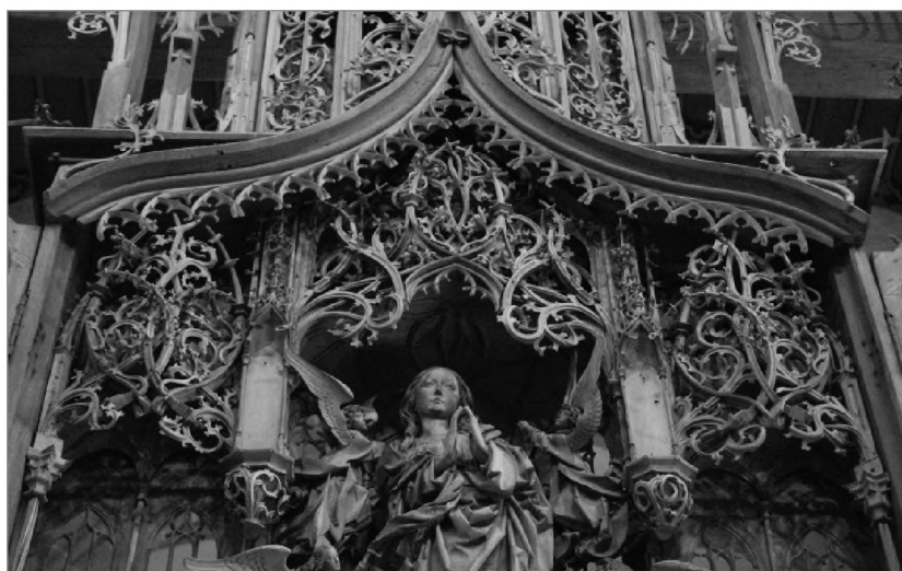
Готический алтарь 1505 г. работы Тильмана Рименшнайдера в Креглингдене (фрагмент)

Колокольня в центре символизирует собой престол Судии с шатровой сенью. Глас колоколов — глас Божий. По углам куба были поставлены четыре фигуры Евангелистов. Получалась композиция как на обложке Библии. Скульптуры на Спасской башне были типичной ренессансной композицией, что доказывает желание Романовых решать градостроительные задачи в русле западно-европейской культуры. С другой стороны, изображение на святых воротах Евангелистов было древней византийской традицией. На Царских вратах в храмах обязательно помещались или написанные образы или резные фигуры Евангелистов.