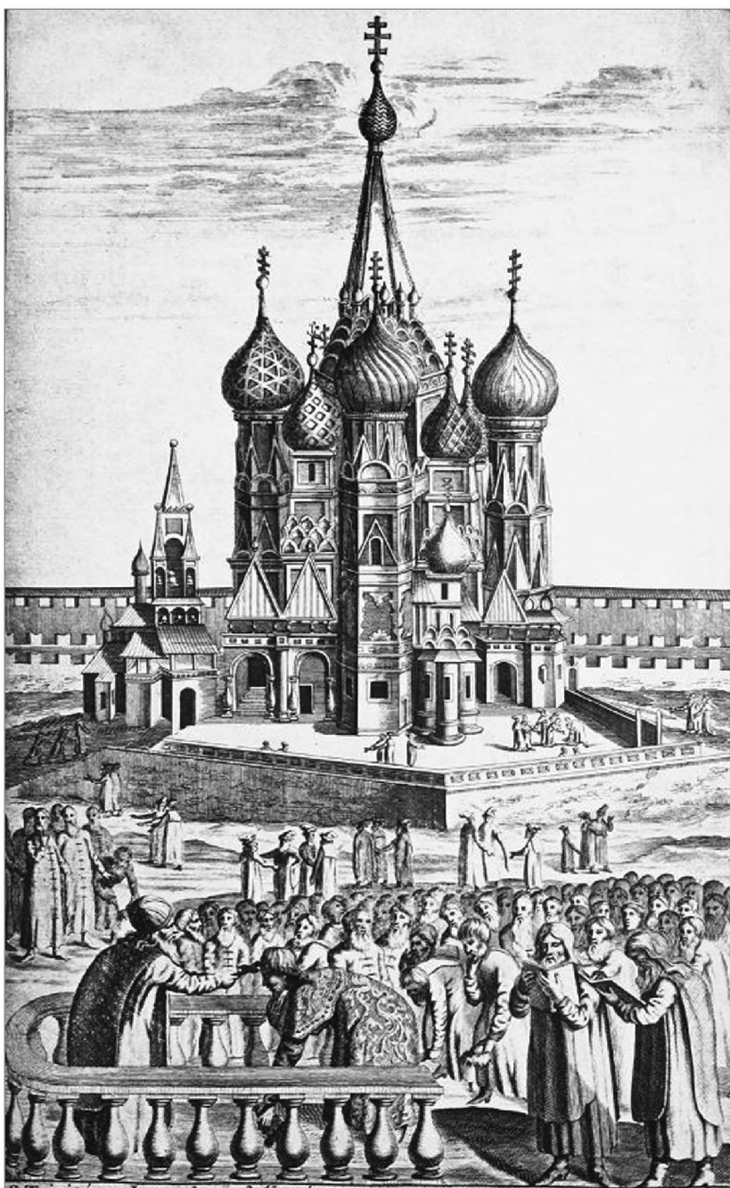
Патриарх осеняет царя крестом на Лобном месте. Гравюра по рис. Олеария 1636 г. Альбомы А. Н. Найденова. ГИМ

нял крестом царя и народ. До 1656 г. «Шествие на ослиати», когда царь вел под уздцы лошадь с патриархом, совершали от Соборной площади Кремля до Вхоиерусалимского придела Покровского собора, а после праздничной службы — обратно. Царь Алексей Михайлович изменил чин. Царь и патриарх приходили в Покровский собор в простой одежде, на службе