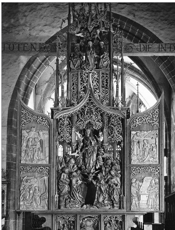
Готический алтарь 1505 г. работы Тильмана Рименшнайдера в Креглингдене