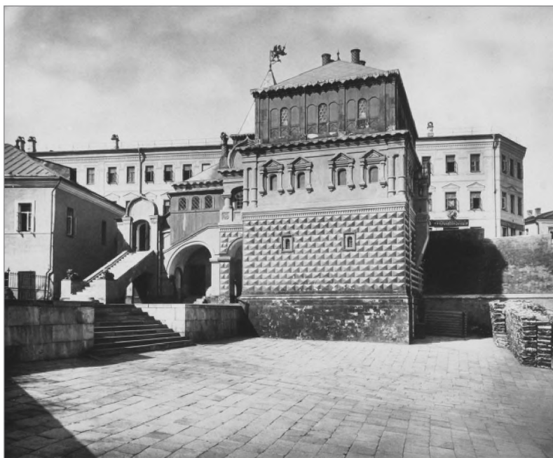
Палаты бояр Романовых на Варварке. Фото 1883 г.

Варвара Ивановна умерла в 1552 г. От второго брака с княжной Евдокией Александровной Горбатой-Шуйской Никита Романович имел шесть сыновей и шесть дочерей. Обширный двор на Варварке уже с середины XVI в. стал наполняться каменными строениями. В середине участка располагались «Палаты на нижних погребках», которые служили основным жилым помещением. На улицу выходили поставленные глаголем «Палаты на верхних погребках». Именно они формировали парадный вид с улицы, возвышаясь двумя высокими этажами над прохожими. Скорее всего, шатровое башенное завершение ближней к Кремлю части здания появилось уже в XVI в., в то время как основной объем здания был перекрыт высокой четырехскатной крышей. В результате хоромы имели удивительно живописный вид, возвышаясь над простой застройкой. Никита Романович привез из Новгорода, куда он был поставлен воеводой, икону Божией Матери «Знамение», ставшую покровительницей