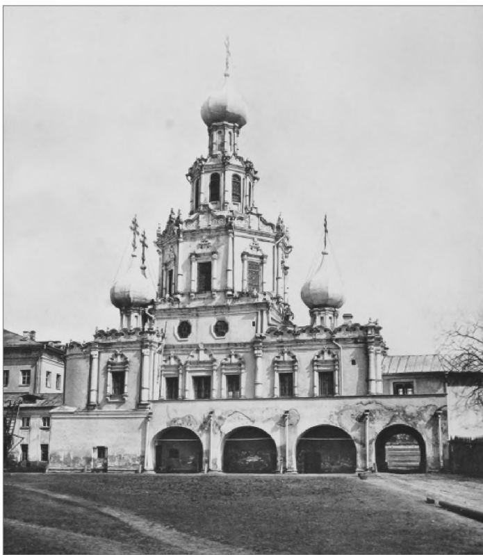
Церковь Знамения Пресвятой Богородицы при доме графа Шереметьева. Фото 1875 г.

Георгиевский монастырь, а над Занеглименьем господствовала Знаменская церковь Романова двора на Никитской.