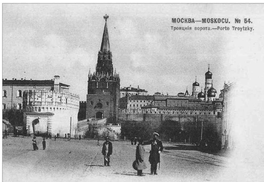
Вид Кремля и Троицких ворот от перекрестка Воздвиженки и Моховой улиц. 1900-е. Почтовая открытка