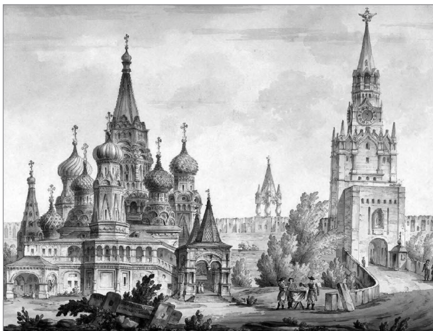
Покровский собор и Спасская башня. Гравюра конца XVIII в.

му образцу. В первую очередь на Красную площадь начали совершать «Шествие на ослиати» во Входинерусалимский придел Покровского собора с молебном и чтением Евангелия на Лобном месте. Покровский собор стал архитектурной доминантой Кремля с Китай-городом. Царем Борисом Феодоровичем и патриархом Иовом предпринимается попытка возведения нового собора «Святая Святых», тесно связанная с расширением чина действия Страстной пятницы. Программа организации градостроительного ансамбля Москвы как образа Священного Града получила от царя Бориса Феодоровича надстроенную в 1600 г. колокольню Ивана Великого, отмечавшую вертикалью объединенную Соборную и Ивановскую площадь как место, назначенное для главных религиозных событий 2 . Образ Священного Града толковался одновременно и как образ земного Иерусалима и как образ Небесного Града. Шествие в Страстную пятницу задумывалось как торжественное перенесение многочисленных плащаниц с мощами святых, завершаемое золотой плащаницей Господа Иисуса Христа из нового собора в Успенский для совершения чина омоновения святых мощей. Интересно отметить, что по мнению Баталова программа строительства предусматривала использование архитектурных