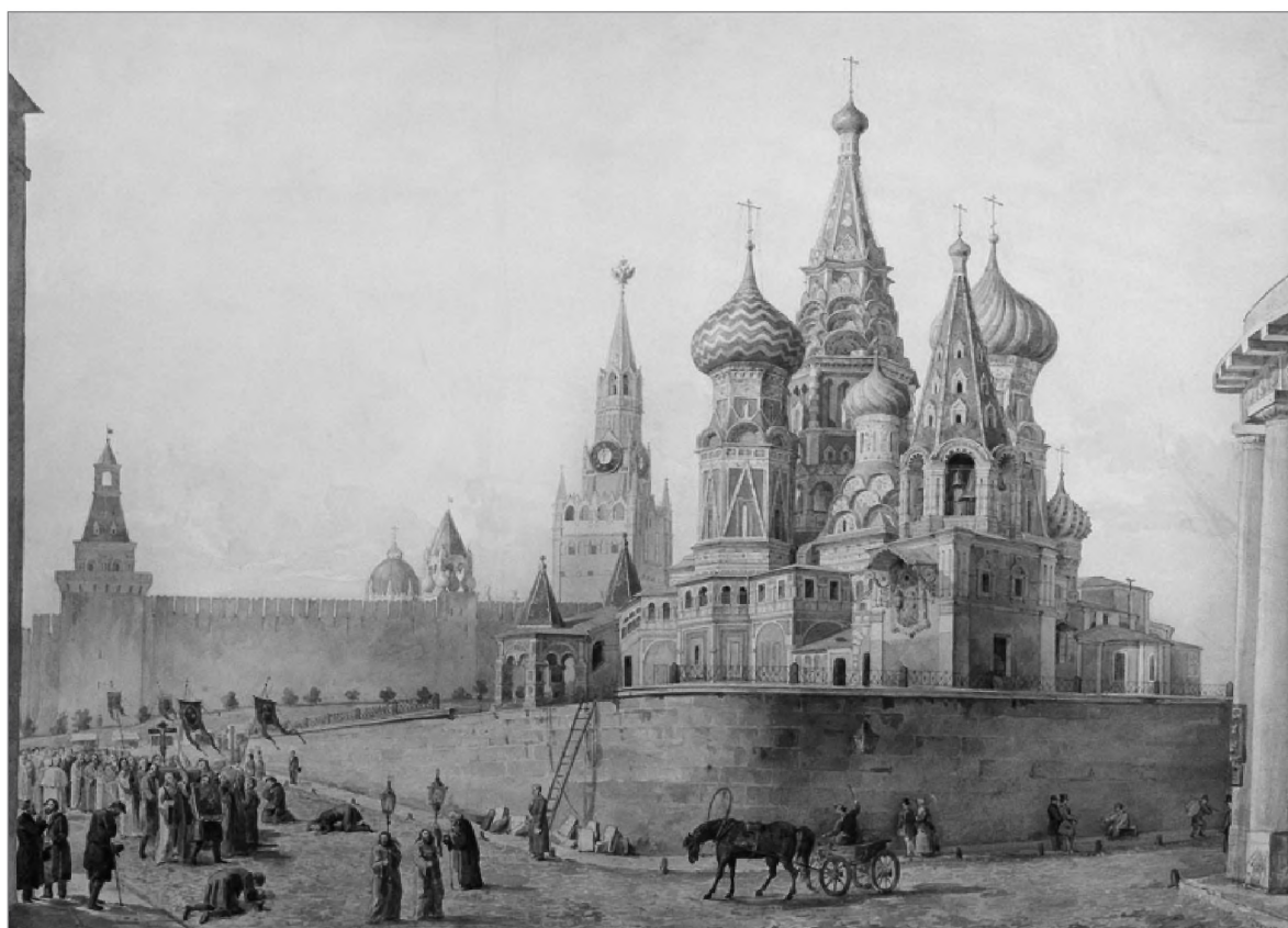
Крестный ход выходит на Варварку от Покровского собора. Рабус К. И. Гравюра. Первая половина XIX в.