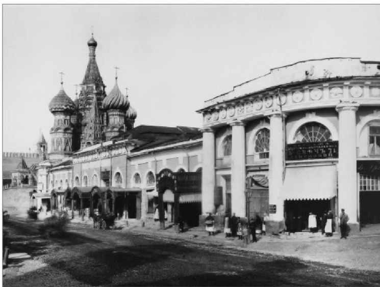
Вид на Варваринские ворота и Климентовскую церковь. 1900-е. Почтовая открытка

В Китай-городе был свой эффект «чудесного видения Небесного Града». Вместо городской крепости из-за особенностей рельефа в качестве образа Небесного Града для путника выступал десятиглавый Покровский собор вместе с колокольней, что, очевидно, предполагалось еще в XVI в. Размеры строений вдоль улиц при приближении к Красной площади также понижались, и Покровский собор возвышался над