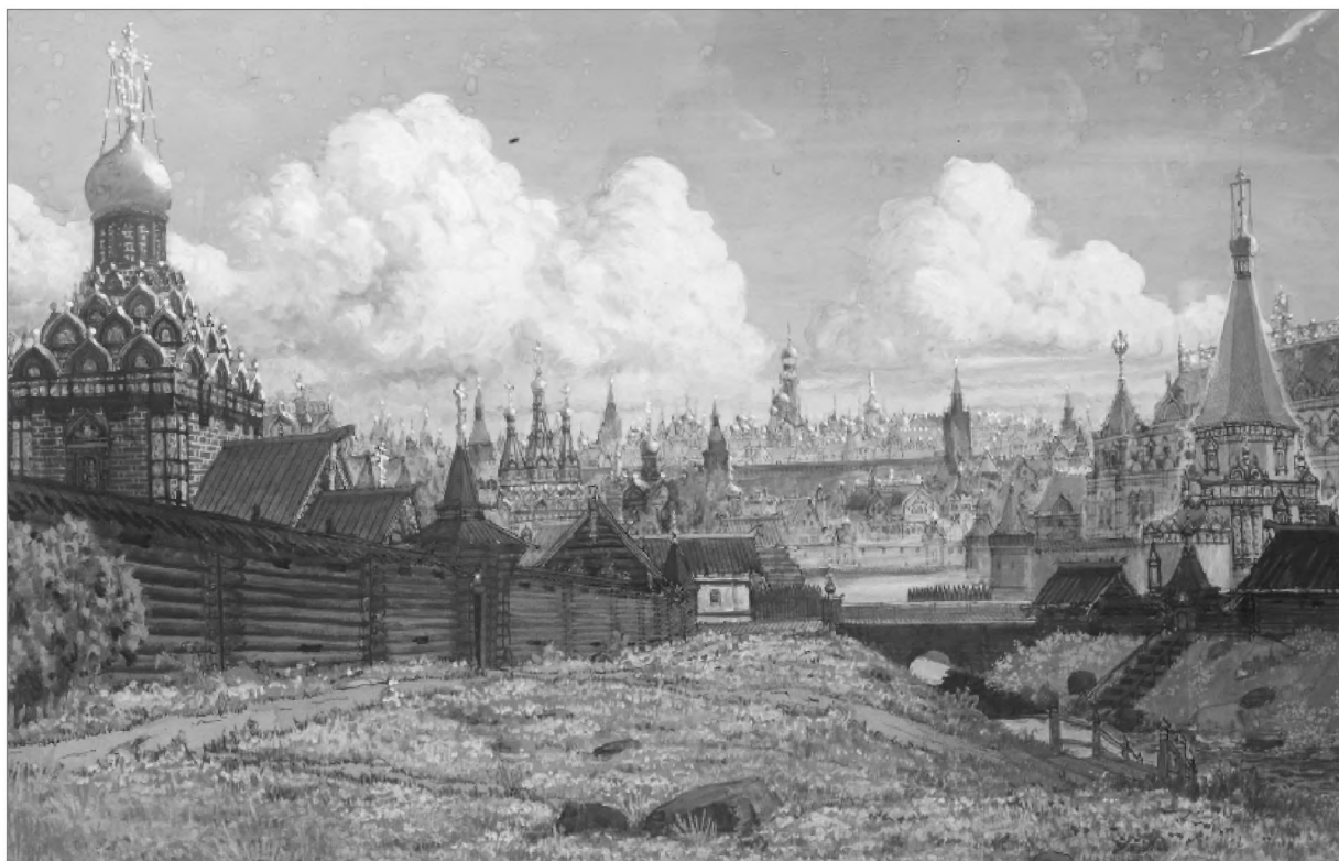
Видовая реконструкция обозрения Кремля из Успенского вражка в XVII в. М. П. Кудрявцева

деревянная церковь сгорела, вместо нее при царе Михаиле Федоровиче и патриархе Филарете Никитиче в 1634 г. были возведены колокольня и каменный храм 32 .