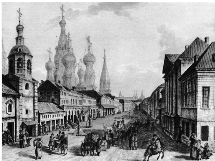
Вид на Варваринский крестец и Покровский собор по Москворецкой улице. Гравюра Ф.Я. Алексеева 1801 г.

Воздвиженки по переулку, находившемуся сразу за двором. В 14 саженьях от Никитской вдоль переулочка красовались двухэтажные палаты длиной 30 сажень. В самом конце участка, посередине между Никитской и Воздвиженкой возвышалась Знаменская церковь. Впервые деревянный храм, сооруженный Иваном Никитичем, упомянут в переписи 1625 г. Престол Знаменской церкви был посвящен чудотворной иконе — покровительнице Романовых. В переписи 1657 г. церковь указана каменной и построенной Никитой Ивановичем на своей боярской земле 24 .