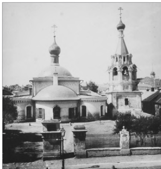
Церковь Феодора Студита у Никитских ворот. Фото 1881 г.

В память этой знаменательной встречи в 1624—1626 гг. была поставлена церковь Феодора Студита у Никитских ворот в честь святого покровителя Филарета Никитича, урожденного Феодора. При этом храме патриархом Филаретом был основан Феодоровский Смоленский Богородицкий мужской монастырь. Монастырь был больничным и домовым у патриарха 29 .