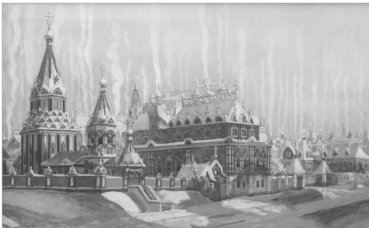
Церковь Вознесения Господня малая на Большой Никитской в XVII в. Видовая реконструкция М. П. Кудрявцева

От церкви Феодора Студита перед путником представляли трехшатровые Никитские ворота, слева от которых возвышались над стеной три главки храма святого Иоанна Предтечи, что близ Никитских ворот. Небольшая каменная церковь была поставлена в первой половине XVII в. в слободе выходцев из Устюга в 27 саженьях (менее 60 м) от ворот в узком проезде вдоль стены Белого города. Такое расстояние воспринималось как достаточное, чтобы назвать храм находящимся «близ ворот», а не «у ворот». Основной престол церкви был посвящен Знамени Пресвятой Богородицы и первоначально был один. Впоследствии храм стали именовать по придельному престолу святого Крестителя Господня Иоанна. Само посвящение храма показывает, что его устройство было связано с Романовыми. В 1786 г. церковь была разобрана «за ветхостью» 30 .