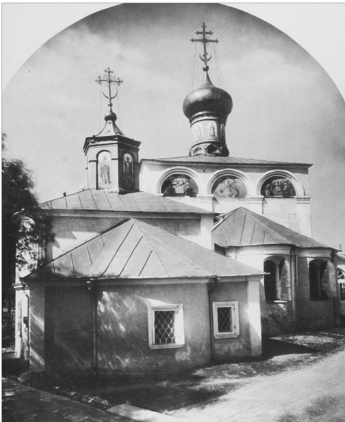
Никитский собор и церковь Димитрия Солунского Никитского монастыря. Фото 1882 г.