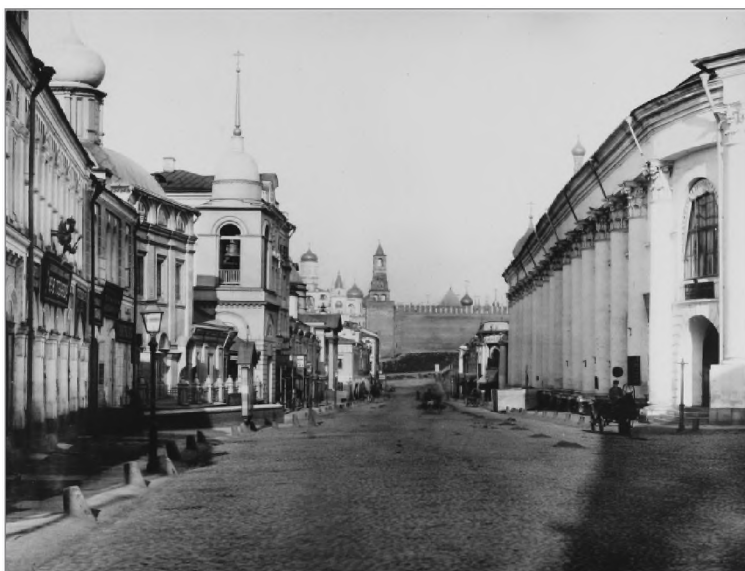
Вид Варварки от палат Романовых на Кремль. 1886.