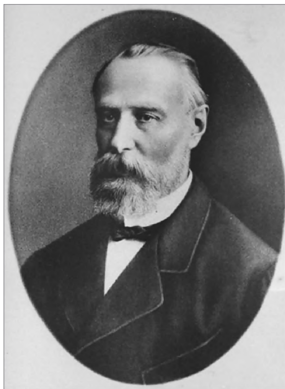
Катков М. Н.

Верующая интеллигенция подвизалась на пользу народа также безвозмездным трудом