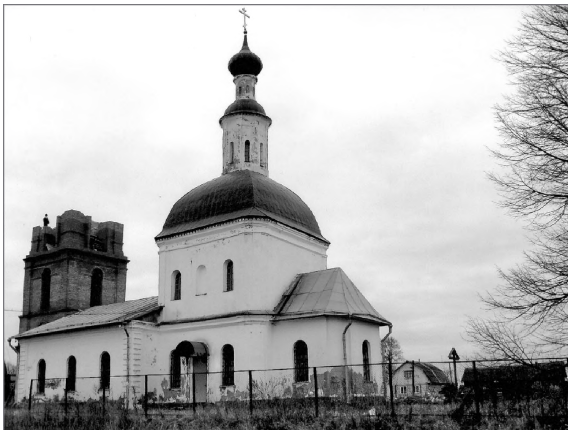
Церковь Покрова Пресвятой Богородицы в с.Зиновьево. 2012 г.

Да продлит Господь Бог твою старость на многие еще лета. Сердечно болею, что слабость здоровья воспрепятствовала тебе навестить-посетить меня с сиротами, но при этом, не разстраивая раны твоего сердца сострадательного, покорнейше прошу меня извинить, что хочу сказать: посетить тебя, милый мой Батюшка, в вакационное время и с детьми я никак тоже не могу. Детей всех взять невозможно, а оставить без себя здесь кого бы то ни было из них жалко: при мне они хотя и обижены, но веселы, хотя и не доели, но играют; если же я уйду — без меня они