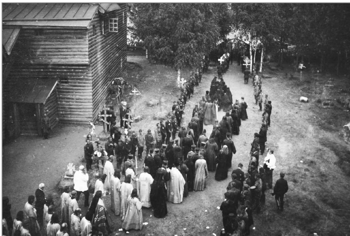
Крестный ход в Синозерской пустыни в дни прославления пр. Евфросина. Фото 1912 г.

На церковные торжества было приглашено много гостей и уроженцев Устюженского края: председатель Совета министров В. Н. Коковцов,