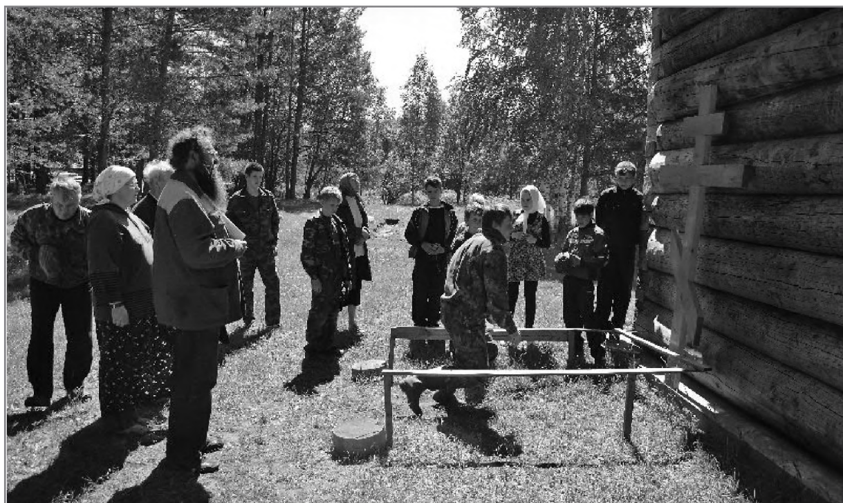
Место коленопреклоненной молитвы св. Евфросина

Местные старожилы указывают еще на одну святыню пустыни, теперь известную многим