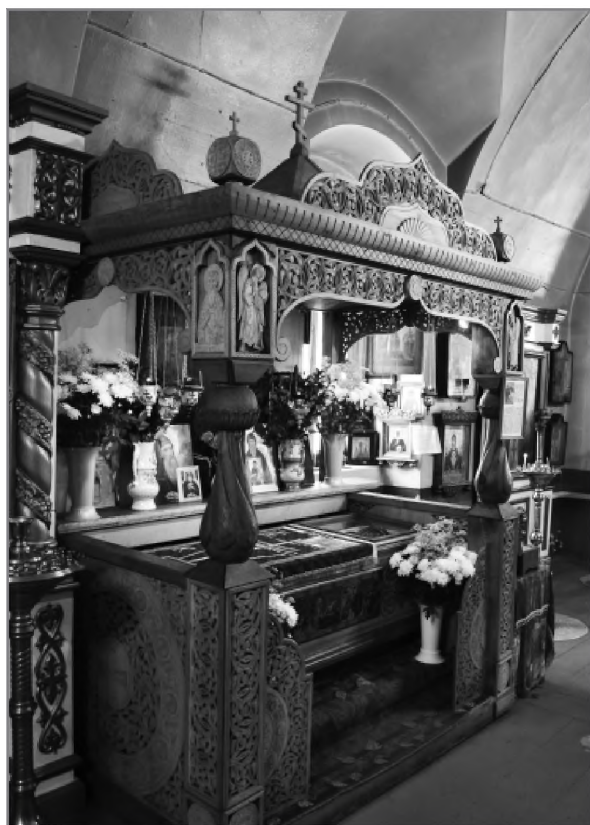
Современная рака преподобномученика Евфросина в Казанском храме. Г. Устюжны

она, будучи ребенком, видела, как привезли женщину, привязанную к лошади, «женщина та кричала мужицким голосом и вырывалась», ее держали несколько мужчин, подвели к мощам и держали на коленях, а она кричала все сильнее и сильнее, но когда приложили, она перестала кричать.