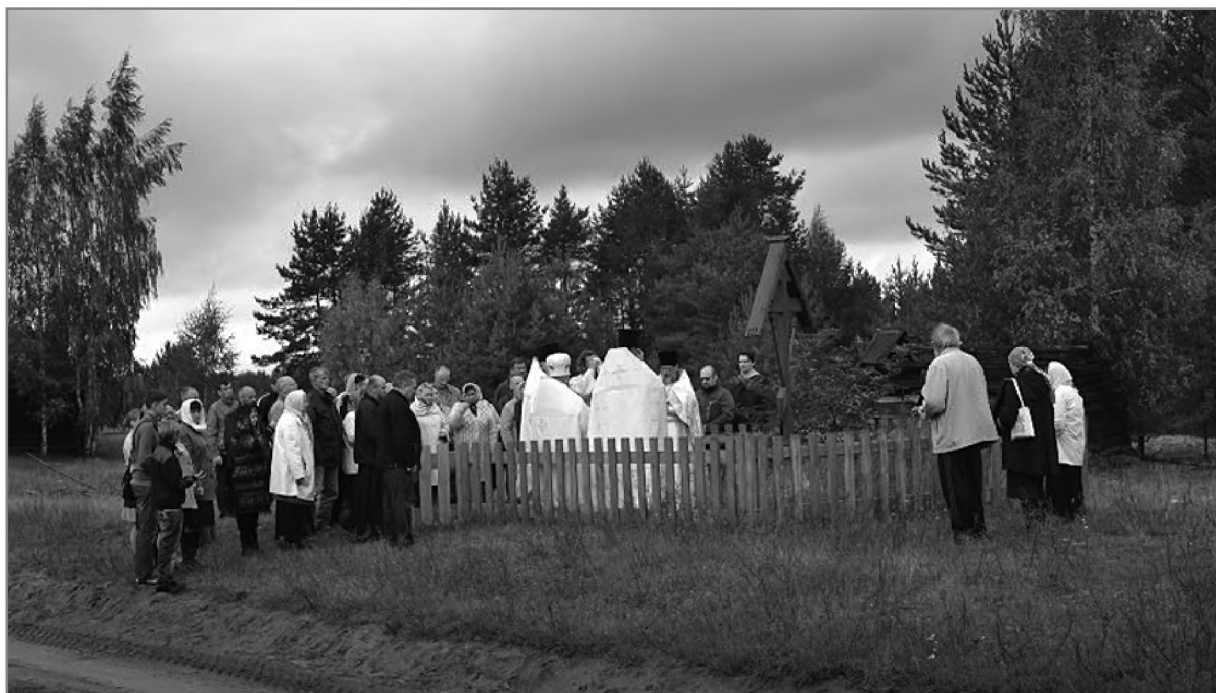
Молебны на месте убийства препмч. Евфросина

в пустыне был заложен новый храм во имя апостолов Петра и Павла. В 2005 г. был поставлен еще один поклонный крест на предполагаемом месте гибели преподобномученика Евфросина. Он расположен возле источника, ископанного самим старцем. Источник представляет собой небольшое озеро, посредине которого бьет ключ 24 . Паломники набирают воду из этого источника и совершают в нем омовение. 2 апреля 2012 г., в день 400-летия памяти святого Евфросина были отслужены первый молебен в новом Петропавловском храме и молебен около поклонного креста. Молебны около креста на месте подвижнической гибели Евфросина священники соседних приходов совершают каждое лето с 2005 г.