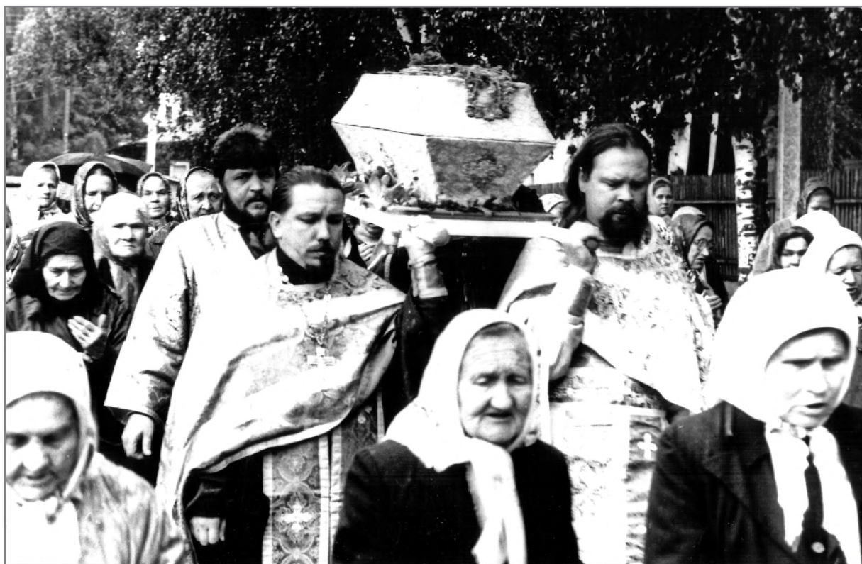
Перенесение святых мощей преподобного Евфросина 16 июля 1995 г. из музея в Казанскую церковь Устюжны

В 1995 г. на месте строений Синозерской пустыни был освящен поклонный крест, установленный совместными усилиями верующих, краеведов, музейных работников Чагоды, Устюжны, Череповца. С этого времени начинается посещение святых мест новыми паломниками. На территории пустыни с августа 2000 г. ежегодно и по сей день работает церковно-краеведческий отряд «Ловитва». Стараниями ребят была расчищена горка, где находилась землянка преп. Евфросина, святой колодец, ископанный им. Место бывшего монастыря на берегу Синичьего оз. было очищено от мусора и валежника. В старой пустыне (месте первоначального поселения святого Евфросина) в 2001 г. установлена и освящена часовня. В 2004 г.