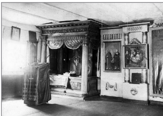
Рака преп. Евфросина 1799 г.