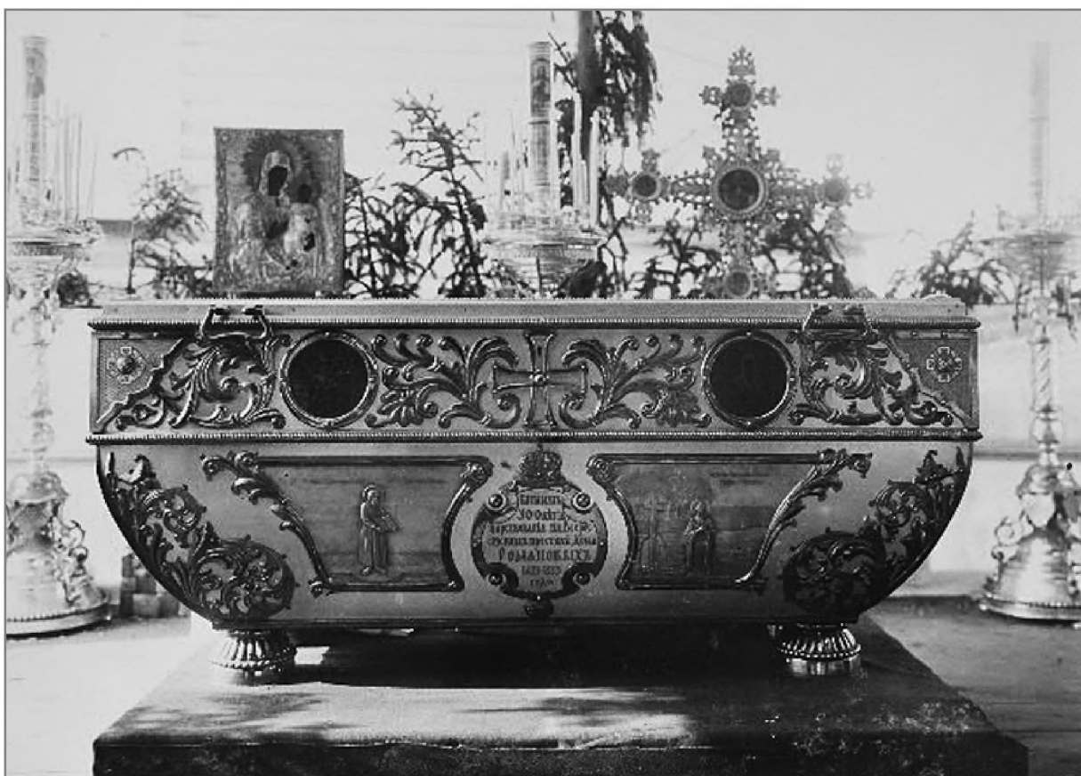
Бронзовая рака для мощей преподобномученика Евфросина, преподнесенная царской семьей в связи с 300-летием дома Романовых