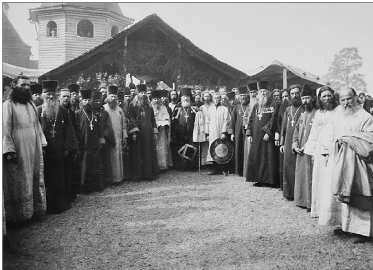
Священнослужители, прибывшие на прославление в 1912 г.

1912 год. 25–30 июня/8–13 июля. Состоялись церковные торжества по случаю 300-летия мученической кончины преподобного Евфросина и восстановление церковного почитания его в присутствии новгородского губернатора М.И. Иславина и 35 тыс. паломников.