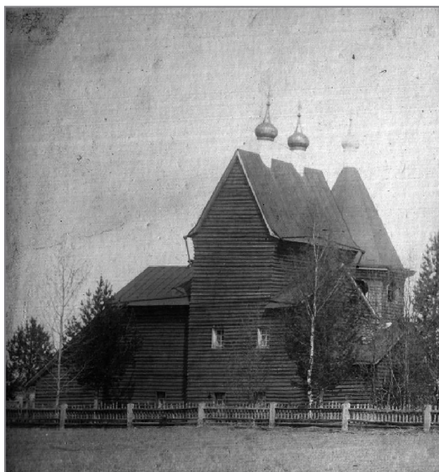
Благовещенская церковь Синозерской пустыни. Фото начала XX в.

Евфросин был знаменитым старцем, его широко знала древняя православная Русь. Восстановленной в 1619 г. после смерти старца обители благодетельствовали русские цари, великие князья и знатное боярство. Грамотой царя Михаила Федоровича Романова (1630 г.) пустыни были даны земли во владение по р. Чагодоше вверх и вниз на две версты в вотчину. В то же время в обители был воздвигнут храм