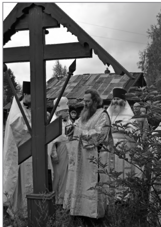
Молебен на месте убийства прп. Евфросина 2012 г.