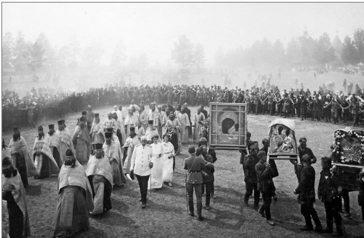
Крестный ход в Синозерскую пустынь с чудотворными Вологодскими иконами 22 июня 1914 г.