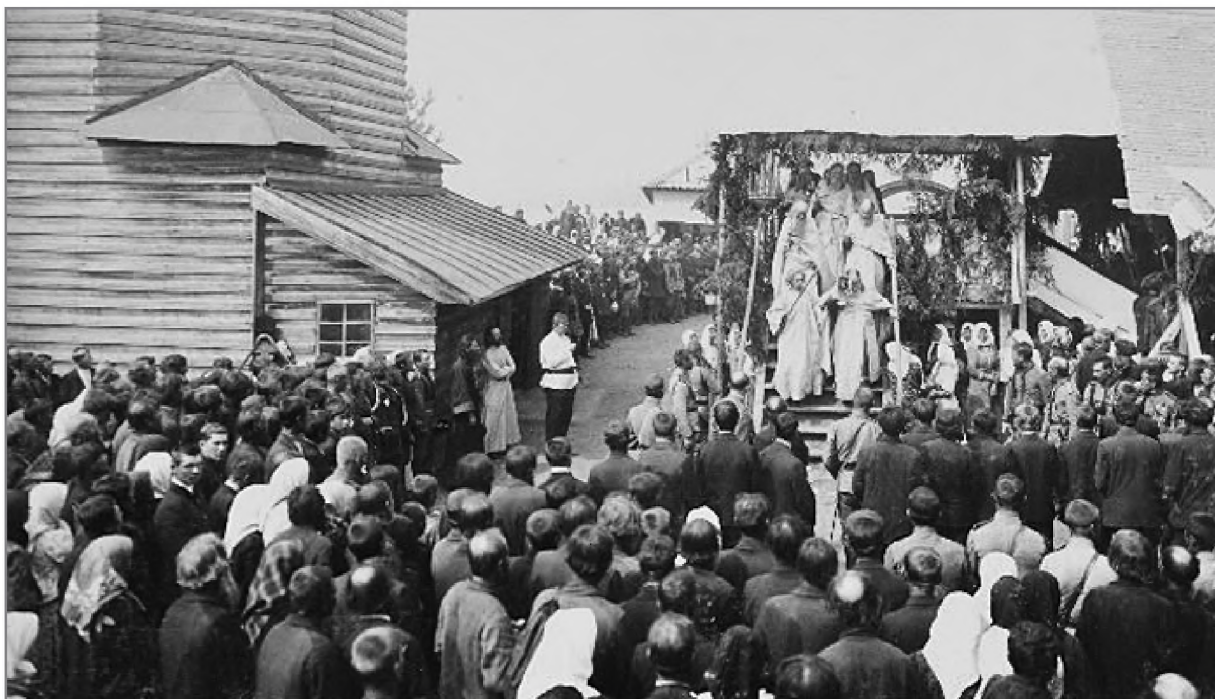
Молебен святому в дни прославления в Синозерской пустыни близ колокольни, под спудом которой покоились мощи старца Евфросина