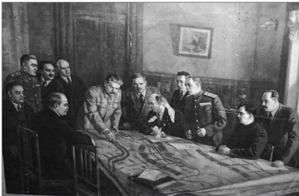
Из журналов сталинской эпохи. Репродукция, обнаруженная нами в сельском доме (в сенях, на стене). Фото 2013 г.

гамме: или давайте его на иконы помещать, или он — тиран, бестия и исчадие ада. Ни в ту, ни в другую рамку он не влезает. Но для либералов он, в первую очередь, ненавистен даже не репрессиями, а как человек, который в свое время положил конец интернационалистской вакханалии в России 1920-х гг. Сталин фактически уничтожил все ядро революционеров-интернационалистов, состоявшее преимущественно из евреев и представителей других нацменьшинств, для которых разрушение традиционной России было чуть ли не главной целью революционного движения». «Во-вторых, — продолжил С. Михеев, — для либералов Сталин — это человек, который смог воссоздать институты жесткой государственной власти в России и возродить ее традиционные формы существования. Да, это было в очень искаженном виде и происходило очень болезненно. Просто в какой-то момент Сталин четко понял, что дальнейшее существование страны в парадигме ленинско-троцкистской мировой революции — это тупиковый путь. Как