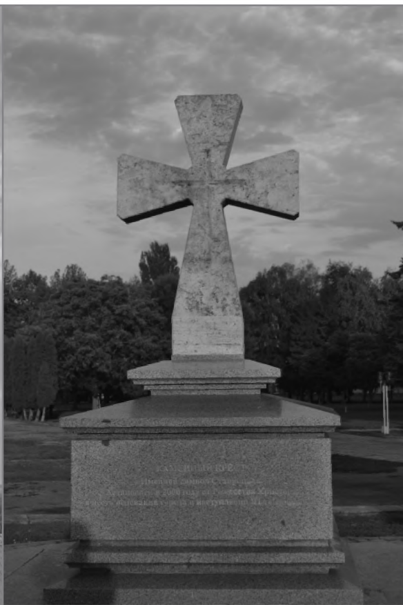
Поклонный крест, установленный на центральной площади г. Ставрополя, как главный символ города