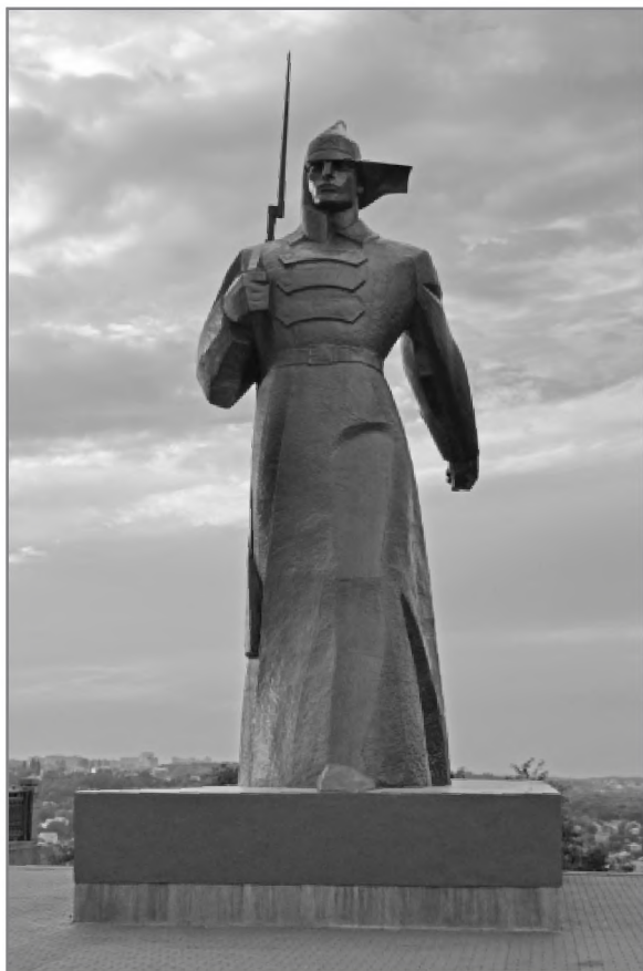
Памятник «Защитникам советской власти». г. Ставрополь.

Движение в сторону создания постмодернистского общества не исчерпывается только революционным переходом к варианту либерального постмодерна, поскольку существует и консервативный вариант постмодерна . Он связан с образцовой советской эпохой и образцовой личностью этой эпохи — Сталиным. Чтобы направить страну и народ в сторону реализации этого проекта не нужно будет совершать революцию, здесь возможен эволюционный путь. Это огромный плюс для России. Но уход в постмодерн, а именно это предполагает копирование модерном модерна, поставит крест как на самобытности (в том числе духовно-религиозной) так и на