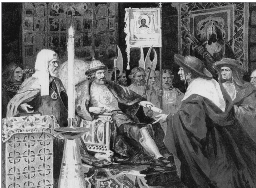
Картина Г.И. Семирадского «Александр Невский принимает папских легатов»

вость, величественный вид. Его многочисленные поездки в Орду, разрушившие, в конце концов, к 43 годам здоровье, оцениваются как жертвенный подвиг святого князя 239 . Духовный опыт св. князя Александра стал главным его оружием в политической деятельности.