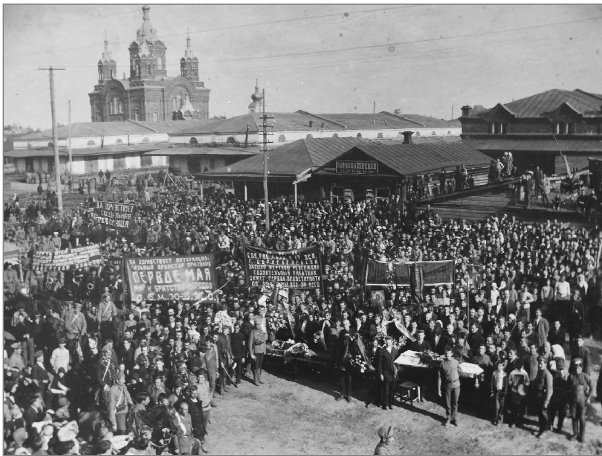
Похороны начальника ЧК в г. Борисоглебске. 1918 г.

вей и монастырей. К 1921 г. у Церкви отобрали 722 монастыря 107 , остальные были превращены до времени в хозяйственно-трудовые артели. К 1927 г. 117 епископов находилось в различных местах заключения 108 . В тоже время на начало 1930 г. паству опекало 163 архиерея 109 . Чтобы сохранить епископат, проводились дополнительные хиротонии, в том числе тайные. На начало 1928 г. на территории РСФСР действовало 28 560 приходов, а, значит, около 50 тыс. церквей и часовен было закрыто за «ленинский период». Церковь была ограблена и подвергнута невероятному насилию и бесчестию во время компании по изъятию ценностей, святых мощей, сжиганию и поруганию икон. Динамика закрытия церквей