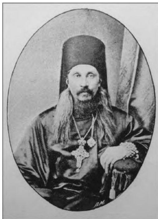
Архимандрит Митрофан (Флоринский)

Письмо Ваше имел удовольствие я получить 10-го числа утроем. Из него усматриваю Ваши