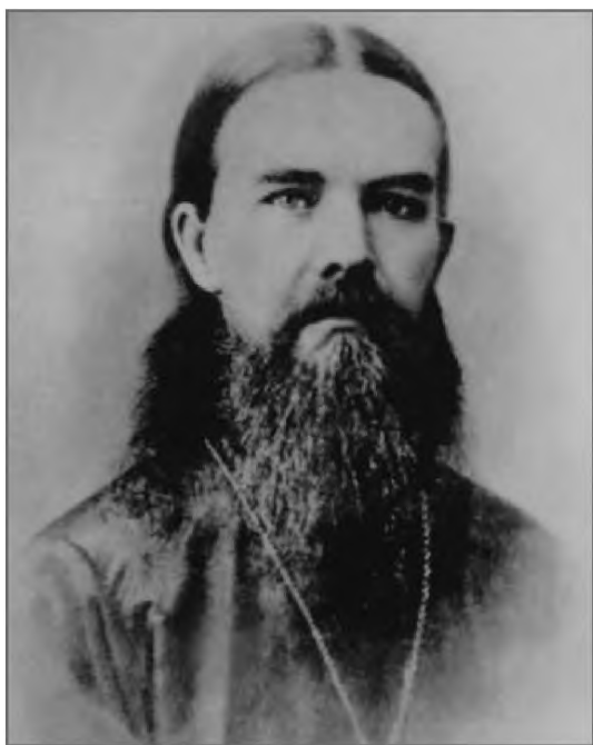
Портрет епископа Феофана (Горова)

Архимандрит Митрофан, как и его брат, был в постоянном духовном общении с владыкой Феофаном, ведя с ним переписку.