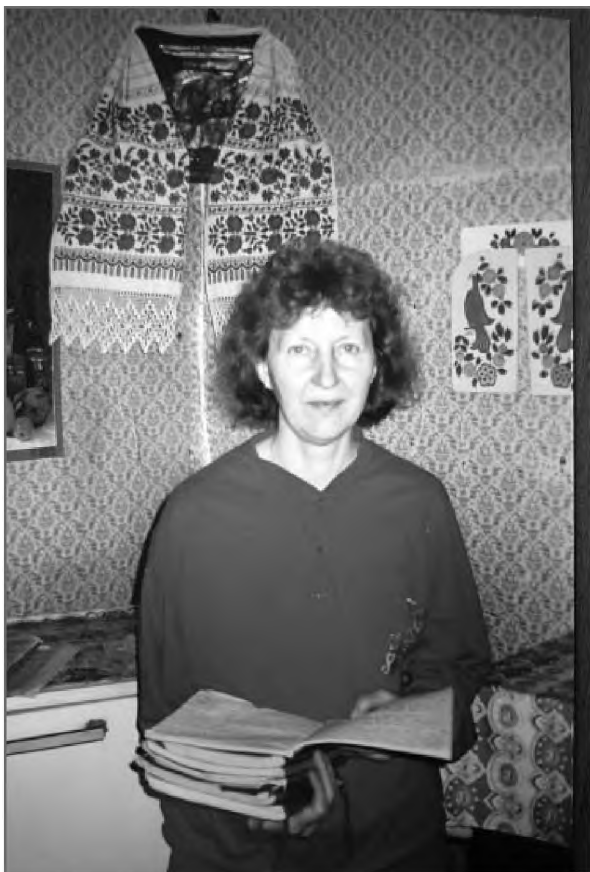
Вот сколько богогласников! (Полеская экспедиция 2010 г.)

первой православной книгой такого рода. Она целиком следовала уже сложившейся народной традиции, что и облегчило ей в дальнейшем колоссальный успех. Всего лишь через два десятка лет тиражи ее многочисленных изданий составляли до 100 тыс. экземпляров и распространялись на огромной территории всей Российской империи и в зарубежье.