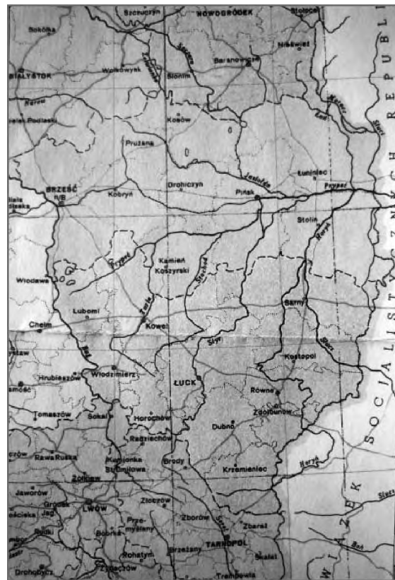
Западное Полесье в границах II Речи Посполитой (межвоенной Польши) на карте 1939 г.

знаменитой Почаевской лавре. Иван Франко считал этот почаевский «Богогласник» «наиважнейшим произведением червоно-русской культуры XVIII века, единственным существенным достижением униатским на ниве нашей культуры до времени Шашкевича». «Он интересен не только своим составом и своим смешанным языком, так как содержит песни, написанные на языках церковнославянском, южнорусском, приближенном к народному украинском, польском и латинском, но также тем, что много помещенных в нем песен перешло в уста народа и употребляется до сих пор не только во время разных праздников, как Рождество, Пасха и разных святых, но вошли также в репертуар лирников или поются в церквах в паузах богослужения и не только в униатских, но также в православных» 2 .