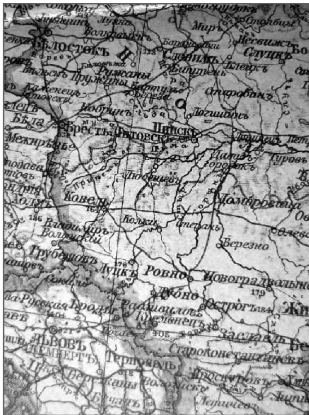
Западное Полесье в границах Российской империи на карте 1913 г.