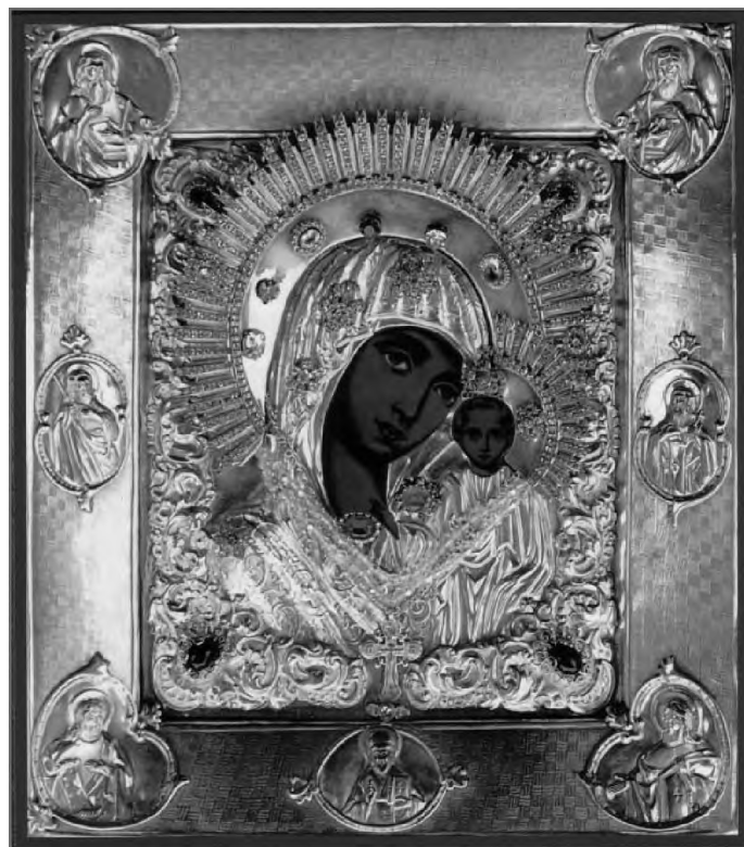
Икона Вышинской Казанской Божьей Матери