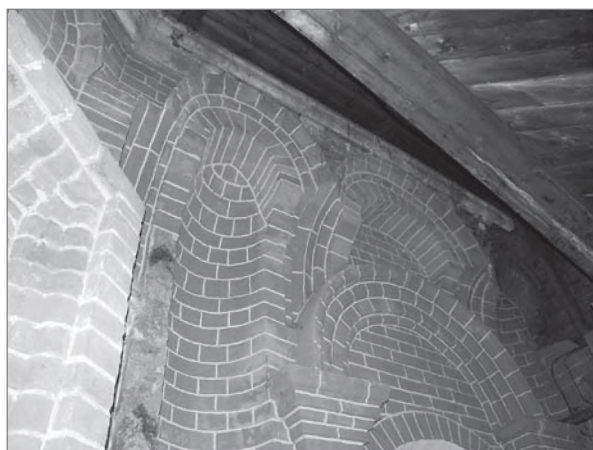
Храм Покрова на Рву. Карниз юго-восточного придела — под кровлей галереи

и приблизительно к тому же времени имеем основание приурочивать закладку Островской 2 . Тогда же он обратил внимание на сходство романского карниза четверика храма Спаса Преображения в Острове с карнизами двух восточных приделов храма Троицы и Покрова на Рву: «Весь сложенный из белого камня Островский храм <...> принадлежит XVI веку; <...> фряжские элементы в расположении и расчленении карнизов и высоких