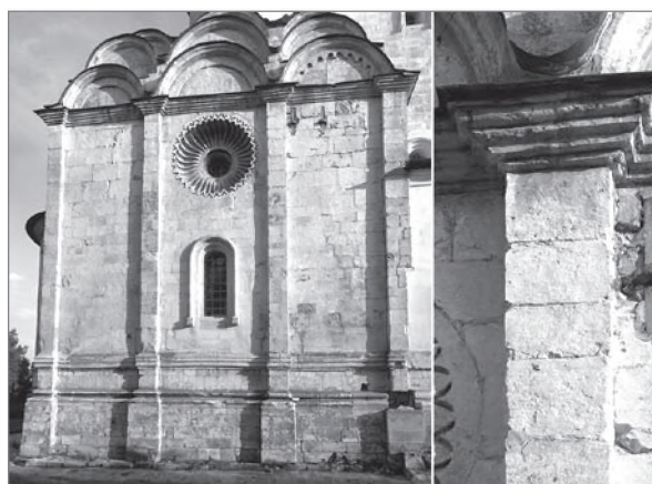
Никольский собор Антониева Краснохолмского монастыря (а) и придел Феодосия Великого храма Спаса Преображения в Острове (б) Сравнение ширины лопаток и профилей карнизов

лавры. <...> Из современников собора узкие лопатки имеют два северных монастырских собора — Ферапонтов и Кирилло-Белозерский, относящиеся также к последней трети XV в. Особенно показателен последний памятник, также отличавшийся большими размерами, массивностью и грузностью форм, отчего его лопатки казались особенно хрупкими» 32 .