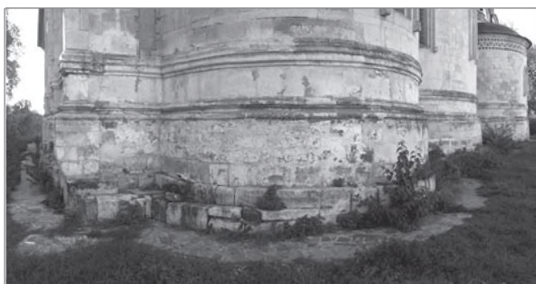
Храм Спаса Преображения в Острове. Юго-восточный угол

Или, иначе говоря, произошло нечто, заставившее на какое-то время прервать работы по строительству дворцового великокняжеского храма. А когда работы были возобновлены, произошедшие события привели к изменению самого замысла храма. Визуальный осмотр говорит о том, что главную ось храма после перерыва немного повернули по часовой стрелке, в результате чего юго-восточный угол южного придела стал нависать над заложенным ранее фундаментом, а северо-восточный угол северного придела, наоборот, отступил от края