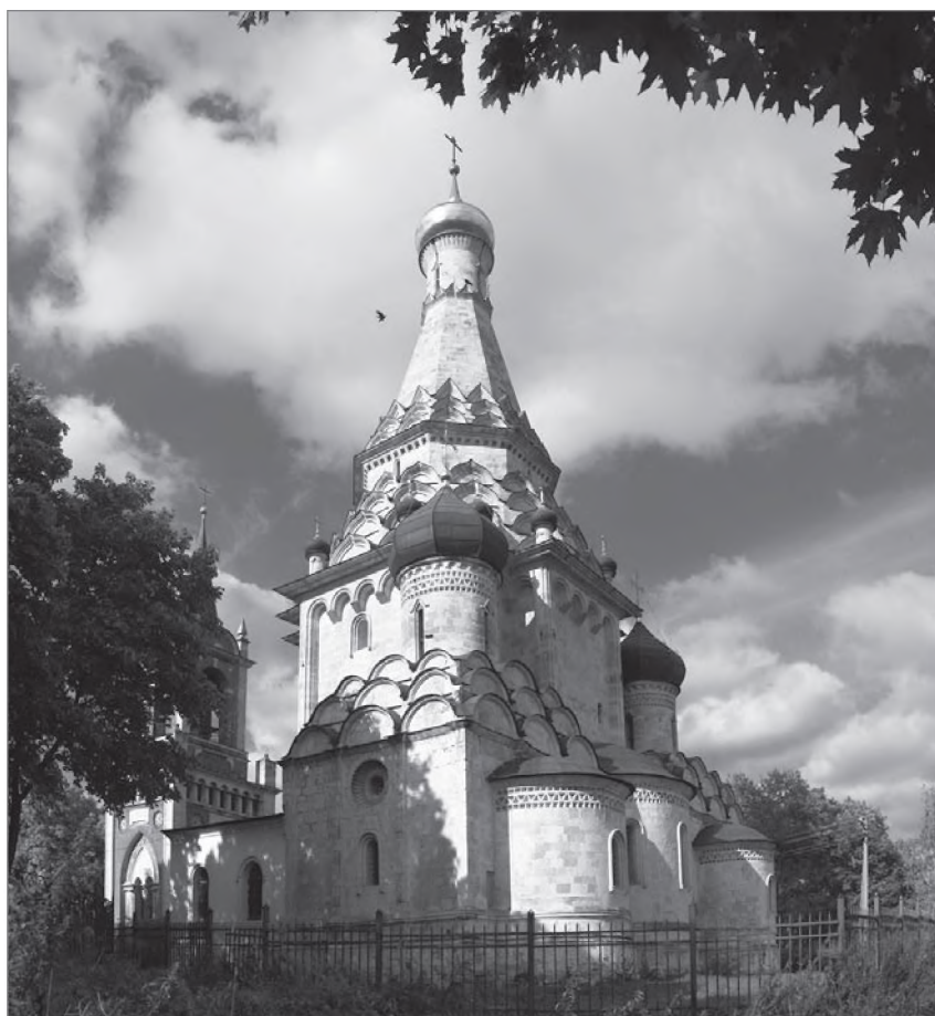
Храм Спаса Преображения в Острове. Вид с юго-востока

XVI века 1 . Этим же периодом атрибутирует его И. Э. Грабарь в «Истории русского искусства», изданной в 1910 г.: «Мы знаем с точностью только время постройки Коломенской