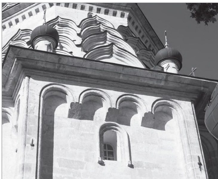
Храм Спаса Преображения в Остров. Карниз четверика

и приблизительно к тому же времени имеем основание приурочивать закладку Островской 2 . Тогда же он обратил внимание на сходство романского карниза четверика храма Спаса Преображения в Острове с карнизами двух восточных приделов храма Троицы и Покрова на Рву: «Весь сложенный из белого камня Островский храм <...> принадлежит XVI веку; <...> фряжские элементы в расположении и расчленении карнизов и высоких