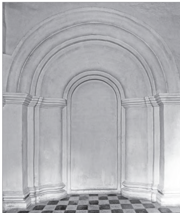
Храм Спаса Преображения в Острове. Портал