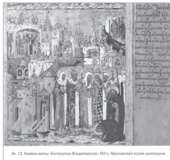
Владимирская икона. Прпп. Сергей Радонежский и Варлаам Хутынский и собор святителей

Праздник 21 мая первоначально был связан с памятью поновления Владимирской иконы в 1514 г. 16 Позднее его соотнесли с памятью