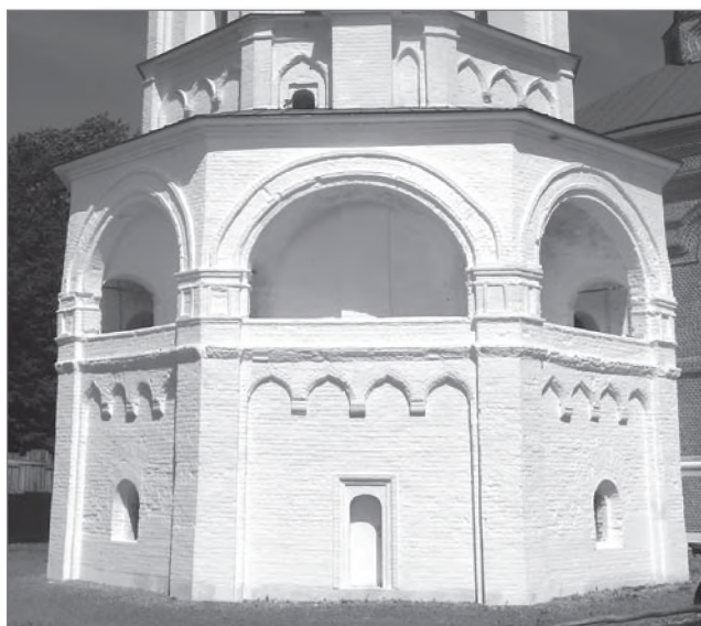
Богоявленская церковь-колокольня Николо-Пешношского монастыря, датированная А. В. Ягановым первой третью XVI-го века

Тема «романских» арок-машикулей под карнизом четверика храма в Острове могла быть навеяна также и подобными деталями в колокольне Ивана Великого. Построенная Бон Фрязиным в 1505–1508 гг., она послужила образцом для многих творческих разработок русских мастеров в первой трети XVI-го века — в Пскове (Вознесенская церковь-колокольня Снетогорского монастыря 1526–1527 гг.), в Новгороде (церковь-колокольня Григория Армянского в Варлаамово-Хутынском монастыре 1535–1536 гг.), в подмосковном Николо-Пешношском монастыре (Богоявленская церковь под колоколы, датированная