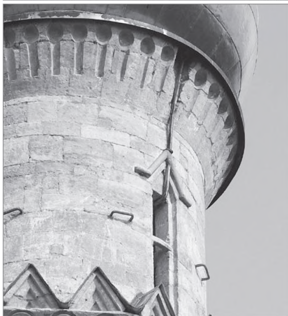
Капитель портала Никольского собора (а) и карниз главы Преображенского храма (б)

зов примерно с 1530-х гг. постепенно вытесняются классическим трехчастным карнизом (храмы Кирилло-Белозерского монастыря — Иоанна Предтечи и Архангела Гавриила, 1531–1534 гг.) Близкий к ним по архитектуре Никольский собор Угрешского монастыря, выстроенный заново на старом основании после упоминаемого разорения 1521 г., по стилистическим особенностям может быть отнесен уже к более позднему, по отношению к приделам храма в Острове, времени. Вл. В. Седов датирует Никольский собор 1520–1530-ми гг., и с этим нельзя не согласиться.