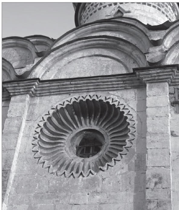
Храм Спаса Преображения в Острове. Окно