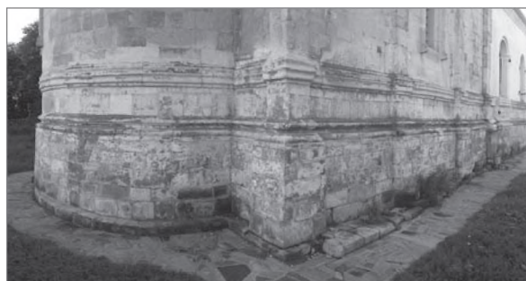
Храм Спаса Преображения в Острове. Северо-восточный угол