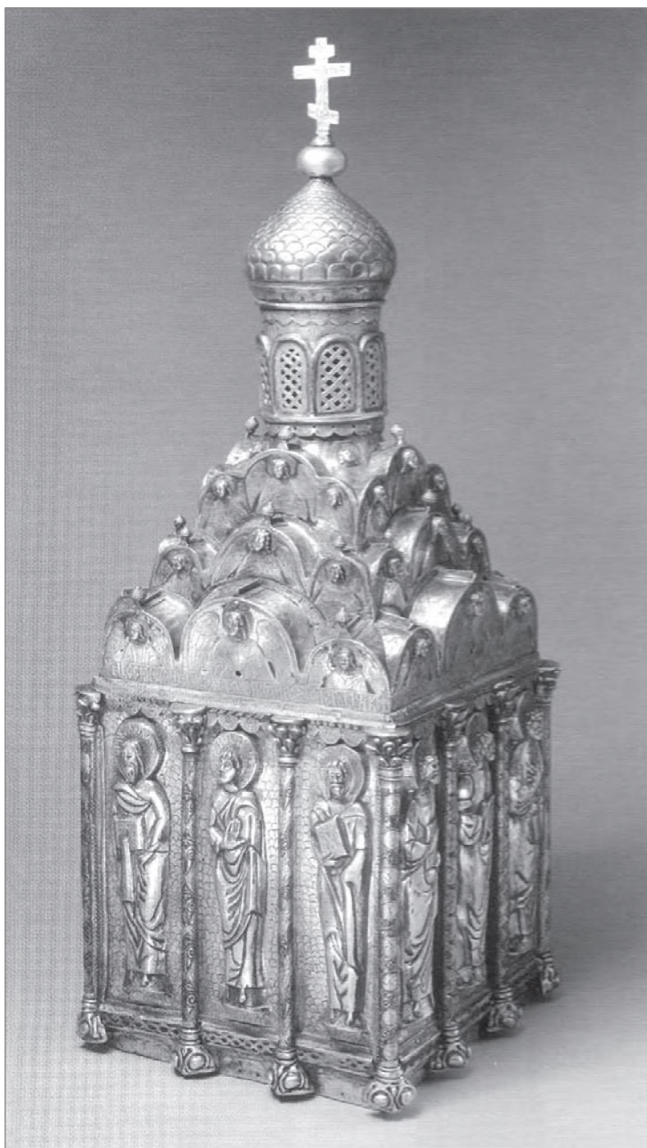
Малый Сион Успенского собора Московского Кремля. 1486 г.

Из четырех перечисленных соборов последней четверти XV в. лишь один — в Краснохолмском монастыре — имеет полукруглые закомары, появившиеся в нем, по-видимому, под впечатлением от только что построенного Кремлевского Успенского собора А. Фиораванти. И вот что особенно важно.