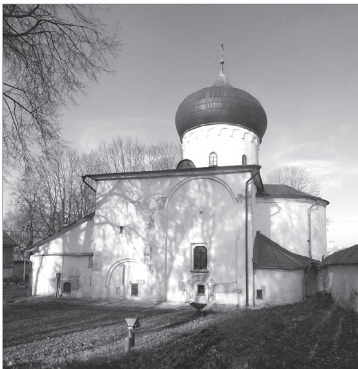
Спасо-Преображенский собор Мирожского монастыря в Пскове