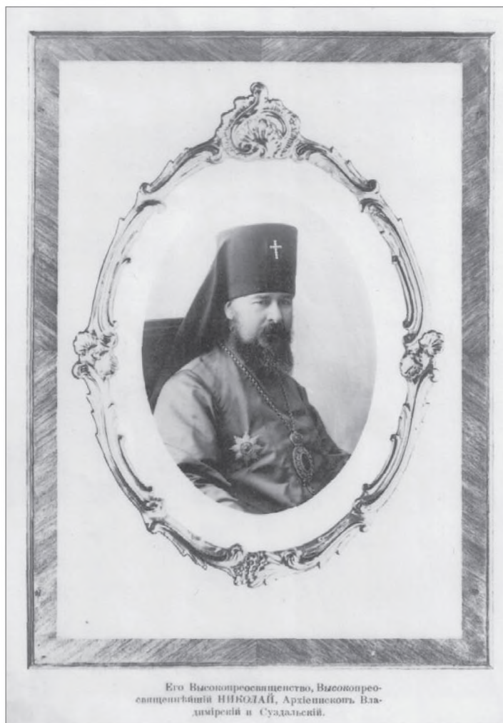
Николай, Архиепископ Владимирский и Суздальский, 1913 г.

«Порядок дня в семинарии был приурочен к учебным занятиям и мало чем отличался от училищного. В 7 часов утра звонок поднимал всех нас с коек, полчаса давалось на туалет, в 7 ч. 30 минут — утренняя молитва и чай, и в 8 ч. 30 минут шли в классы, уроки продолжались с 9 часов утра до 2 часов дня. В 2 часа дня — обед. После обеда и до 6 часов учащиеся были свободны и могли уходить по своим делам в город или просто на прогулку. В 6 часов вечера ворота запирались, дежурный надзиратель проходил по комнатам и производил поверку по списку, и семинаристы приступали к подготовке уроков на следующий день. В 9 часов вечера ужин и вечерние молитвы.