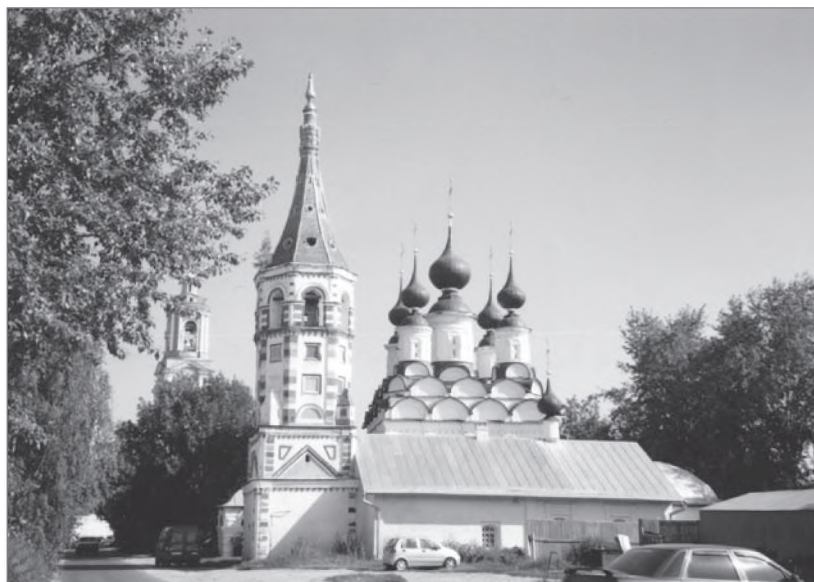
г. Суздаль, 2010 г. Церкви Святых Антипия и Лазаря

8. Ученик должен представить удостоверение в том, что он в течение трех последних недель не был болен заразною болезнью и не находился в общении с таковыми больными; если же он был одержим какою-либо заразною болезнью или приходил в соприкосновение с страдающими таковою, то какие меры были приняты для очищения