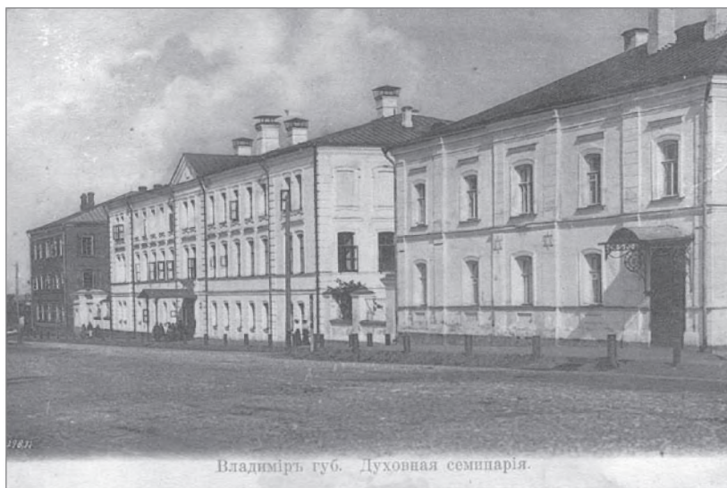
Владимирская Духовная семинария. Начало XX века

деятельности. Тысячи детей и юношей, в основном дети церковнослужителей, прошли через ее классы и бурсу, претерпевая в различные времена года голод и холод, всевозможные испытания, радости и горе. В первые десятилетия существования семинарии для многих это было очень тяжелое испытание, не все и выдерживали его. Большинство учеников было из беднейших семей сельских священников и причетников, часть была из сиротских семей служителей церкви. Большинство, пройдя все семинарские науки, становились приходскими священниками, менее способные или ленивые, не закончив учебы, возвращались «в первобытное состояние», т. е. возвращались в свои села, становясь бедными причетниками или даже сторожами сельских церквей. К началу XX века семинария превратилась в отличное учебное заведение с оборудованными классами, больницей, трехэтажным кирпичным общежительным корпусом, красивой семинарской Богородицкой церковью.