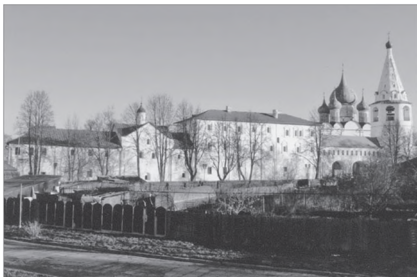
Суздаль, 2011 г., здание бывшего Суздальского Духовного училища