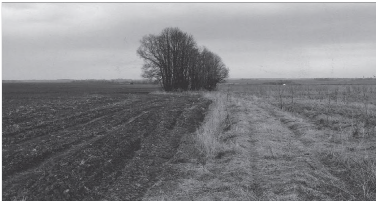
Место, где было село Жаворонково. Лето 2011 года