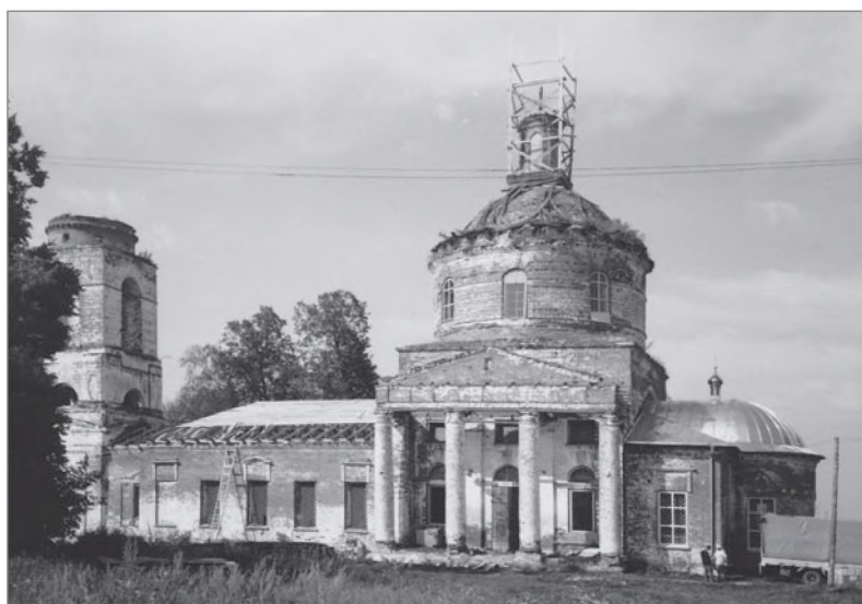
Церковь в с. Гришино, 2010 г.