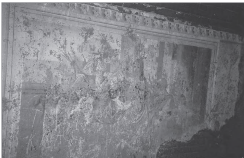
Фреска колокольни: «Вход Господень в Иерусалим». 2010 г.

ее отстояли. Она действует до сих пор, двухэтажная с четырьмя престолами, радуя красотой всю округу 25 .