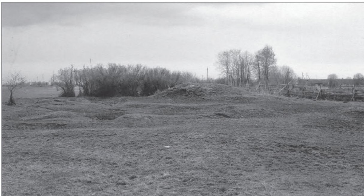
Село Дубровка, место где стояла церковь. Лето 2011 года

В настоящее время (2011 год, май) на месте села Жаворонкова и его церкви — распаханное поле. Село Жаворонково 15 ноября 1976 года исключено из списка населенных мест. В селе Дубровке — на месте двух каменных церк-