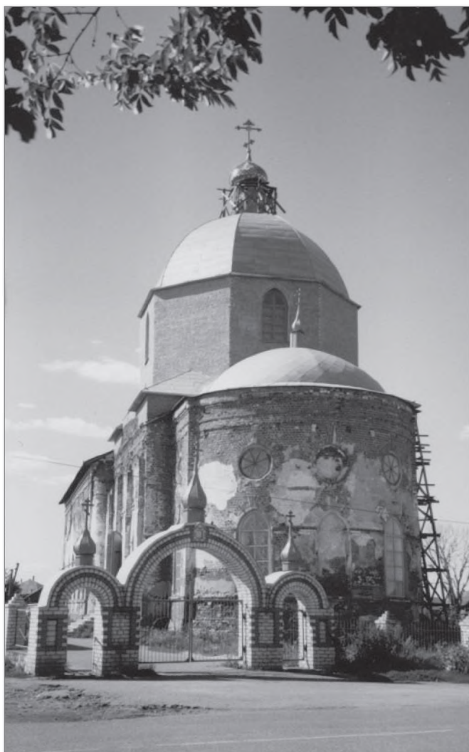
Церковь в с. Бутылицы, 2009 г.

«Село Бутылицы, при реке Унже, находится в 22-х верстах от уездного города и в 100 верстах от губернского. До 1764 года при Бутылицкой церкви существовал монастырь, известный под названием "Николо-Бутылицкой пустыни" и село Бутылицы образовалось из-под монастырской слободки. Основан был монастырь в XVI веке при церкви Николая Чудотворца; в старинных актах упоминается в первый раз в 1574 году <...>. В 1764 году с упразднением монастыря церкви монастыря обращены в приходские. Эти деревянные церкви существовали до 1835 года, когда вместо них был устроен каменный храм и с такою же колокольнею. Престолов в этом храме устроено было три: главный во имя Св. Николая Чудотворца, в трапезе во имя Св. порока Илии и Свв. мучеников Флора и Лавра <...>. Из святых икон особенно чтима прихожанами древняя икона Святителя Николая Чудотворца <...>» 65 . До 1917 года это был большой и богатый приход. «Причита по штату положено: 2 священника, диакон и два псаломщика. Дома у членов причта собственные на церковной земле <...>. Приход состоит из села