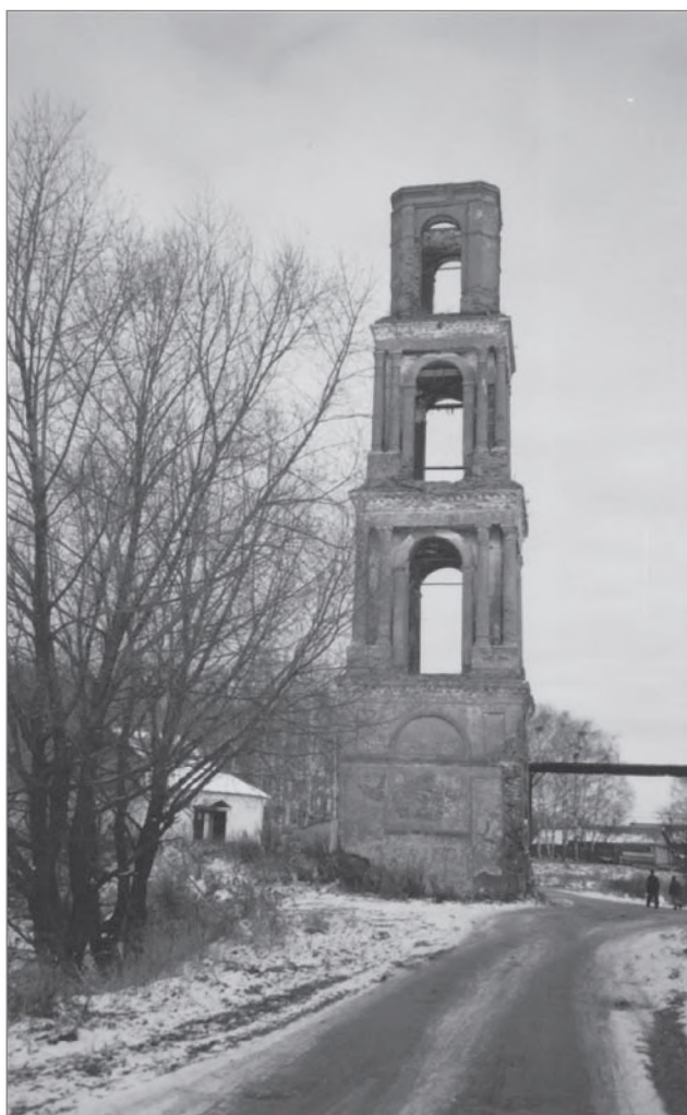
Колокольня церкви села Городище, 2010 г.