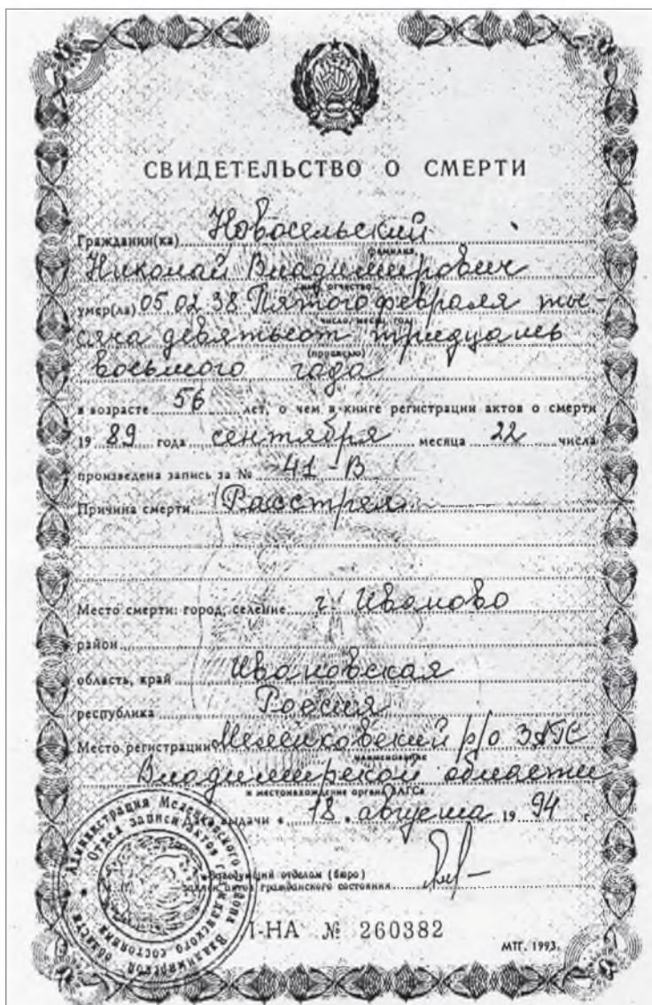
Свидетельство о смерти о. Николая, выданное в 1994 г.

Перед кладбищенскими воротами в 2000 году построен небольшой очень красивый храм с памятной доской при входе: «Сей храм в честь святых апостолов Петра и Павла заложен 20.04.1999 г. и освящен 12.07.2000 г. Архиепископом Иваново-Вознесенским и Кинешемским Амвросием при настоятеле игумене Никандре тицианием благочестивой