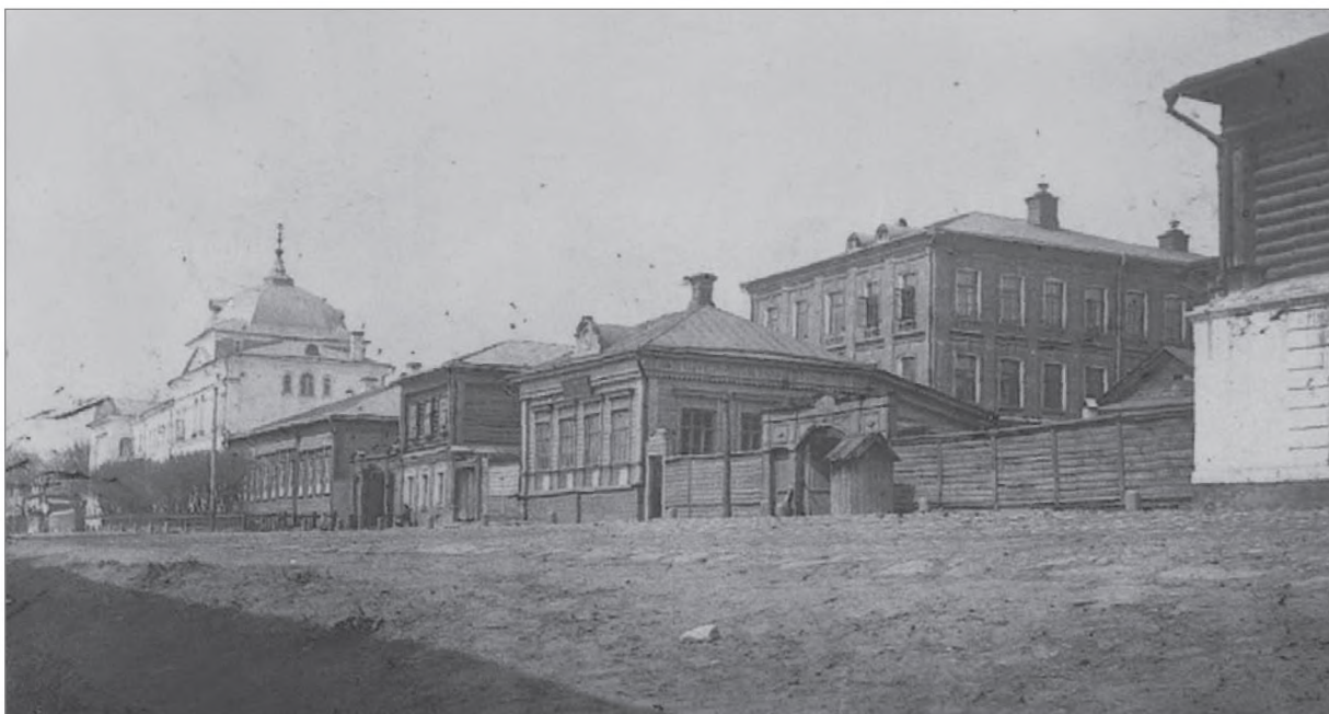
Владимирское епархиальное женское училище, 1902 г.

как его самого, так и бывших в его употреблении вещей (Пр. Медич. Сов. п.2)» 29 .