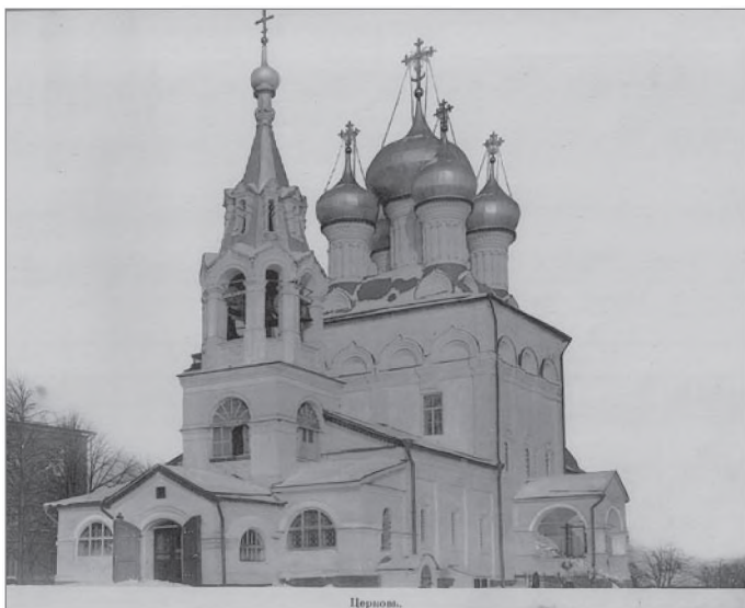
Богородицкая семинарская церковь, начало XX века

Все это проводилось по правительственным распоряжениям и вызовам.