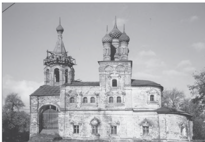
Троицкая церковь, с. Подолец, Юрьев-Польского р-на, 2010 г.

Село Подолец в старину принадлежало фамилии князей Милославских, многие из которых были погребены в этой церкви еще в конце XVI и начале XVII в.