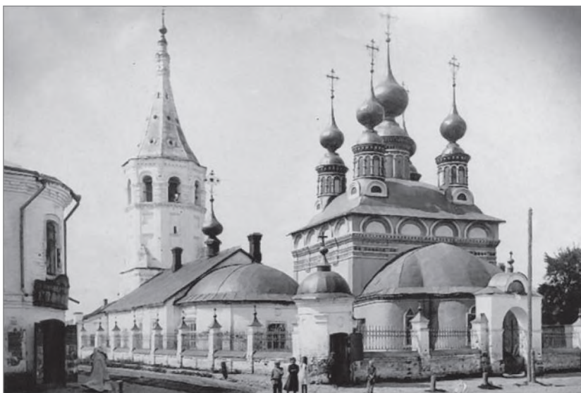
г. Суздаль, начало XX в. Церкви Святых Антипия и Лазаря

6. Во время отпуска ученик должен неопустительно посещать храм Божий в дни Воскресные и Праздничные и принимать участие в церковном пении и чтении, и во время отпуска в дни первой и страстной седмиц Великого Поста должен исполнять долг исповеди и Св. Тайн Причастия и о том представить от духовенства свидетельство (96 пункт устава Духовного училища).