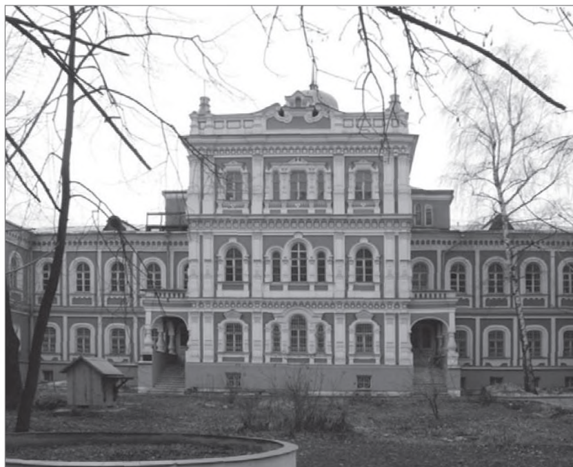
Путевой дворец Императрицы Елизаветы Петровны

Из архивного дела об устройстве Владычье-Покровской общины сестер милосердия в Москве видно, что оно начато 16 июня 1869 года «с изъяснениями мнения ея Величества видеть в нашем Отечестве развитие и утверждение духа христианского милосердия на тех основаниях, которые так успешно применены к общественным нуждам в С.-Петербургской Покровской и