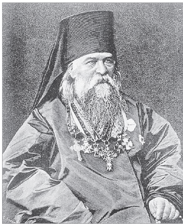
Архиепископ Игнатий (Малышев)

Обращение государства к Русской Православной Церкви было вызвано необходимостью в короткие сроки создать по всей России сеть сестринских епархиальных общин, способных обеспечить подготовку сестер милосердия, органично воспринявших православные духовно-нравственные ценности. Лечебные же учреждения создаваемых образцовых епархиальных общин сестер милосердия должны были оказывать бесплатную медицинскую помощь широким слоям