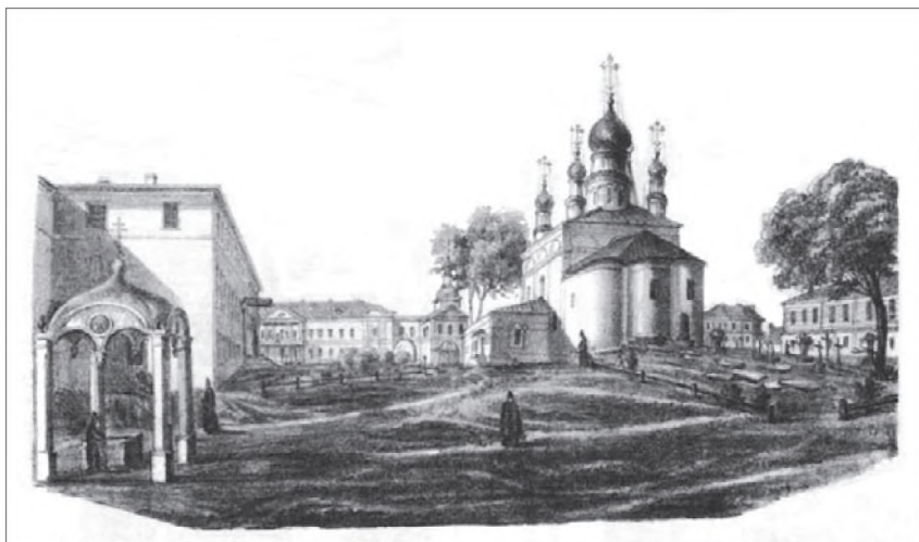
Вид Серпуховского Владычного девичьего монастыря с юго-восточной стороны из-за реки Нары. Рис. сер. XIX в.

в игуменьи Серпуховского Владычного монастыря» 11 . Как только она становится игуменьей, под ее началом оказывается 210 человек, при этом в монастырской кассе — «денег не оказалось». И тут сразу обнаружились ее организационно хозяйственные способности. В Серпухове она смогла в короткие сроки построить каменную часовню, новые дома семинарии и духовного правления.