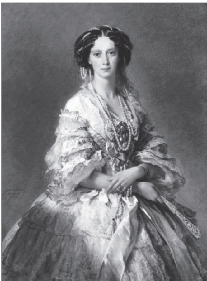
Императрица Мария Александровна