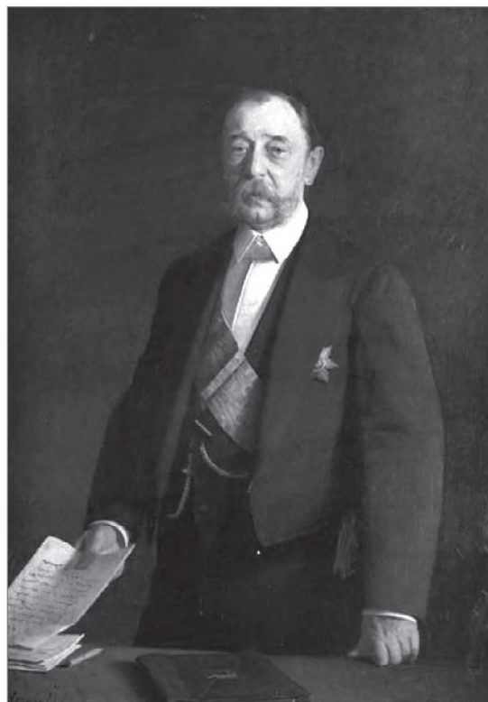
Граф Д. А. Толстой

Со времени открытия это учреждение успело получить и внешнее и внутреннее благоустройство, а вместе с тем и проявить в достаточной степени свое служение делу христианского милосердия. В Общине воспитывались «бесприютные» дети, начиная с самого младшего возраста, в ней безвозмездно подавали врачебную помощь