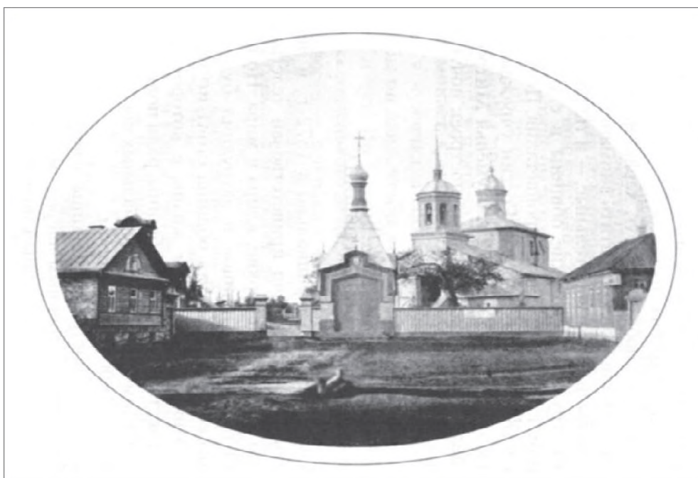
Иоанно-Ильинская община в Пскове

Позднее императрица Мария Александровна смогла воспользоваться опытом, приобретенным игуменье Митрофанией в С.-Петербургской общине, и стремилась в дальнейшем расширить поприще ее деятельности распространением полученного опыта на все российские епархии. Именно императрица Мария Александровна повелела игуменье Митрофании принять под