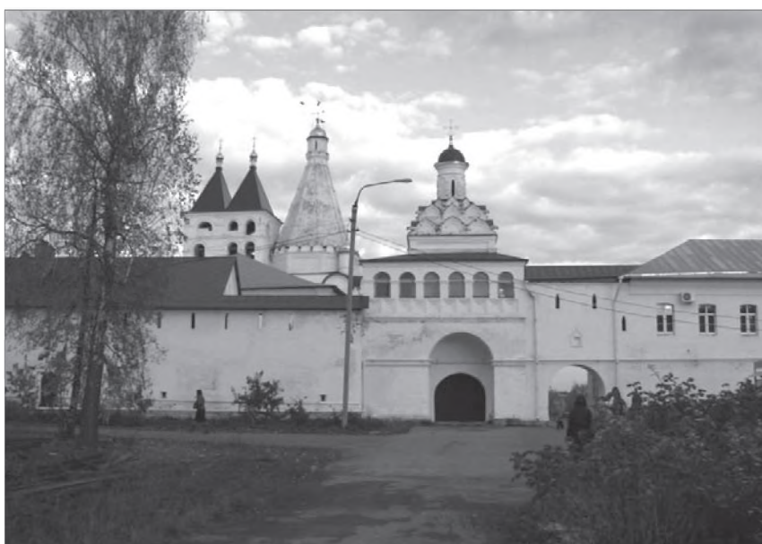
Серпуховской Введенский женский монастырь. Современный вид

сестер и для хозяйственных монастырских дел, устроила больницу с аптекою и открыла прием приходящих больных. При монастыре были созданы странноприимный дом; школа для 30 девочек, приходящих, но с получением от обители одежды, обуви и пищи; богадельня для