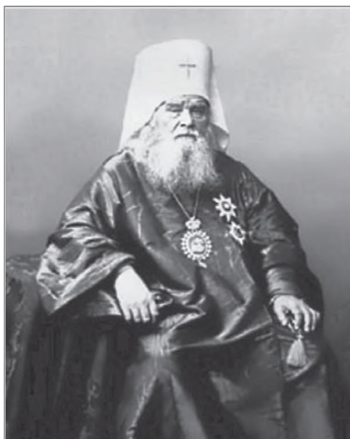
Митрополит Московский Иннокентий (Вениаминов)