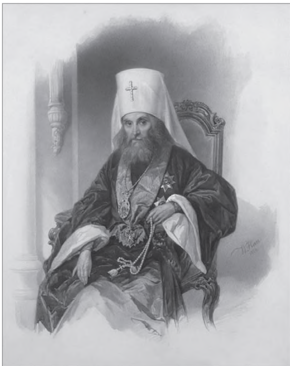
Портрет митрополита Филарета. 1854 г. Художник Владимир Гау

Будучи провидцем, митрополит Московский Филарет смог увидеть в будущем служении игуменьи Митрофании прежде всего служение страждущим, немощным, обездоленным и больным. 14 ноября 1857 г. монахиня Митрофания попала в Серпуховской Владычней монастырь, «куда давно уже стремилась». Впоследствии она вспоминала: «Я поместилась временно в келье рясофорной послушницы Зинаиды и занималась уходом за больными сестрами обители; от всех же прочих занятий я была освобождена. Таким образом, жизнь моя текла вполне согласно со стремлением души моей. Молитва в церкви сменялась занятиями по лечению больных и приготовлением для них лекарств или иконописанием. Забот по хозяйству не было, трапезою пользовалась общею, монастырскою. Так прошли четыре года...» 7