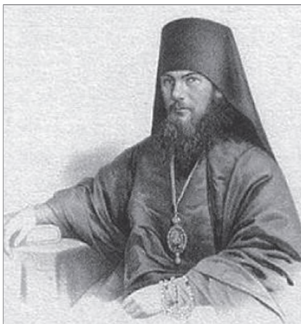
Епископ Дмитровский Леонид

19 ноября 1867 г. в Москве скончался митрополит Московский и Коломенский Филарет. Церковные иерархи и окормляемые митрополитом Филаретом его духовные чада тяжело пережили потерю близкого, дорогого своего учителя и покровителя. 5 января 1868 г. архиепископ Иннокентий был назначен митрополитом Московским и Коломенским. Замечательный подвижник Святитель Иннокентий (Вениаминов) становится достойным преемником митрополита Московского и Коломенского Филарета 14 .