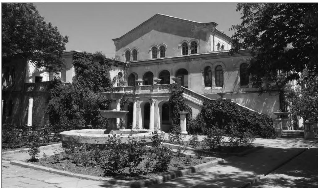
Херсонес. Византийский (итальянский или музейный) дворик

при моем отъезде из Тифлиса позволили мне написать о храме Пицундском, иначе я бы не смел мешаться не свое дело; сожалею только, что при самом начале, боясь обезпокоить особу Вашу, не прямо обратился к Вам из Керчи, как после того из Одессы, потому что, быть может, я бы удостоился получить столь милостивый для меня отзыв, как и теперь. Если же Вашему Сиятельству угодно будет спросить в г. Начальника Главного Штаба мою записку о необходимости обновления храма Пицундского для просвещения Абхазии и о средствах к избежанию лишних издержек,