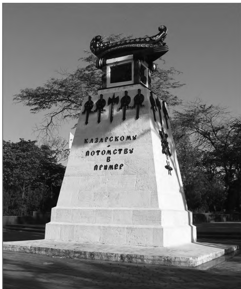
Севастополь. Памятник А. И. Казарскому. Проект А. П. Брюллова. Открыт в 1839 г.

церквей, воздвигнутых во имя Св. Просветителя, здесь же общая и единственная цель состоит в том, чтобы ознаменовать самое место нашего просвещения, которое нам дорого, не только по одному месту крещения Владимира, и по другим не менее священным воспоминаниям. // Здесь первый просветитель Руси Св. Апостол Андрей 16 , обходя берега Черного моря, чтобы идти водрузить крест на горах Киевских, пристал к Херсонесу, и долго показывали на пристани стопу его, из кото-