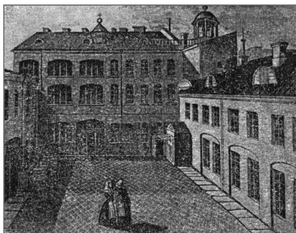
Двор дома общины сестер милосердия