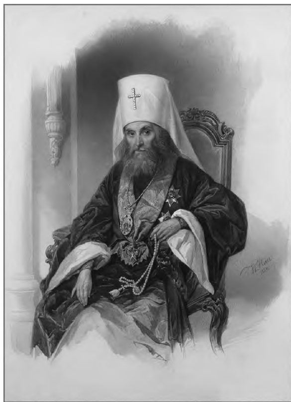
Портрет митрополита Филарета. 1854 г. Художник Владимир Гау

Возвращение Елизаветы Алексеевны Кублицкой в общину, как мы указывали, произошло именно потому, что в ее судьбе и судьбе С.-Петербургской общины сестер милосердия принял активное участие митрополит Мос-