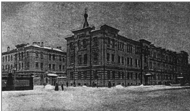
Здание Свято-Троицкой общины сестер милосердия в С.-Петербурге

Говоря об истории общины, нельзя не вспомнить о семье принца Ольденбургского, все члены которой так или иначе были связаны с ее деятельностью. Община была создана на средства и при активном участии принца Петра Георгиевича Ольденбургского (1812—1881 гг.). Его жена принцесса Тереза Васильевна Ольденбургская (1817—1871 гг.), не только стала одной из учредительниц общины, но и вместе с сестрами милосердия принимала участие в дежурствах при постелях больных. К делам благотворительности родители привлекали и своих детей. Будучи ребенком, великая княгиня А. П. Ольденбургская участвовала в пошиве белья для Свято-Троицкой общины. Когда дети выросли, они продолжили дело родителей. «Долг совести, — писала позднее великая княгиня А. П. Ольденбургская, — повелевает все отдать, что имею, к осуществлению моего идеала. Я с детства была близка к больным, их любила, видела пример моих незабвенных родителей,