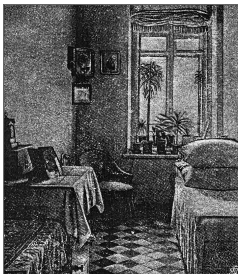
Комната сестры милосердия

По уставу сестры не должны были иметь ни собственной одежды, ни мебели, ни собственных денег. «Все, что может сестра за свои услуги получить подарками или деньгами, — говорилось в Уставе, — принадлежит Общине». В уставе был учтен и такой случай, к чести общины не имевший места за всю ее историю, когда начальство общины вынуждено исключить сестру милосердия из общины. Церемония снятия с провинившейся сестры данного ей знака отличия должна была служить «назидательным напоминанием святости принимаемых ими на себя обязательств».