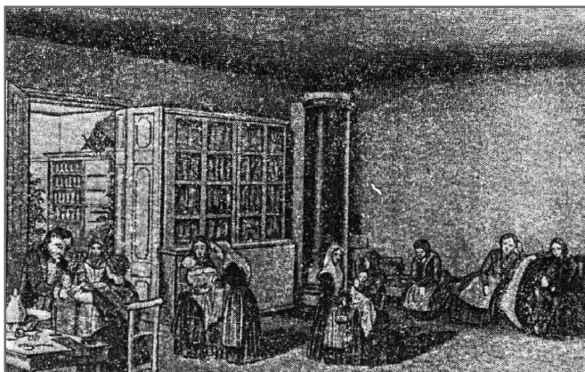
Приемная для больных при аптеке общины сестер милосердия

воспитании их придавалось важное значение. Главная мысль, положенная в основу создания первой общины сестер милосердия, заключалась в следующем: служение сестер милосердия страждущим, болящим, а также воспитание сирот и нравственное обновление падших людей — все это многотрудное дело невозможно без личного подвига, который возможен только во имя любви к Богу и ближнему, если человек отдает себя всецело, бескорыстно и беззаветно. Согласно уставу, в общину принимались вдовы и девицы всех сословий, от 20 до 40 лет «без различия вероисповедания» (с 1855 г. была сделана поправка: в общину принимались только православного вероисповедания). Перед тем, как принять звание сестры милосердия, давался годичный испытательный срок. В первом отчете общины сестер милосердия сказано: «Сестры Милосердия, служащая больным, имея присмотр за детьми и по очереди исправляя все обязанности, возлагаемые на них званием Сестры, находятся до сего времени на испытании» 1 .