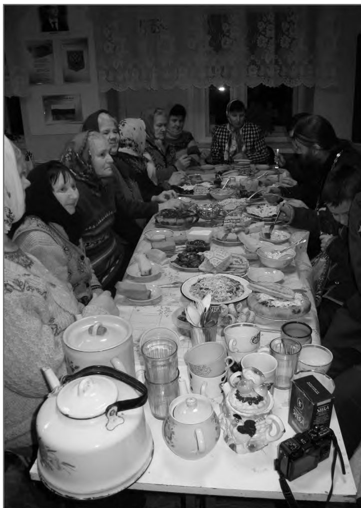
Приходская трапеза после праздничного богослужения. С. Печниково Каргопольского р-на Архангельской обл.

В советский период православные праздники были чуть ли не единственным проявлением общественной религиозной жизни в деревне. Их всегда помнили и почитали, хотя многие из них принадлежат подвижному кругу христианского календаря и определяются непросто, отсчитываясь от Пасхи. В передвижном цикле православного календаря, воспринятом от старших, в устном предании, и сегодня ориентируются прекрасно: знают, как высчитывается день Вознесения, Троицы и пр. Празднование часовенных дней никогда не прерывалось: «Все равно мы эти праздники отмечали — стары-то: и Рождество, и Крещение, и Новый год старый — тоже называли выходным. И Паску — у-у, это первый праздник. И Покров, и Духов день — в нашей деревне празднуются». Продолжали посещать уже закрытые