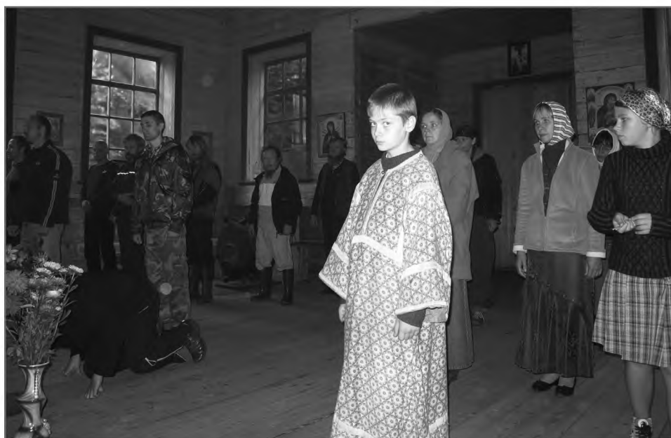
На Литургии в церкви прп. Лазаря Муромского в одноименном монастыре

Обычай требовал, чтобы приходили в храм в особой, праздничной одежде: прежде женщины нередко надевали традиционный народный костюм (хотя в обычной жизни его уже не носили), мужчины — специально для этого предназначенные костюмы и сапоги. В советское время нормой стала бóльшая, чем прежде, скромность и сдержанность в нарядности костюма. Большое внимание уделялось головному убору женщин: платок аккуратно завязывался под подбородком или на затылке. Обувь должна быть целой и чистой: порой в храм шли в лаптях или босиком, но перед входом ноги мыли, лапти снимали, надевали сапоги или ботинки. По возвращении все тщательно чистилось и убиралось до следующего раза или праздника. В храме было положено соблюдать серьезность и сосредоточенность, особо не глядеть по сторонам, не переходить без нужды с места на место: «ведь затем в церковь все и ходят: прийти, помолиться и отстоять обедню» (в буквальном смысле: отстоять на одном месте). Благопристойность и серьезность требовались и от детей, их напутствовали: «чтоб не плясать в церкви».