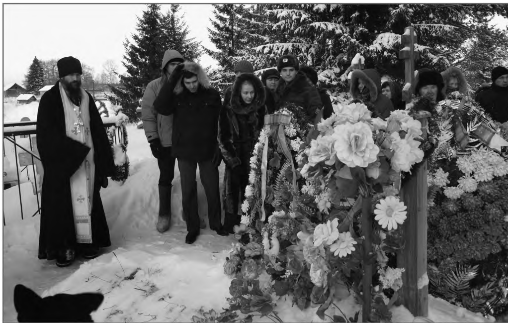
Панихида на кладбище в день памяти прихожанки. С. Река Каргопольского р-на Архангельской обл. Январь 2009 г.

Усопших поминуют и дома. Одна из старушек-северянок ежедневно поминала всех умерших в своей деревне: она мысленно переходила из