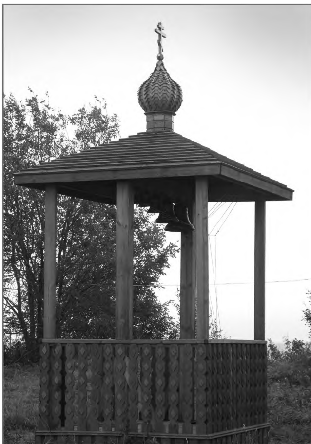
Звонница в Муромском монастыре