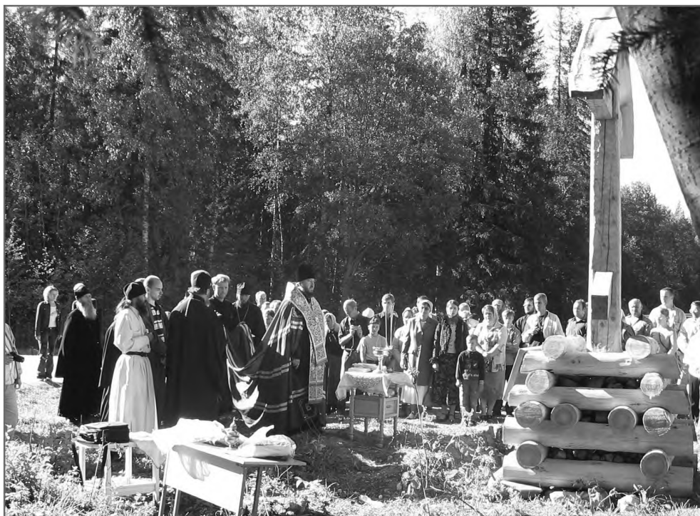
Освящением епископом Архангельским Тихоном поклонного креста у поворота на Кирилло-Челмогорский мужской монастырь. 2001 г.

терпимы, и им свойственно уважение к сану; как заметил священник-северянин, «люди перестают материться, когда я иду по улице в рясе».