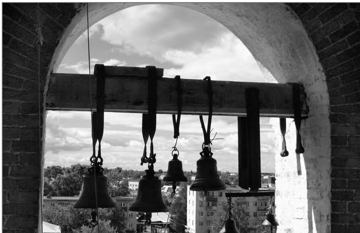
На колокольне Успенского храма г. Вышний Волочек.

кола и подвесили свечи, и удумали проходить. Кто пройдет, колокола сами зазвонят, свечи загорят, тот будет царем» 55 .