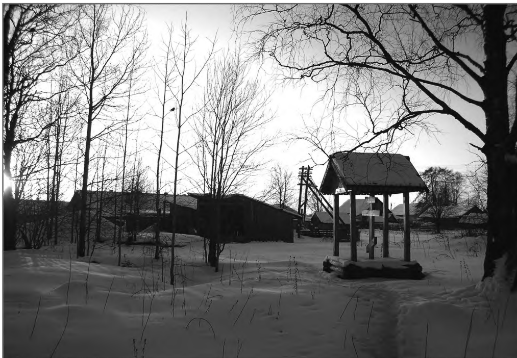
Вид на крест на месте сгоревшего храма свв. Космы и Дамиана. С. Печниково Каргопольского р-на Архангельской обл.

так это... Разве в этих кумполах (показывает на голову. — Г.М.) был начальник?» Осознаются свое недостоинство и малое знание; одна из поморок так и сказала: «Господа не понимаю. Вот построят церковь — буду учиться. Только Господу верить начинаю» 27 . И сегодня всеми осознается важность таинства причастия и тщательной подготовки к нему. Жительница с. Монастырщина (Кимовский р-н Тульской обл.) размышляла: «Здесь раз причащали. Так сама говорю: ну что ж, я же не знала, что он <священник> придет. Надо же поговорить. Не готовилась. Все причащались, и я. Может, мою Господь не принял <жертву>, а просто обиделся: ну куда, свинья — и все». Другая женщина, постясь и готовясь к причастию, не дерзнула подойти к святой чаше, потому что накануне поругалась с сыном.