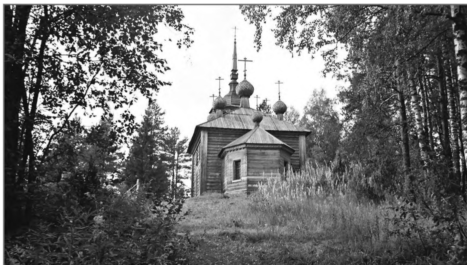
Церковь прп. Александра Свирского на Хижгоре. Современное фото

На Руси храмы исстари были главными военными мемориальными памятниками, поэтому особое духовное звучание получали церкви, связанные с важными эпизодами русской истории и ее выдающимися персонажами. В ходе своего