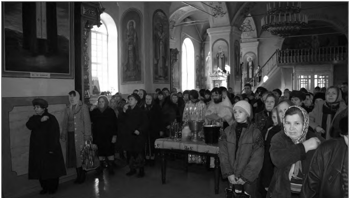
Молебен после Литургии в Знаменском храме. Г. Борисоглебск Воронежской обл. 2008 г.

О-о, милая моя дочка, волосы дыбом вставали. Кто понимает. <Тот,> кто не понимает...» Другая прихожанка (из с. Полибино Липецкой обл.) отзывается о значении для нее богослужения: «Выходишь из церкви, как будто на... Я все забываю домашнее, все это — откладываю печение, понимаете» 21 . Богослужения — сегодня потребность многих; члены актива Покровской церкви с. Щеглятьево (Лотошинский р-н Московской обл.) рассказывают: «Мы горячо верили, что нам помогут все добрые люди. И мы не ошиблись. Ведь восстановление этого храма не только потребность нашей души и сердца, но и всех рядом живущих людей. Все нуждаются в общении с Богом, всем нужно духовное общение». Многие внимательные наблюдатели отмечают, что с открытием храма меняется сама атмосфера в деревне. «Как зазвонит колокол в храме, по всей округе его слышно! Тут и прихожане потянулись, — рассказывали в приходе той же Щеглятьевской церкви. — <...> Расцвела наша деревня, ожила с возобновлением службы в храме. Веселее стало жить не только нам, старич-