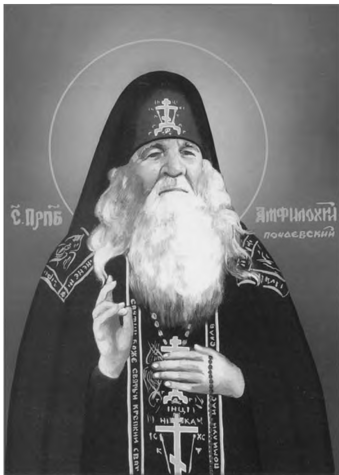
Преп. Амфилохий Почаевский. Икона

случае осознавали, что в мазь, которую старец «варил сам из меда, воска и масла и давал людям от белокровия, рака, экземы и прочих болезней», была «заложена сильная молитва» 17 .