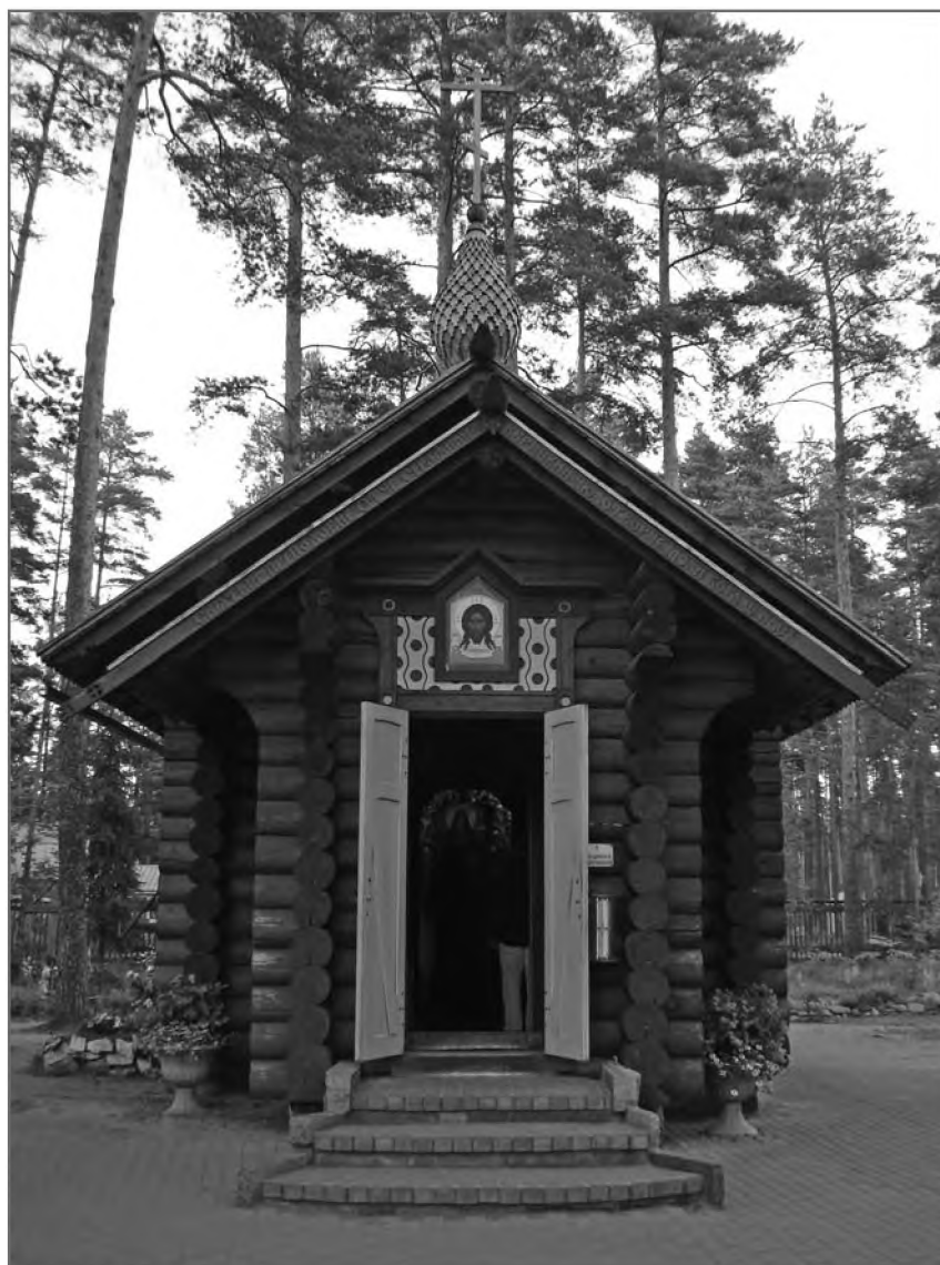
Часовня на месте погребения Серафима Вырицкого.

некоторые внешние аспекты этой проблемы, проявляющиеся в конкретных судьбах и ситуациях.