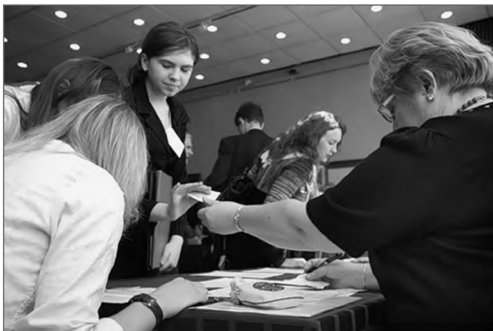
I-й Всероссийский конкурс юношеских исследовательских и проектных работ по историко-церковному краеведению

Существенный потенциал развития и повышения качества содержания работ имеется в обращении к исследованию современной приходской жизни, реальным людям, составляющим приход — священно- и церковнослужителям, активу, прихожанам, жертвователям, учителям воскресных школ, участникам других направлений деятельности. Здесь — обширное поле работы для самостоятельных изысканий. Важным является изучение советского времени — сложного периода, в котором было много трудных ситуаций.