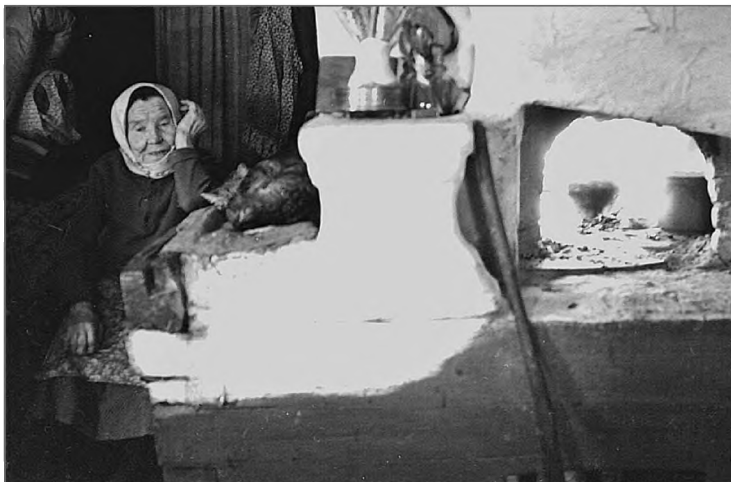
Одинокая старость народного мастера

важаю и своего дорогого гостя. Грибов набрала. Ягод сей год было много — тоже набрала. Картохи тоже много.