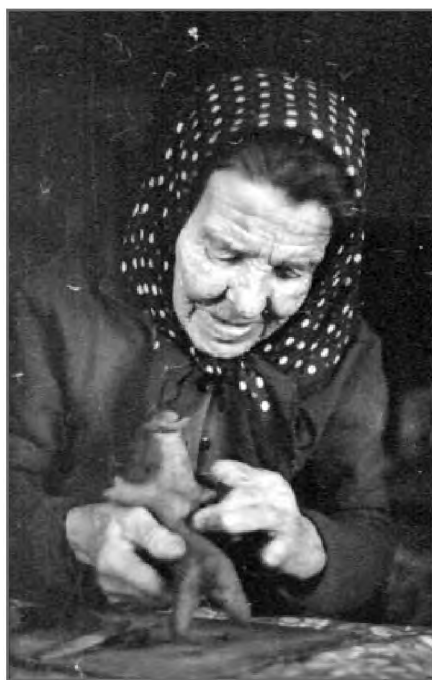
Мастер лепит игрушку. Март 1972 г.

вила, что «в эту будку» не пойдет! Там и дров некуда положить, и пол «худой». (А морозы в те времена в Каргополье случались за минус сорок.) «И с игрушками придется кончать», — грустно заметила она.