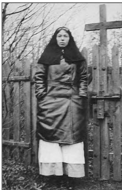
Великая княгиня Ольга Александровна. Фото времени Первой мировой войны

украшали панно, изразцовый фриз, каминные полки из поделочного камня. В комнатах висели ковры, изготовленные в Рамонской кустарной ковровой мастерской 21 . Дворец был готов, а совместная жизнь молодоженов не складывалась. Брак оказался неудачным. Принц Петр Александрович, который был на 14 лет старше жены, оказался человеком бесхарактерным, азартным картежным игроком. Брак этот не повлек за собой рождение семьи с радостями материнства и домашнего уюта. Это разочаровало Ольгу Александровну. В 1903 г., будучи на параде в Павловске, она повстречалась с Николаем Александровичем Куликовским, офицером, служившим в Лейб-гвардии кирасирском Ее Величества полку. Это была любовь с первого взгляда. Вели-