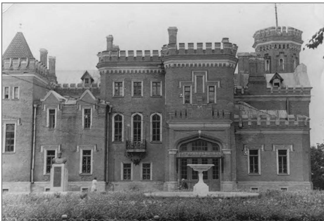
Дворец принцессы Е. М. Ольденбургской. Дореволюционное фото.