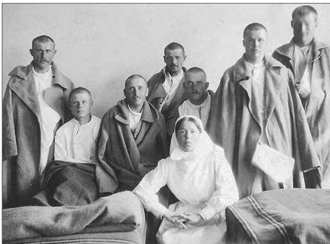
Великая княгиня Ольга Александровна в госпитале в годы Первой мировой войны.