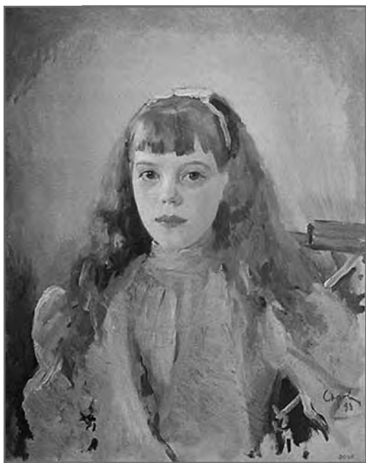
Великая княжна Ольга Александровна. Портрет В. А. Серова.

двумя манежами для выездки лошадей, дом управляющего имением и дома для рабочих усадьбы. От дворца по береговому склону распланирован Нижний парк, переходящий в лесной массив. Красивая парковая лестница, ведущая к гроту с фонтаном и несколькими видовыми площадками, спускалась к реке и комплексу сахарного завода.