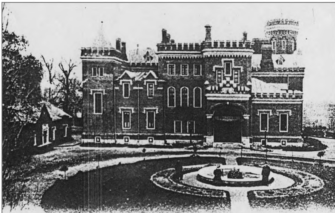
Парадный вход дворца принцессы Е. М. Ольденбургской. Дореволюционное фото.