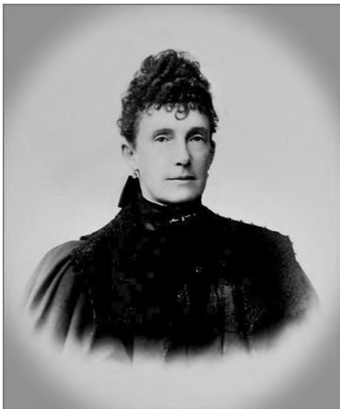
Принцесса Е. М. Ольденбургская