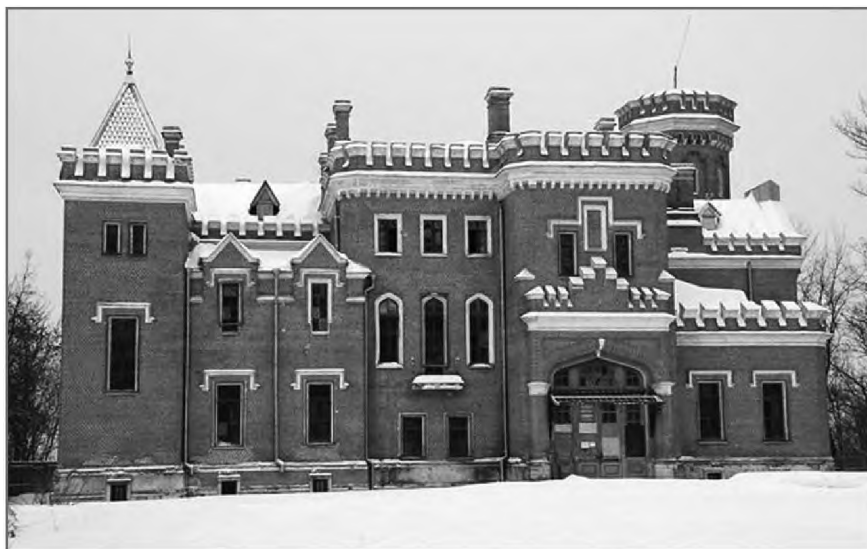
Дворец принцессы Е. М. Ольденбургской. Современное фото

В 1902 г. отделка дворца была закончена. Нарядная мраморная лестница, театральная зала, приемная принца, гостиная из бледно-розового дуба веером, малая белая гостиная, спальни, кабинеты — все отличалось изяществом отделки. В помещениях были расписаны плафоны, стены