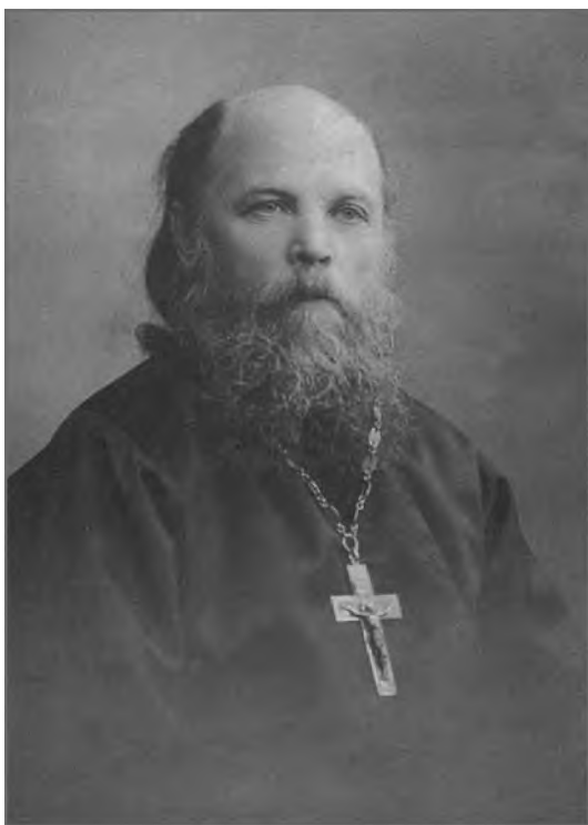
Святой праведный Алексей Мечев

уехать, а на кого Россию оставляют? Ничего не страшитесь, Владыка, Вы нужны России, Вы будете Патриархом всея Руси и будете править 25 лет» 3 . Новый визит состоялся в 1944 г., после снятия блокады (владыка Алексей был в то время митрополитом Ленинградским). Повторилось и предсказание: «Ты будешь Первосвятейшим Московским в течение двадцати пяти лет, как твой небесный покровитель» 4 .