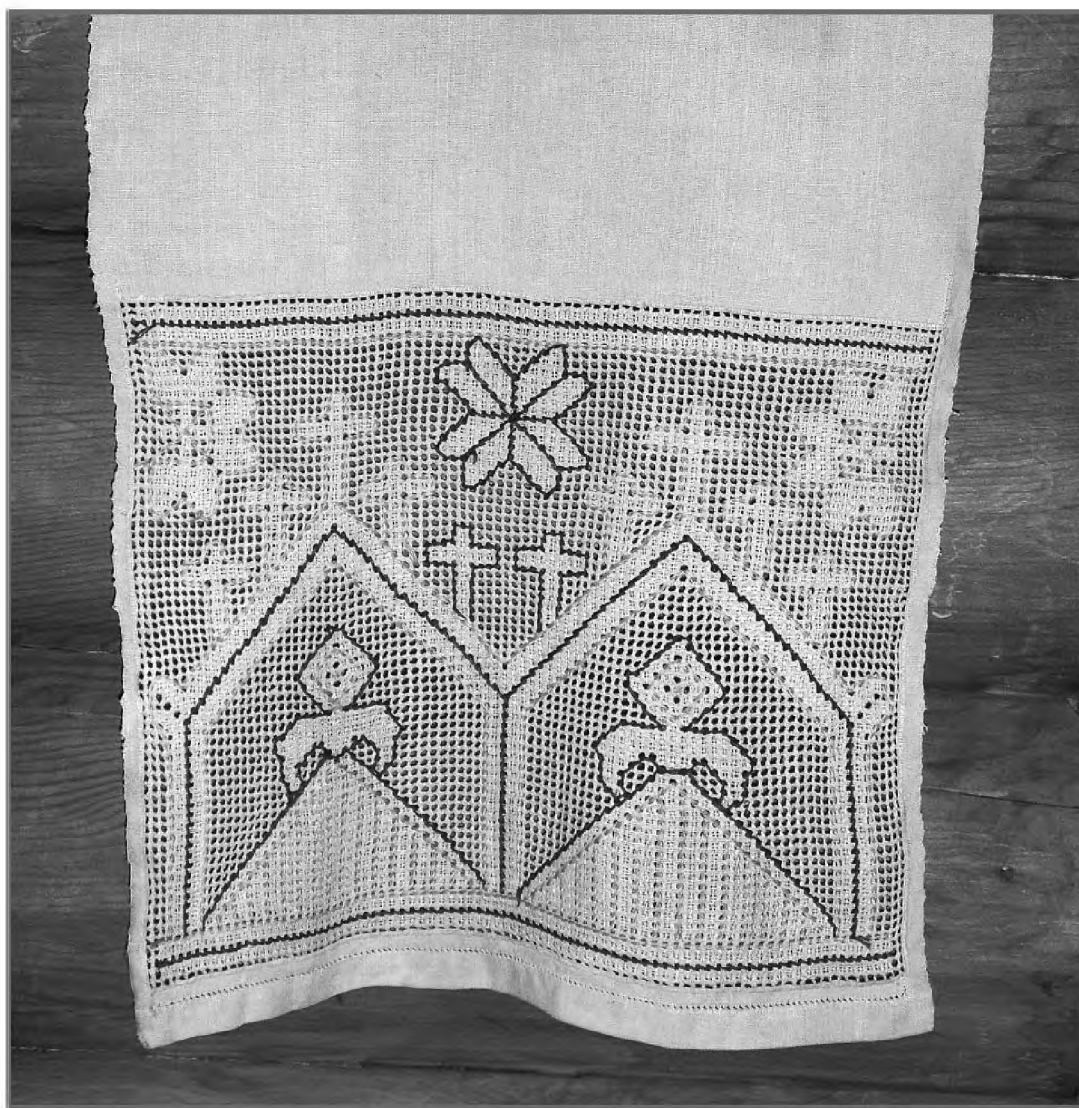
Полотенце в технике белой перевити с вышитыми христианскими символами. Северная Бараба, конец XIX — начало XX в. Фото автора

Тагильцевой (1905 г.р.). По белому фону вышиты красными льняными нитками швом «вперед иголку» многочисленные поперечные узоры. Ближе к центру расположен ряд фигур в виде трех шестиугольников, состоящих из мелких красно-белых квадратов; ниже две красные тканые полосы отделяют изображение трех храмов с крестами на куполах, вышитых красными нитками, между которыми помещены два дерева; далее между последующими четырьмя полосками повторяются вышивки первого типа в виде геометрической