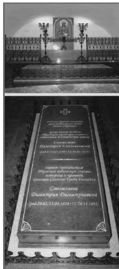
Усыпальница Смышляевых 2008 г.

Председатель Палестинского общества великий князь Сергей Александрович замечал по этому поводу: «Если здоровье Д.Д. требует, пусть едет на год, на два лечиться, но я не хочу терять надежды видеть его опять в Иерусалиме уполномоченным Общества» 40 . В рескрипте общества от 6 июля 1889 г. Сергей Александрович писал: «Прошу Вас сохранить звание уполномоченного Императорского Православного