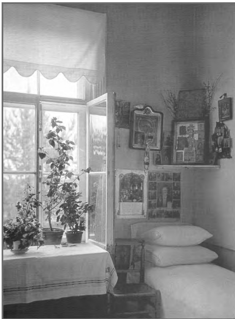
Одна из комнат для призываемых в богадельне Алексеевского общества дел милосердия (1900—1910-е).

24 марта 1907 г. Главное управление по делам местного хозяйства уведомило Совет общества, что по Высочайшему повелению от 23 марта,