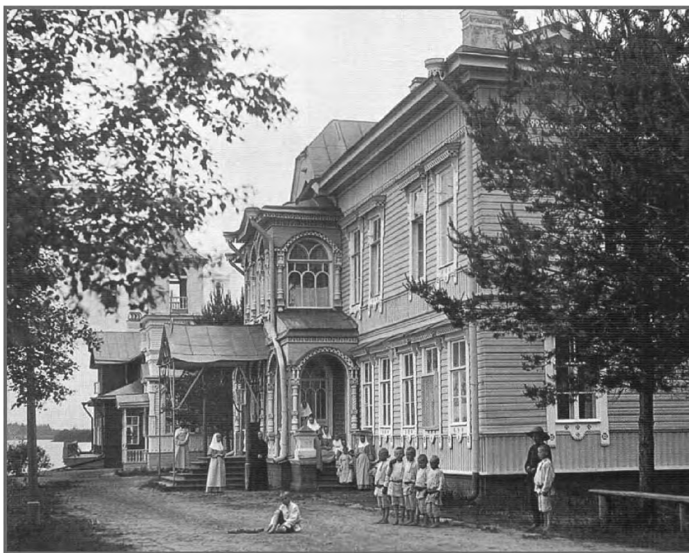
Группа детей и медицинский персонал у здания больницы Алексеевского общества дел милосердия (1900–1910-е).

клинике Императорской Военно-медицинской академии. Свидетельство тому — вышедшие с 1906 по 1915 г. девять томов «Трудов госпитальной хирургической клиники профессора С.П. Федорова». В них публиковались и завершённые научно-исследовательские работы, и фрагменты диссертаций учеников Сергея Петровича.