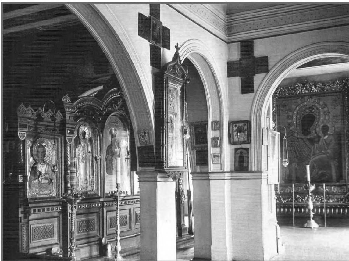
Один из пределов Успенского храма Алексеевского общества дел милосердия (1900–1910-е).

Реконским, оказывал помощь великой княгине Александре Петровне в устройении благотворительных учреждений Киево-Покровского женского монастыря.