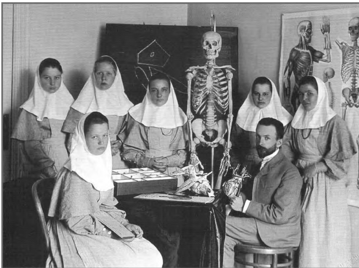
Занятие по анатомии с сестрами милосердия в Алексеевском обществе дел милосердия (1900–1910-е).

По распоряжению императора Николая II Алексеевскому обществу дел милосердия передавались все богоугодные заведения Успенского острова и Вындин остров. Кроме того, 1 сентября 1903 г. Николай II «Всемиловитейше повелел отпустить Обществу единовременное пособие в размере 6000 рублей»; 5000 руб. пожертвовала вдовствующая императрица Мария Федоровна, а великий князь Сергей Александрович принял на себе звание члена Алексеевского общества дел милосердия. Финансовая поддержка ежегодно поступала и от других членов царствующего Дома Романовых, что несомненно явилось основополагающим для последовательного развития благотворительных учреждений Успенского острова.