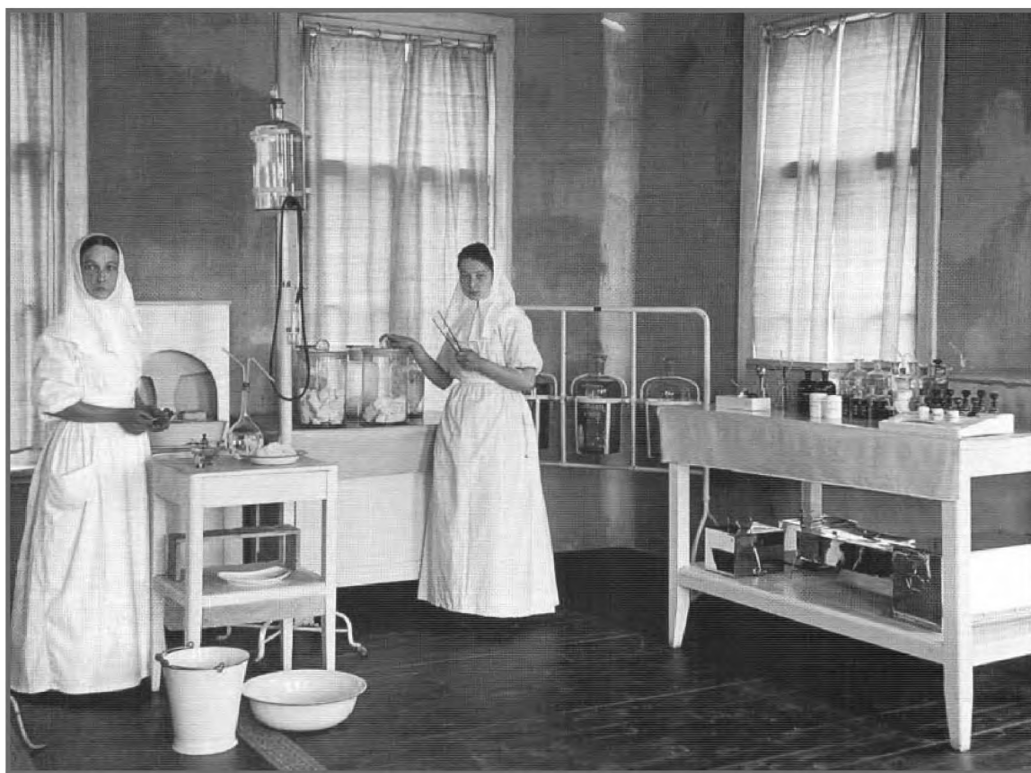
Сестры милосердия в амбулатории Алексеевского общества дел милосердия (1900–1910-е). Фотограф И.М. Пономарев

Среди благотворительных учреждений Успенского острова центральное место занимала больница с аптекой и общиной сестер милосердия. Ежедневно в больницу обращалось до 100 человек, а общее число амбулаторных больных