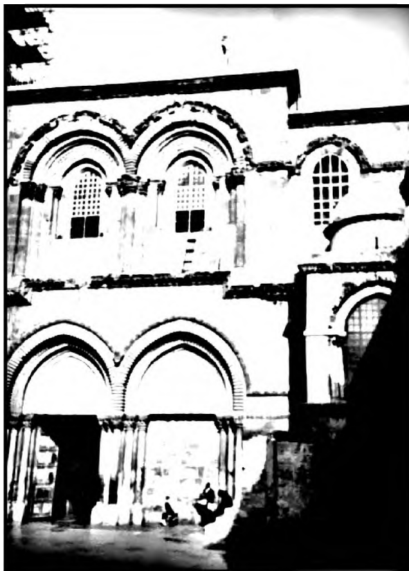
Внутренний дворик Воскресенского храма. 2006 г.

Не однажды и здесь, и в других священных местах несколько раз претерпевшего тотальное разрушение Иерусалима мне говорили: «Это было здесь», опираясь только на Предание. Голос историка во мне подсказывал: «Где-то здесь». Но Иерусалим не становился для меня менее священным.