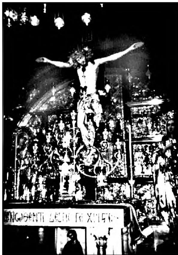
В храме Гроба Господня. Голгофа. 2006 г.

Моим самым горячим желанием было увидеть Гроб Господень. Я все боялась, что что-нибудь помешает, и к храму Гроба Господня мы направились сразу. Милый гид повел меня из гостиницы через переулочки и сказал, что по дороге к себе в номер у меня хорший ориентир — буквально в нескольких шагах великолепный