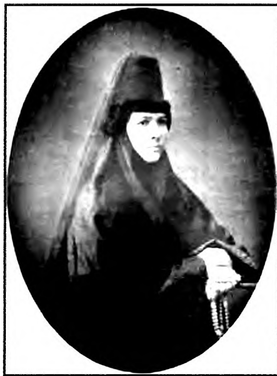
Монахиня Магдалина в юности

В годы правления игуменьи Магдалины (Досмановой) монастырь стал одним из крупнейших в России, в нем проживало более