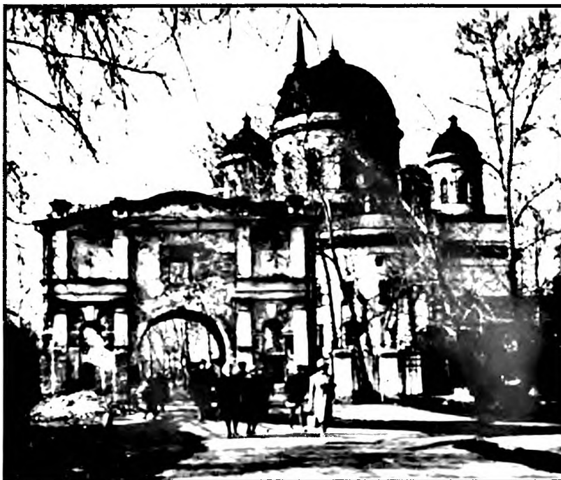
Монастырь в 1960-е годы

закрыла, стала молиться: «Матерь Божия, научи меня спать». А матушка, чтобы я от всего этого не возгордилась, потом две недели меня словно не замечала и к руке не принимала. Но я не понимала этого и хотела, раз так, то и совсем уйти. Потом батюшка наш знакомый пришел, я