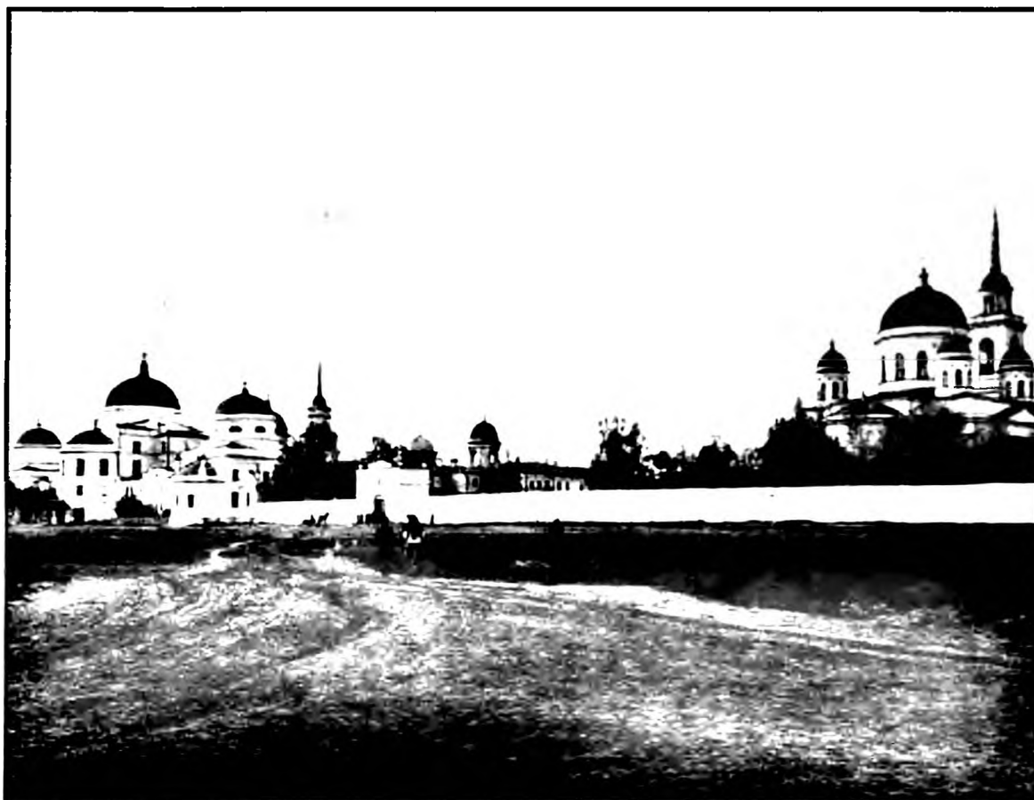
Монастырь в XIX в. Общий вид

На основании изучения уголовных дел, заведенных на насельниц Ново-Тихвинской обители в годы репрессий, мы считаем, что можно проследить четкие закономерности в поведении сестер. Именно те, кто входил в общину матушки Магдалины, не были связаны с обновленцами, не поддерживали раскольнические действия архиепископа Григория (Яцковского) и очень мужественно держались на допросах. А среди тех, кто не был близок к старице, находились сестры, которые окормлялись у священников григорьевского толка и шли на сотрудничество с советской властью.