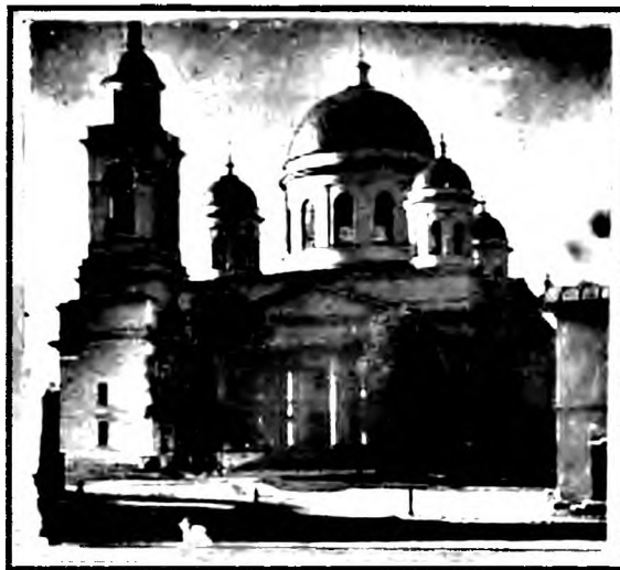
Собор святого благоверного князя Александра Невского. Фото начала XX в.