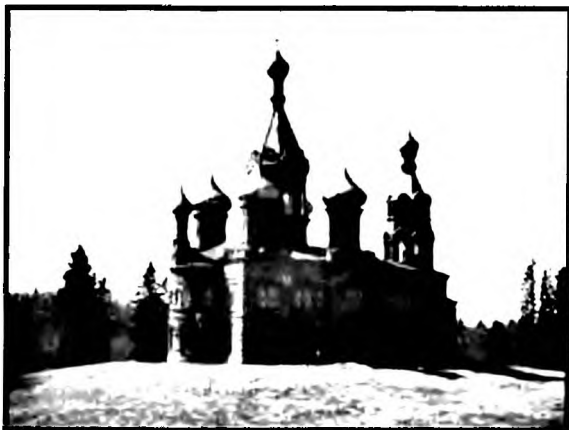
Волговерховский женский монастырь во имя св.Ольги. Основан в 1907 г.

императором на ипподроме. В Киеве есть храм св. Ольги, в 1911 г. был сооружен памятник ей (вместе с апостолом Андреем Первозванным и святыми Кириллом и Мефодием); в 1920-е годы памятник был разрушен, а в 1996 г. восстановлен. Живая память о княгине сохраняется в г. Коростене Житомирской обл. Это — летописный Искоростень (переименован в 1917 г.), древний центр древлян, связанный с расправой над мужем Ольги князем Игорем и ее мстью. Археологические изыскания на древнем городище подтвердили летописные события: обнаружены следы большого пожара середины X в. 15 Как свидетельствуют историки, эта «священная война» Киева со своими соседями носила сакральный языческий характер (есть скандинавские аналоги) и определялась ритуалами, обеспечивающими достойную загробную участь душе князя, погибшего, по языческим представлениям, позорной смертью, а также дальнейшее существование его государства 16 . В Коростене зафиксированы Ольгинские церковь, купальня, зеркала (на р. Уж), колодцы, камни, урочища; ныне есть храм св. Ольги, улица ее имени. В Коростене сделана попытка актуализировать давнее противостояние средствами монументального искусства: на самой высокой точке скалистых берегов извилистой речки Уж в 2005 г. на средства семьи Тищенко был поставлен памятник