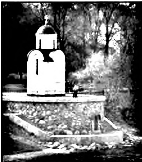
Часовня св. Ольги на месте явления ей трех светозарных лучей. Архитектор А.А. Красильников. 2000

Особенно прочная память о св. Ольге сохранилась в Псковской земле 6 , на территории,