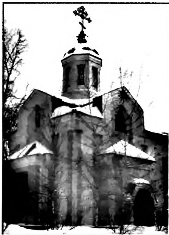
Храм-часовня св.Ольги возле церкви Вознесения у Серпуховских ворот. Архитектор Валерия Шубина. Москва

Из других мест Псковщины память о св. Ольге сохранялась в Гдовском у. (в XIX в. входил в