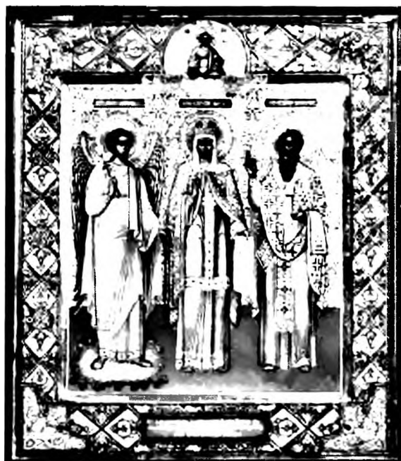
Ангел-хранитель, св.кн.Ольга, свщмч.Акепсим. Образ написан в честь рождения в царской семье 3 ноября 1895 г. первенца – княжны Ольги.

Святая равноапостольная княгиня Ольга, в крещении Елена (ум. 969) – одна из первых русских княгинь-христианок и святых жен, предвестница христианства на Руси, «как денница перед солнцем и как заря перед светом». Обладая христианскими качествами: целомудрием (предание о ее знакомстве с Игорем в лодке), праведностью (после гибели мужа не вышла вторично замуж), терпением и смирением (не навязывала веру насильно, ее окружение и даже сын Святослав были язычниками), – она приняла крещение за 30 лет до всеобщего крещения Руси и основала несколько церквей (Св. Троицы во Пскове, святителя Николая на могиле князя-христианина Аскольда, деревянную св. Софии в Киеве и др.). Помимо религиозных преобразований она твердо управляла Русской землей и провела ряд культурных и политических реформ, о которых будет сказано ниже. Как писал М. О. Меньшиков, ««мудрейшая из людей» не только вывела народ из тьмы язычества, но и отстояла его от внутреннего разложения и внешнего разгрома» 2 . В ее деятельности можно выделить несколько направлений: 1) христианское про-