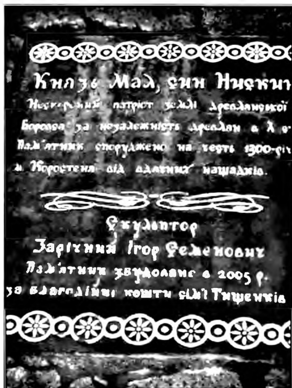
Табличка перед памятником князю Малу