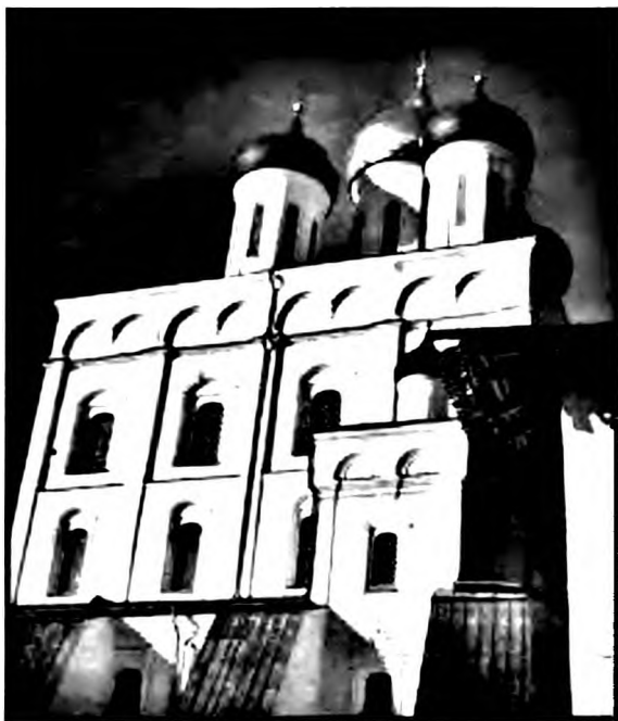
Троицкий собор. г. Псков

государства, усиление обороноспособности страны (подавление мятежа древлян, мужество во время осады Киева печенегами, строительство городских укреплений); 4) государственное устройство Русской земли (введение системы погостов, установление оброков, даней, уроков); 5) благотворительная деятельность по устройению приютов и богаделен 3 .