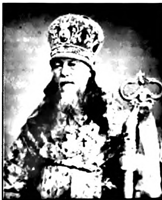
Епископ Никодим (Казанцев)

Епископ Никодим был заметной фигурой в Русской Православной Церкви XIX в. 3 Его записка «О Святейшем Синоде» и воспоминания о Московском митрополите Филарете (Дроздове) привлекались как источник по истории Церкви 4 , а записки о времени пре-