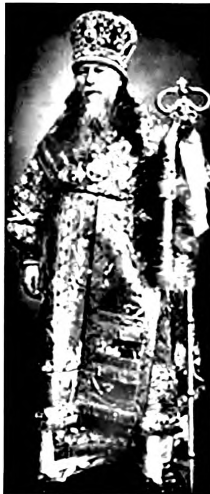
Епископ Никодим (Казанцев)

Завершающая часть путевых записок относится к возвращению из Сибири. Это дневник путешествия, дополненный и, вероятно, частично переработанный во время жизни в Перевинском монастыре. По-прежнему отмечаются почтовые станции, даты и т.п. В тексте часто встречаются ретроспективные моменты — рассказы о событиях и впечатлениях на пути в Сибирь, о сибирских происшествиях и отношениях с оставленными там подчиненными и знакомыми. Такой же по сути характер носят и указания на специфику сибирских реалий — кстати, почти всегда не в пользу Сибири. Например, увидев по дороге к Тобольску речную «мельницу хорошего русского устройства», епископ замечает в скобках, что «в Сибири уродливые, безобразные, неудобные и очень маленькие мельницы» 69 . Никодим обвинял сибиряков в том, что они выжигают леса и превращают всю прекрасную растительность в корявые кустарники и пни 70 .