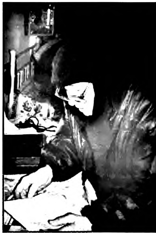
Сельская чернилка. Тамбовская обл. 2006

села, тайно собираясь в одном из домов. Так продолжалось до 1964 г., когда вышли из печати и поступили в продажу Псалтирь и молитвослов 71 .