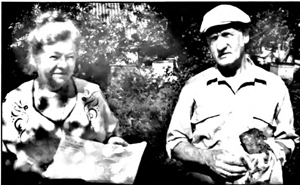
Семья Лермонтовых с рукописью Евангелия. Псковская обл. 2005.

Евангелие в храме хранится в алтаре на престоле. Богослужбное Евангелие имеет красивый оклад. До революции существовала традиция жертвовать Евангелие или драгоценный оклад для него в монастыри и приходские храмы. Таким образом, Евангелие являлось своего рода милостыней, которую в различной форме традиционно подавали с молитвой как о здравии, так и об упокоении.