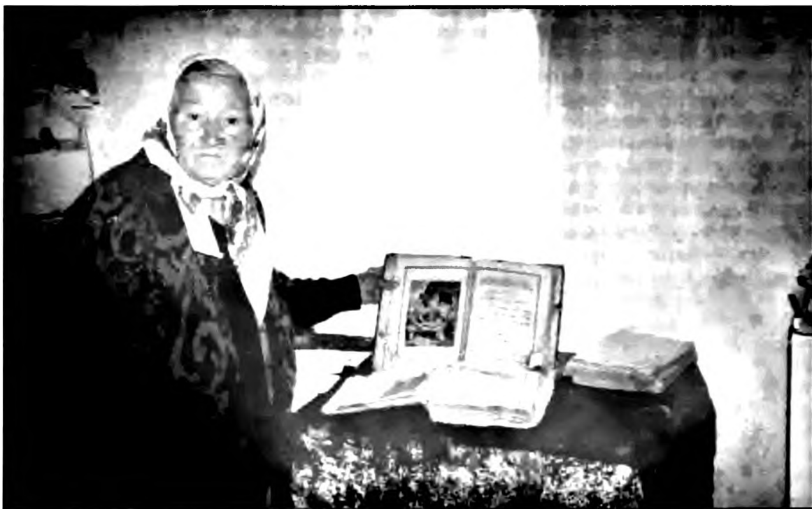
Демонстрация семейного архива. Село Болото, Курская обл. 2003

цию, т.е. Евангелие может входить в так называемую молитву по соглашению, когда несколько человек договариваются молиться о чем-либо или о ком-либо, при этом они, как правило, не собираются вместе, но часто договариваются молиться в одно время. Так, прихожане московского храма Никола Красный Звон по благословлению духовника каждый день в рамках своего домашнего молитвенного правила читают Евангелие за тяжело болящих членов приходской общины 90 . Прихожане храма Димитрия Ростовского в Очаково читают Евангелие о спасении России 90 .