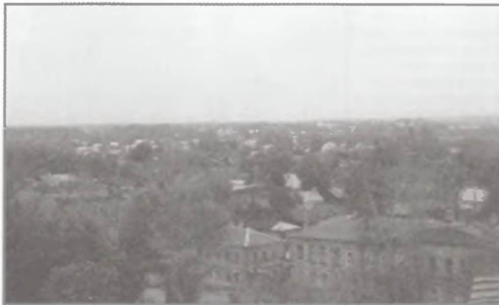
Вид на Моршанск и Коршуновку с высоты Троицкого собора. Фото 2005 г.

Ананиных, Казиных... Здесь ему всегда были рады. Некоторые из них являлись крепкими и по крестьянски зажиточными. Тем не менее, никто не боялся оставлять юродивого одного в доме знали, отец Николай ничего не возьмет, не сломает. Будет стоять на коленях и молиться, поспит где скажут, покушает постного, что дадут, а когда захочет сам уйдет.