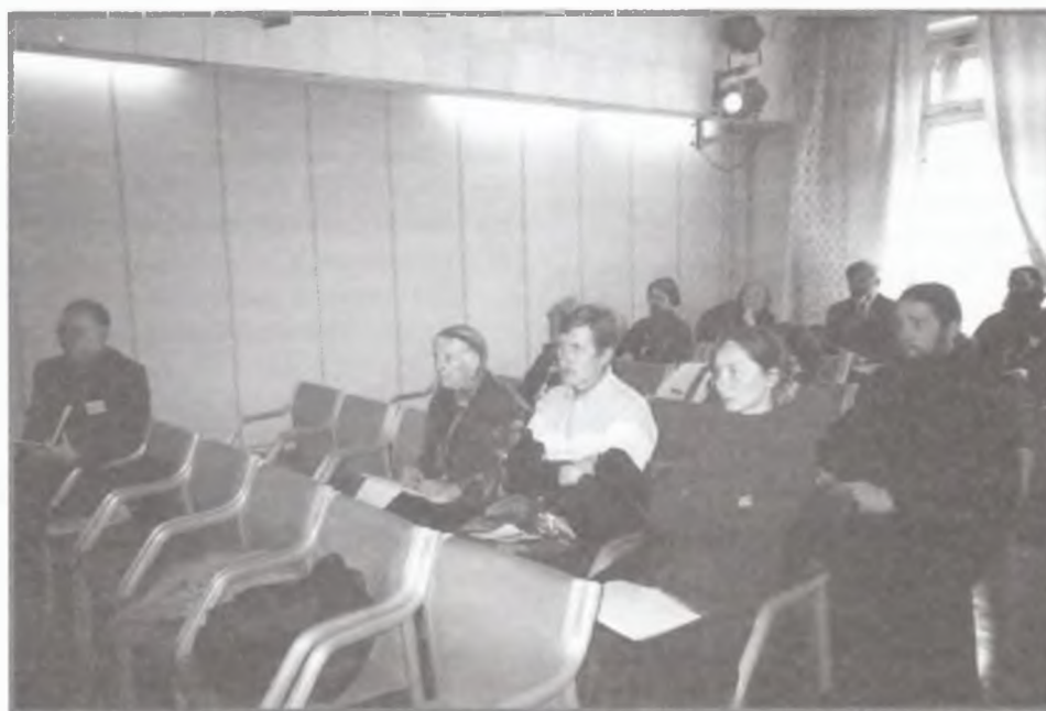
На секционном заседании конференции.

нального масштаба, которые важны и значимы не только для верующих православных христиан, но и для всех, кто искренне любит Россию и связывает с ней будущее своих детей. Возвращение такого понимания на новом историческом этапе, в новых условиях требует свободного и открытого диалога во всех слоях общества. Нынешняя конференция