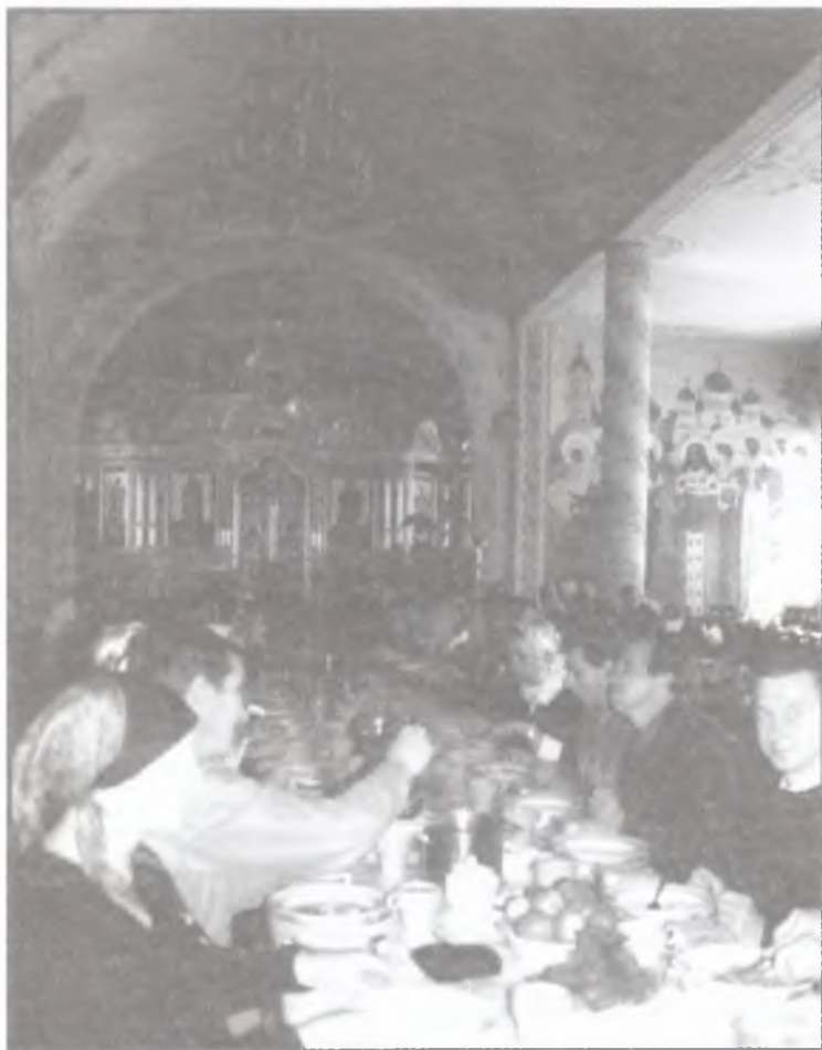
Участники конференции 2005 г. за трапезой в Свято-Троицком Серафимо Дивеевском монастыре.