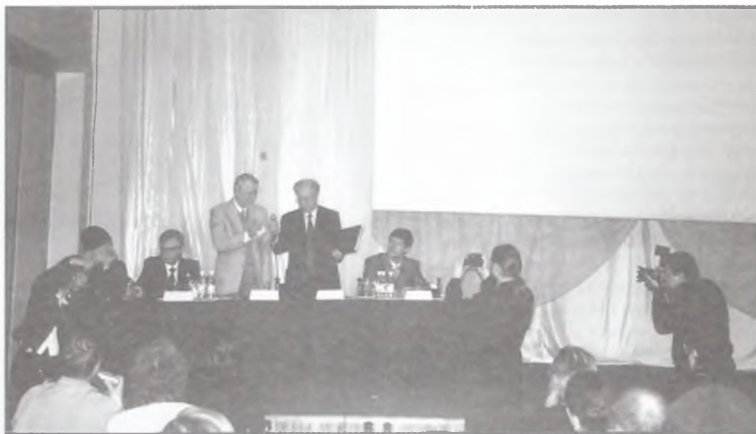
Приветствие участников конференции в городе Сарове.

знал свои миссию наш русский народ, сложилась и окрепла российская государственность. Когда-то это знал и понимал каждый гражданин России, каждый ее школьник. Однако сегодня, после десятилетий атеистического беспамьяства, наше общество заново учится воспринимать русских святых как деятелей истории и культуры общенацио-