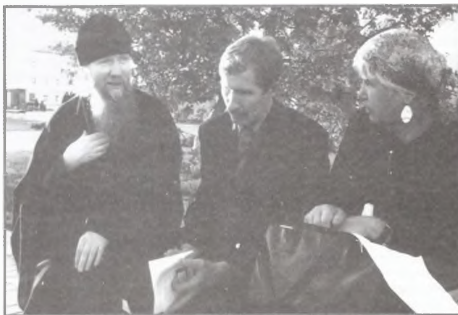
Участники конференции 2005 г. в Свято-Троицком Серафимо Дивеевском монастыре.

славного предания (тем более, если оно зафиксировано святыми людьми) на основе любого вновь найденного документа: ведь и архивный материал может быть тенденциозным и требует, как известно, сопоставления с другими видами источников. Кроме того, ученый, со всей ответственностью внося документальную достоверность в освещение православных традиций, не должен брать на себя функцию арбитра во внутрицерков-