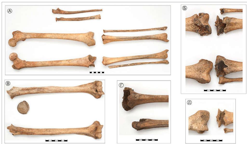
Рис. 2. Преднамеренные повреждения в области суставов: