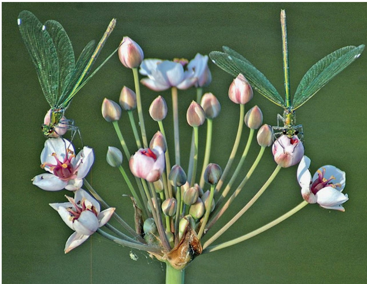
Самки красотки блестящей Calopteryx splendens на цветах сусака зонтичного. Река Мстёрка в окрестностях пос. Мстёра.