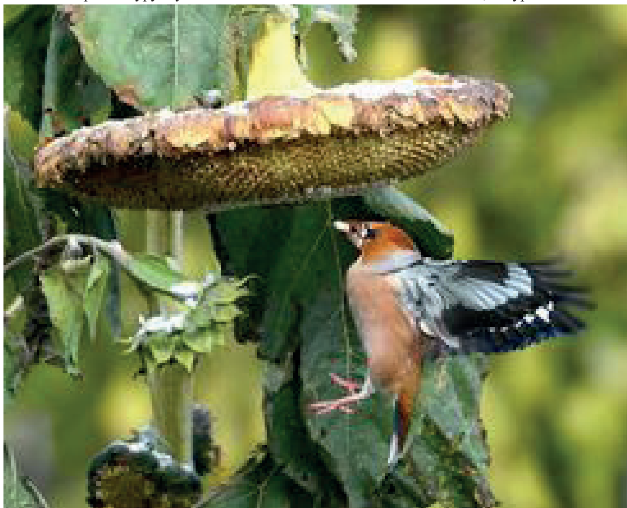
Дубонос Coccothraustes coccothraustes лакомится семечками подсолнуха на дачном участке фотографа в пос. Мстёра. Евгений Николаевич специально сажал на участке растения, привлекающие птиц.