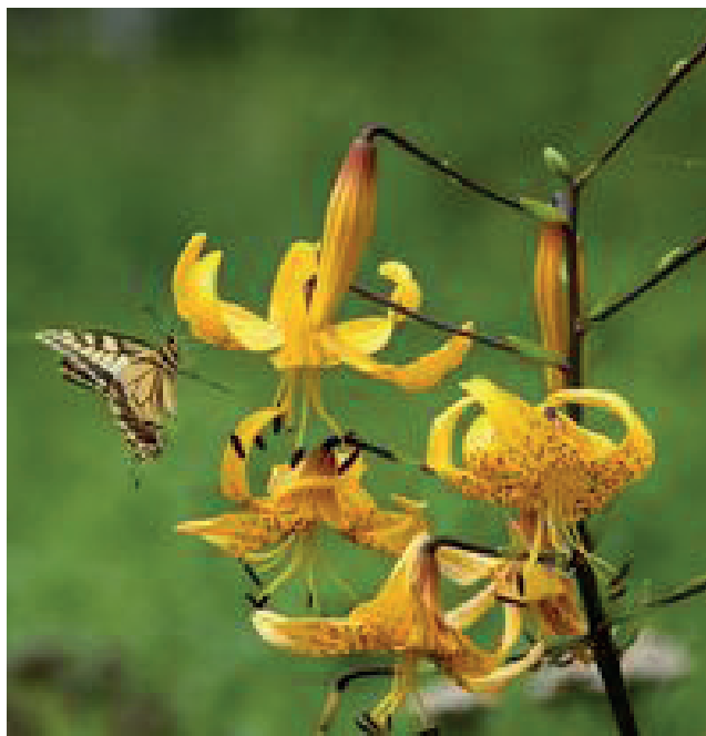
Махаон Papilio machaon на участке фотографа в посёлке Мстёра.