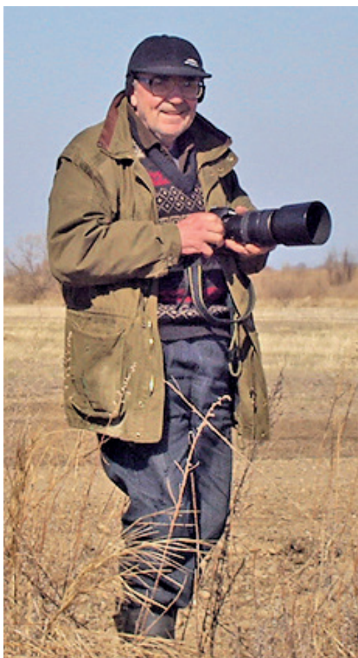
Осень на мстёрских лугах