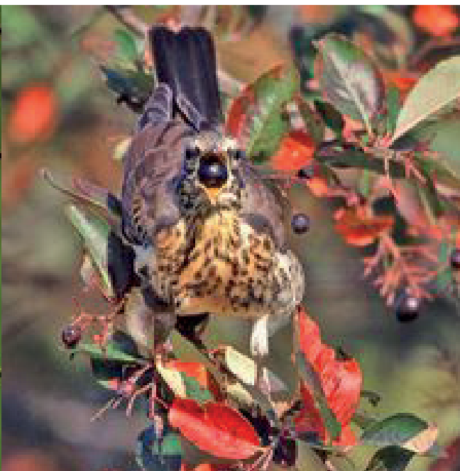
Дрозд-рябинник Turdus pilaris поедает ягоды черноплодной рябины в деревне Шилово Костромской области.