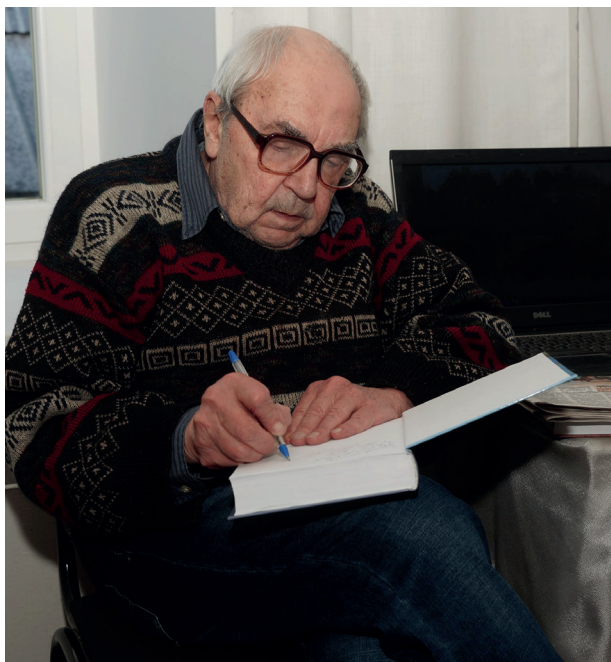
Е.Н. Панов подписывает свои книги жителям поселка Мстера. Мстерский художественный музей, 2017 год.

Выставка фотографий Е.Н. Панова в Мстерском художественном музее, 2017 г. С Народным художником России, мастером лаковой миниатюрной живописи Львом Александровичем Фомичевым и Е.Ю. Павловой.