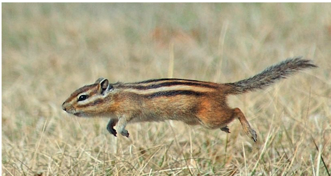
Сибирский бурундук Tamias sibiricus в Хинганском заповеднике, Амурская область