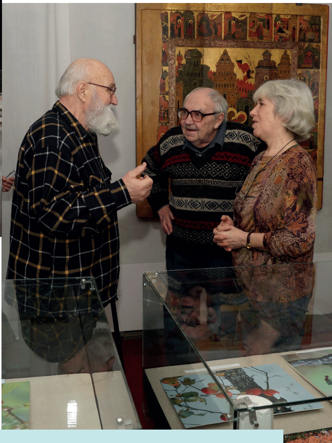
Весна 2020 года. На клязьминском венце. Окрестности города Вязники Владимирской области

Выставка фотографий Е.Н. Панова в Мстерском художественном музее, 2017 г. С Народным художником России, мастером лаковой миниатюрной живописи Львом Александровичем Фомичевым и Е.Ю. Павловой.